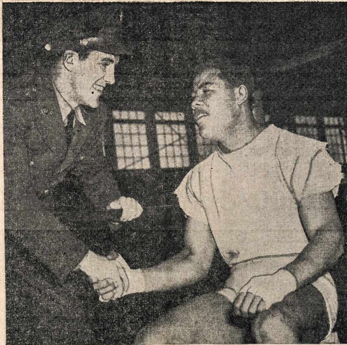
TAME POCIAME KAMPE jiedu kitą syk susitiko, kaip oponentai, dabar Billy Conn (kairė), jau Dėdės Samo karys, sveikina Joe Louis, kurį sutiko besitreniruojantį at Fort Dix, N. J.