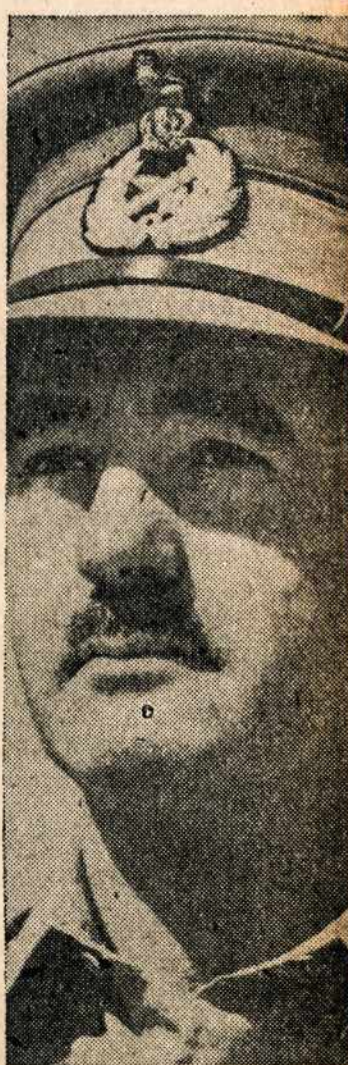
AT HELM IN THE EAST— Gen. Sir Leslie Morshead, commander of the Australian 9th Division, is now in charge of Aussies in the Middle East, following departure of Gen. Sir Thomas Blamey for homeland as MacArthur aid.