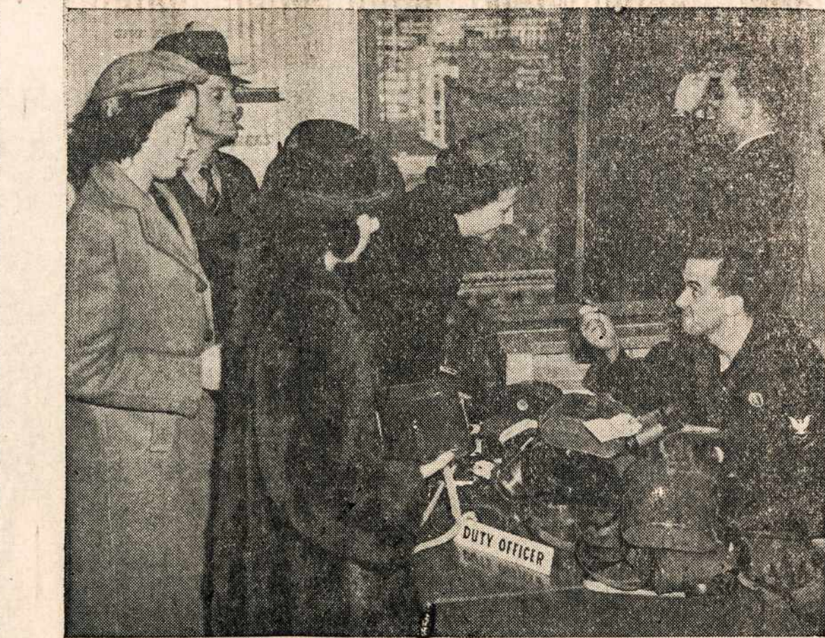
Dovana per karo laiką. Yra raginama, kad turintieji civiliai binoculars, (žiūronus), kad skolintų laivynui per karo laiką. Vaizde matome, kai šie asmens tokias dovanas paskolino ir laivyno ofiso karininkas įregistavo, New Yorke.

Kovo pabaigoje Lietuvos kraštų vyriausybės, kuri Ministras Vašingtone yra pareiškęs mintį, kad šale tiesioginės ir ypatingos visuotinio uždavinio iš- laisvinti Lietuvą iš sveti- mos okupacijos yra dar specifiškas ir opus rūpes- nis surasti būdus pagelbėti tremtiniais tolimame ištremime, Sibire ir kitur. Lietuvos Atstovo tikėtasi, kad su draugingu vyriausybių pagelba bus suras- tas pagelbos būdas ir kad tam tikslui patarnaus Atlantic Declaration dva- siai ir pasirašymas United Nations paktą ir per tu