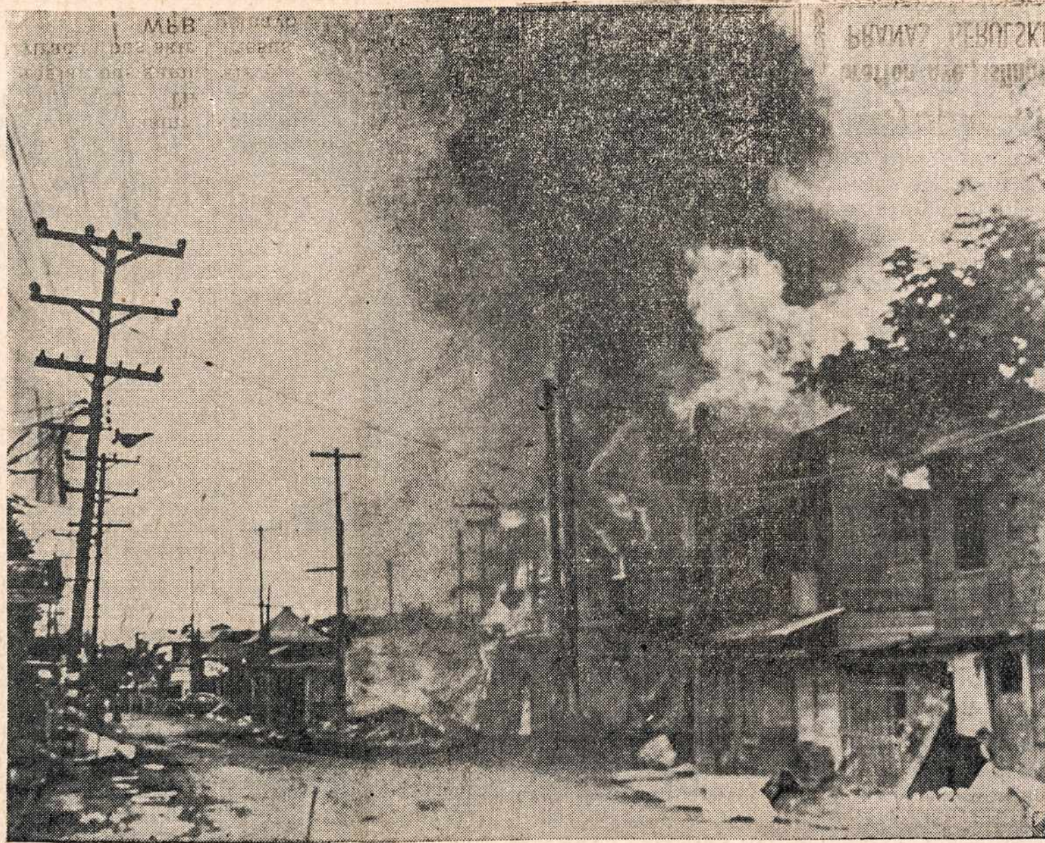
Karas — naikintojas. Tik ugnies liežuvių bučiuojami dūmų debesys nešasi į padanges darbininkų žmonių turtą Philipinuose, kai japonai apmėtė padegantiomis bombomis taikiųjų žmonių rezidencijas.

Vajui surinkti išmestus metalus, švinas yra vienas iš svarbiausių metalų. Karo Produkcijos Taryba bando visokiais būdais pri-