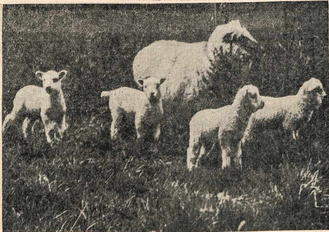
Retas ketvertukas. Tai iš Albany, Ore., kur retu atsitikimu avių gimnėj matoma ketvertukas. Gražiai visas būrys žiopso, tur būt į savo šeiminką.

Kitose maišytose tikybės šalyse yra kitaip, su nelengva našta katalikams, kurie Episkopato globojami ir vedami, pasaulinei dvasiškijai ir vienuoliams be poilsio dirbant, vienomis savo lėšomis, laiko katalikiškas mokyklas savo vaikams, kurių iš jų reikalauja jų sąžinė, ir su girtinu duosnumu bei ištverme laikosi nusistatymo patikrinti pilnai, kaip šūkiu formoje skelbia: "Katalikišką auklėjimą, visam katalikiškam jaunimui, katalikiškose mokyklose". Tos katalikų mokyklos, jei negauna pagalbos iš viešojo išdo, kaip to reikalauja teisingumas, tai bent negali būti trukdo-