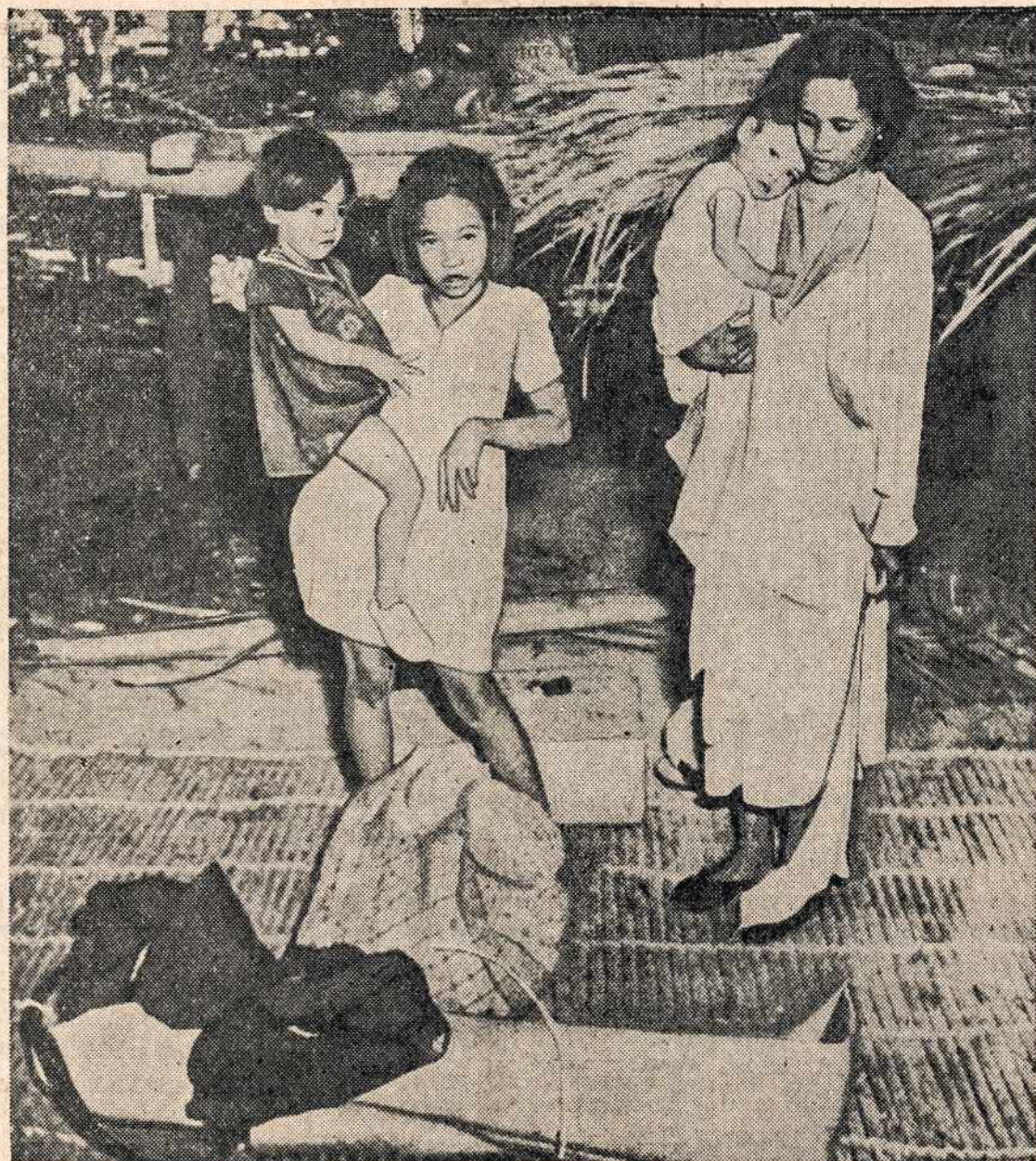
Matome vienos iš daugelio filipinų šeimos išsikraustymą iš namų, kai japonų hordos vis arčiau ir arčiau veržėsi su karo mašina.