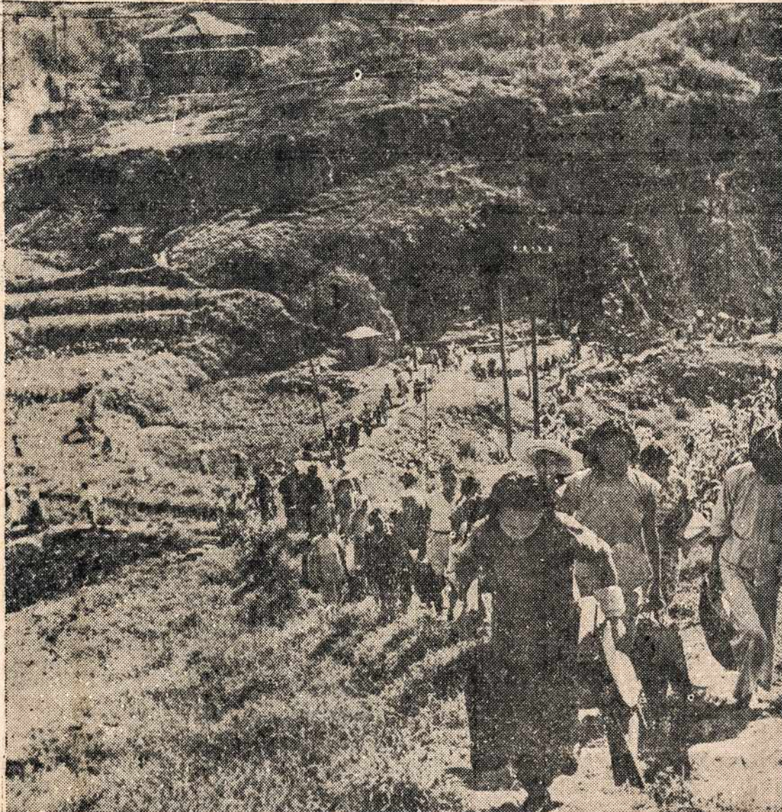
Chungking miestas dažnai yra japonų bombarduojamas. Vaizdas parodo, kai to miesto gyventojai po japonų bomberių sugrižimo nuo miesto tai gyventojai grįžta iš slėptuvių, kurios yra labai saugios kalnuose.

Remkite tuos profesionalus ir biznierių, kurie savo skelbimais remia "Darbininką".