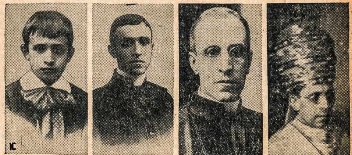
J. Š. Popiežius Pius XII, nuo kūdikiystės ligi Popiežiaus Vainiko. Jauniausias, devynių metų; jaunas Monsignor šv. Kongregacijos Bažnytinių reikalų; trečias jo paveikslas iš kairės į dešinę — kai buvo konsekrutas Arkivyskupu gegužės 13, 1917, ir jau su Popiežiaus Pius XII vainiku, tik po vainikavimo kovo 12, 1939.

Vos už kelių dienų, geg. 13, 1942 m., mes švėsime 25 metų jo vyskupystės sukaktį. Ta išskilmė visiems pasaulio katalikams bus diena maldos ir padėkonės Visagaliui Dievui, kad mums davė tokį šventą, išmintingą ir drąsų Aukščiausią Ganytoją, kurs sielvartų, liūdėsio ir vargų dienoje vairuoja šv. Petro laivą per audringus vandenynus. Žiaurūs vėjai ir neprietelingos bangos iš visų pusių tą laivą puola ir blaško; bet Dievo pagalba ir visų katalikų maldos atsieks tai, kad Kristus vėl įsakys audroms ir vėjams nutilti. Jis vėl suramins ir sustiprins savo Vietininką, kad galėtų atsilaukyti prieš visas sunkenybes ir pavojus, kurie grėsia Dievo Karalystei ant žemės. Per Dievo pasigailėjimą ir visos, tikėjime ir meilėje vieningos Krikščionijos maldas, Kristus vėl nugalės visus savo priešus ir atves į ramų uostą tą nesudaužomą laivą, kurio vairuotoju yra Jo ant žemės Vietininkas, šv. Petro Įpėdinis, šv. Bažnyčios Galva, Pijus XII. Teužlaiko ir saugoja jį Viešpats, tesuteikia jam stiprybės ir drąsos ir teišgelbsti jį nuo žabangų jo neprietelių, kurie yra ir paties Dievo neprieteliai.