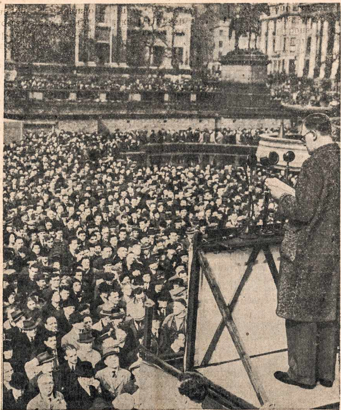
Nežiūrint žiauraus nacių bombardavimo Londono miesto ir apylinkės londoniečiai, pilni entuziazmo kovoti su Hitleriu, didelį minioj klausosi vieno parlamento nario kalbos.

jai gali tik ta širdis, kurioje paskutinė kilnumo kibirkštis yra užgesusi, kurioje visos gražiosios šio ir amžinojo gyvenimo viltys yra sudužusios.