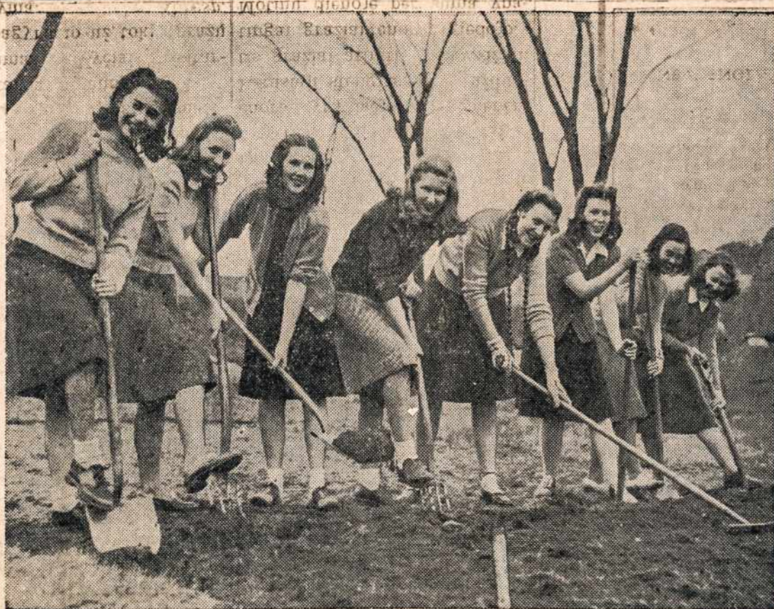
Naujokės - ūkininkės — Tai merginos iš Girls of Good Counsell College, White Plains, N. Y., pradeda kasti Victory Garden, prie gyvenamo bendrabučio.

Phone 1181 A. P. KARLONAS Lietuvis Graborius NOTARY PUBLIC 280 Chestnut St. New Britain, Conn.