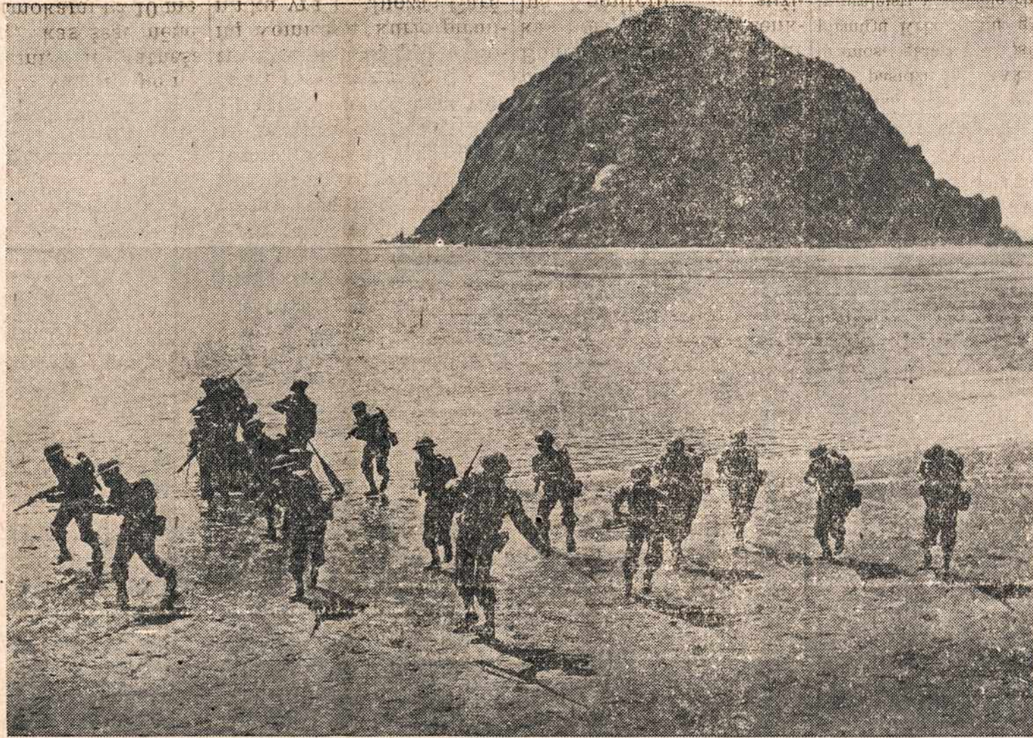
Filipiniečiai kariai treniruoja kariškų pratybų, tikslu, kad nuvykus į Filipinus - tėviškę išvyti priešą-japoną iš jų žemių. Šitie kariai yra vadovybėje amerikiečių ir filipiniečių karininkų. Šitas vaizdas pagautas, kai filipiniečiai pilnam kariškam pasiruošime Camp Louis Obispo, Calif., buvo išėję į pajūrus daryti puolimo mankštą.

Karas jau trečietai te-sias. Nežinia kaip ilgai dar nusitęs. Bet viena tai tik-ra, kad greita pergalė pri-tybių Išdas parūpina do-vanai albumą, kai tik nu-siperki pirm 25 centų žen-klą ar daugiau, kad padė-