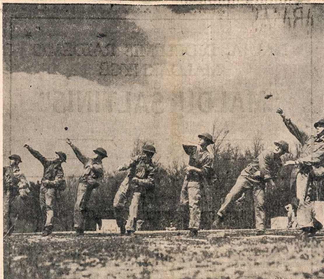
Būsimieji leitenantai iš Marinių korpuso Indiantown Gap, Pa., laike metimo granatų pratybų. Tai yra rinkiniai studentai iš Annapolio mokyklos.

Kai lapkr. 16, 1929 m. Monsignoras Paccelli buvo pakeltas Pijaus XI į Kardinolus, daug kas pranašavo,