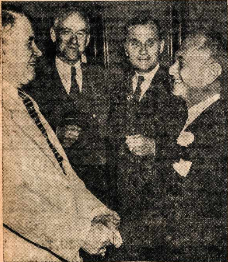
Senatorius Alben Barkley, sveikina Philippinų okupuotosios valstybės prezidentą Manuel Quezon (dešinėje).

BUY UNITED STATES DEFENSE BONDS AND STAMPS