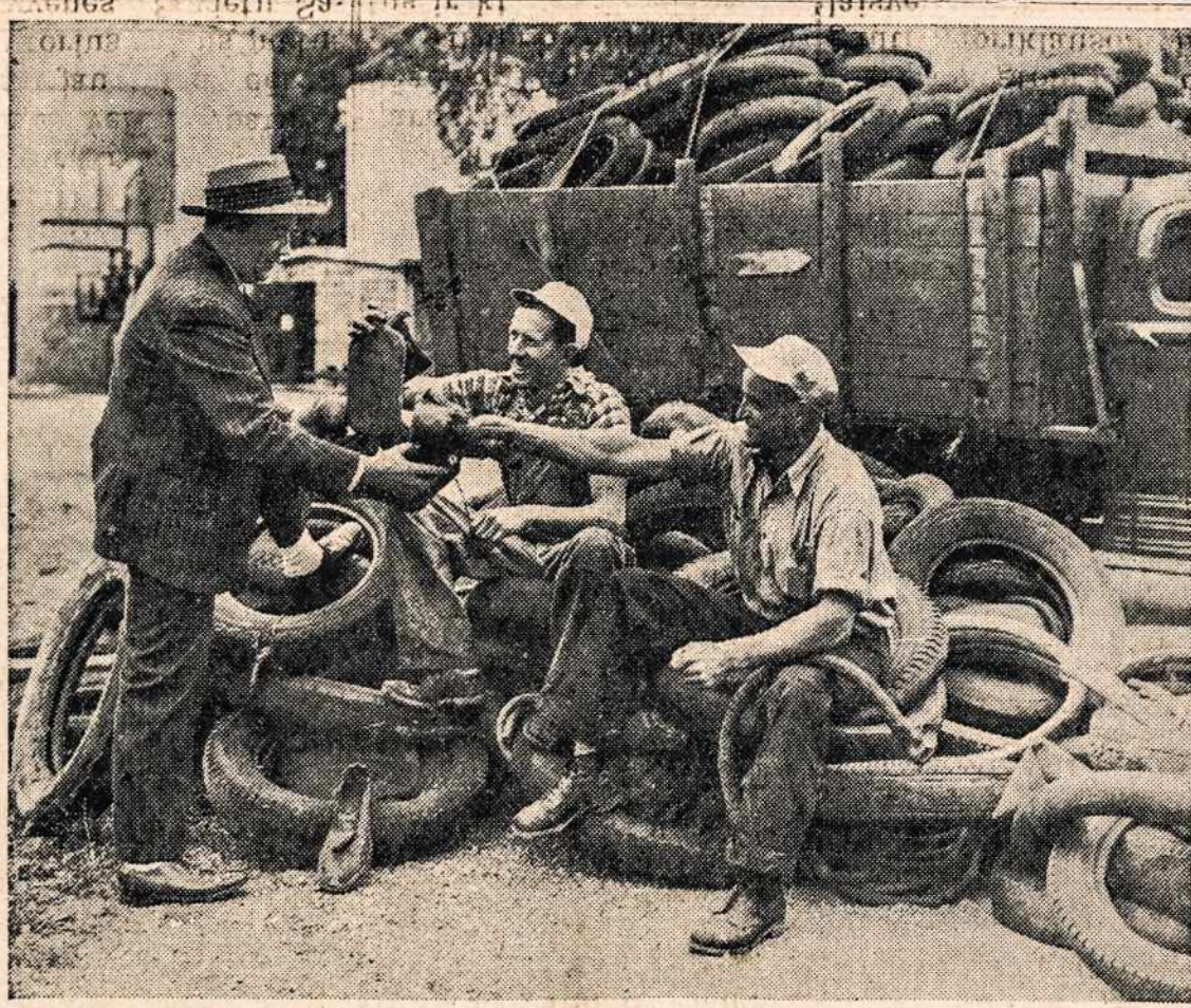
Farmers don't keep them down on the farm. Thousands of tons of rubber tires — originally bought by Massachusetts farmers for smudge purposes — are being turned in to gasoline filling stations throughout the state, as Bay State orchard men get behind the scrap rubber drive launched by President Roosevelt.

"Baltijos valstybių: Lietuvos, Latvijos ir Estijos įkorporavimas į Sovietų Sąjungą buvo įvykdytas ginkluotu užkariavimu. Jis nebuvo de jure pripa-