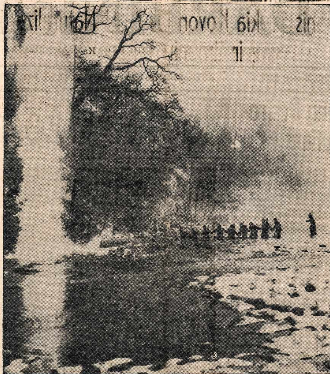
Britų kariai praktikuoja invazijos metodus. Kariai susiėmę rankomis pereina upės srovę po priedanga artilerijos ugnies ir dūmų.

Štai po trumpos pertraukos prasideda "Lietuviškų vestuvių" ceremonijos. Štai būrys Lietuvių papročių gerbėjų, energingų moterėlių, kurios inscenizuoja vestuvių ceremonijas. Jos gražiai sudainuoja vestuvines dainas. Jis seka minia žmonių, kurie smalsiai įdomajasi tomis scenomis. Tai vienas pluoštelis