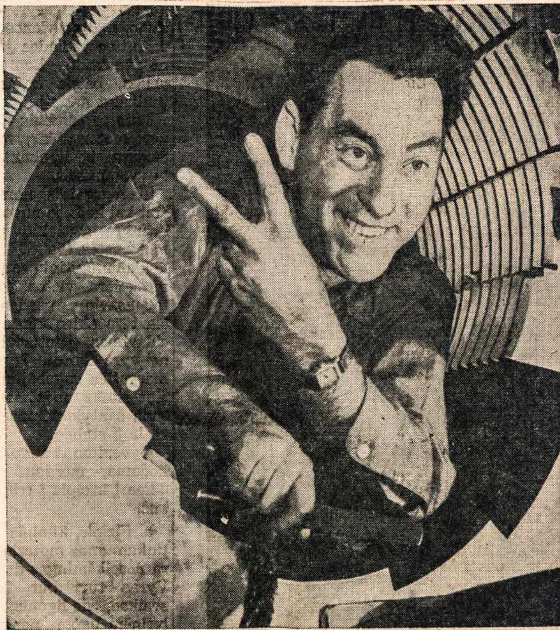
Šis vyras įlindęs į 16-kos colių pakrančio kanuolės vamzdį. Jis mylės būti prie kanuolės ir kai ji meta mirties bolę. Ir tai dėl pergalės.

Nors šv. Mišių vertė yra begalinė ir kiekvienas tu dangiškų turtų gali semti kiek tik norėdamas, tačiau žmogus pasisemia jų pagal savo prisirengimą, dievotumą ir sielos stovį. Reikia, tad, būti didžiai susikauptam, atmesti į šalį visus žemiškus rūpesčius ir dvasiškai būti su Marija po Kalvarijos Kryžiumi, pilnas gilių pagarbos ir gyvas tikėjimo. Geriausiai reikia priimti šv. Komuniją, nes Komunija yra Mišių dalis. Jei ne tai, gera būtų sužadinti gailestį ir susivienyti su