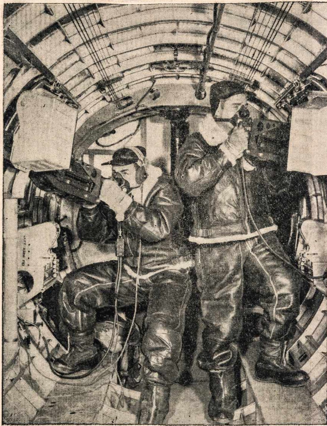
Lekiančios tvirtovės - bombardierio kovotojai praktikuojasi bendram puolime ir apsigynime. Šie kariai pratinasi, kaip iš lėktuvo pasiekti priešo - puoliko orlaivį ir jį nukirsti, kad atsiekus savo puolimo tikslą.

Klausiau tų giesmių su plakančia širdimi. Alpa-