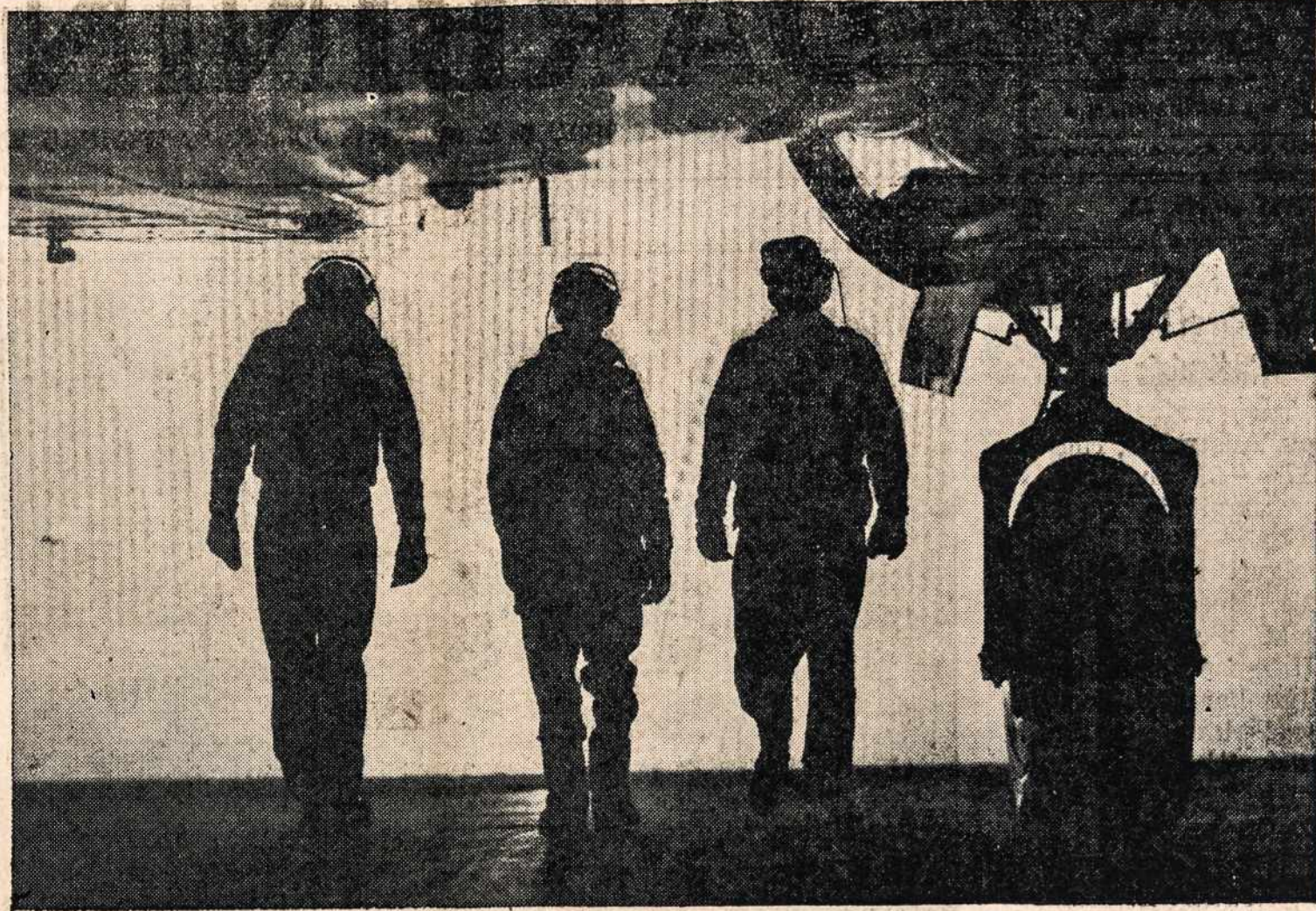
Šie trys masketyrai, Amerikos Oro Jėgų specialistai, šešelyje milžino bombierio, nukreipę savo rimtą žvilgsnį tekančios saulės kryptimi. Jie treniruojasi Midland, Texas lakūnų mokykloje ir neužilgo sudraus priešą - japoną, kuris ten tulumoj, — "saulėtekyj" lig šiol klastingas tūnoja.

L. P. S. Ž. No. 12. 1942 - VIII - 12. Washington, D. C.