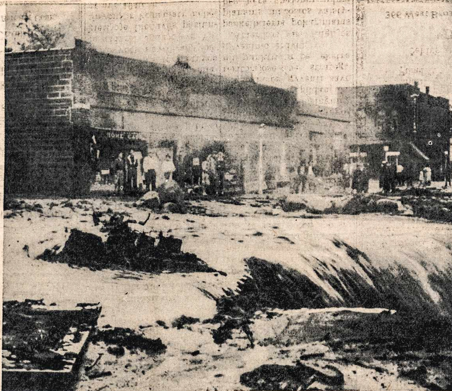
Wisconsin ūkininkai per ilgą laiką pageidavo lietaus. Bet kai pradėjo lyti, tai lietų pripildė upes, kurios patvinusios išsiliejo iš krantų ir užliejo daug derlingos žemės, o srovė vandens padarė daug nuostolių. Štai vienas iš daugelio vaizdų Bayfield'e.

Lietuvos Nepriklausomybės pripažinimo paminėjimas tikrai pavyko ir pilnai parodė, kad lietuviai vertina nepriklausomą Lietuvą, kad jie yra dėkingi savo vyriausybei už visą teiktą ir teikiamą paramą jų