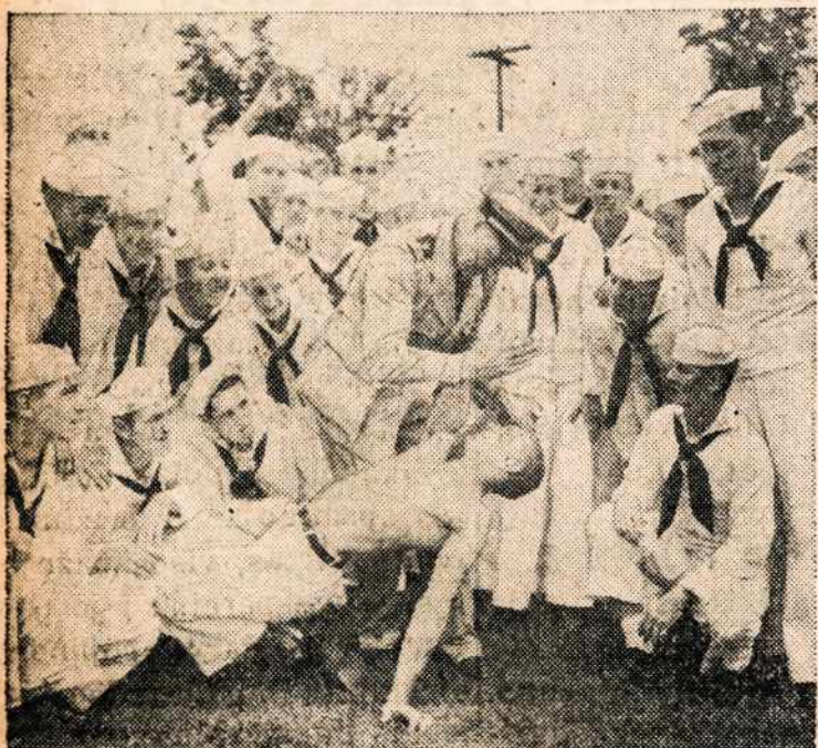
Lt. Jack Dempsey, buvęs sunkiojo svorio bokso čempionas, mokina jūrininkus U. S. Coast Guard, Battle Creek, Mich.