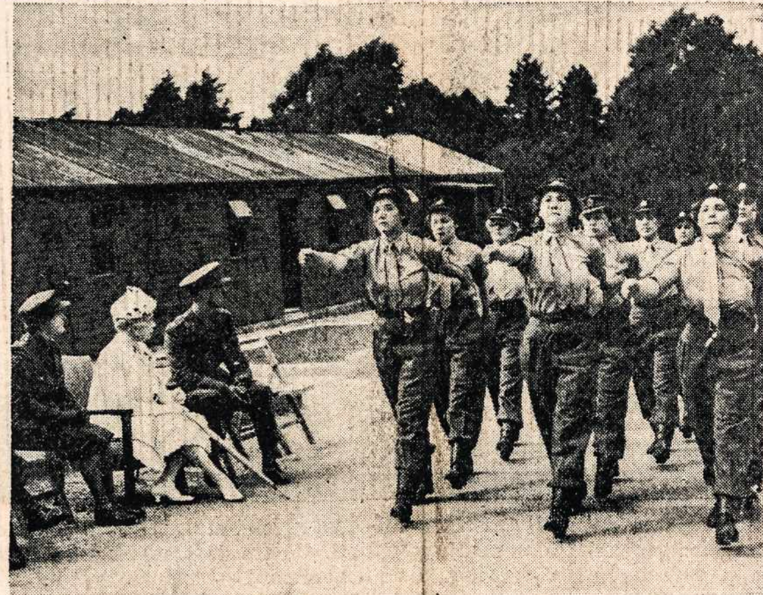
Žygiuojančių karių - merginų būrį peržiūri Anglijos karalienė Mary (baltais drabužiais sėdinti) ir kunigaikštė iš Gloucester (kairėj).

Charlotte, N. C., rugp. 17 — Daug kartų esame