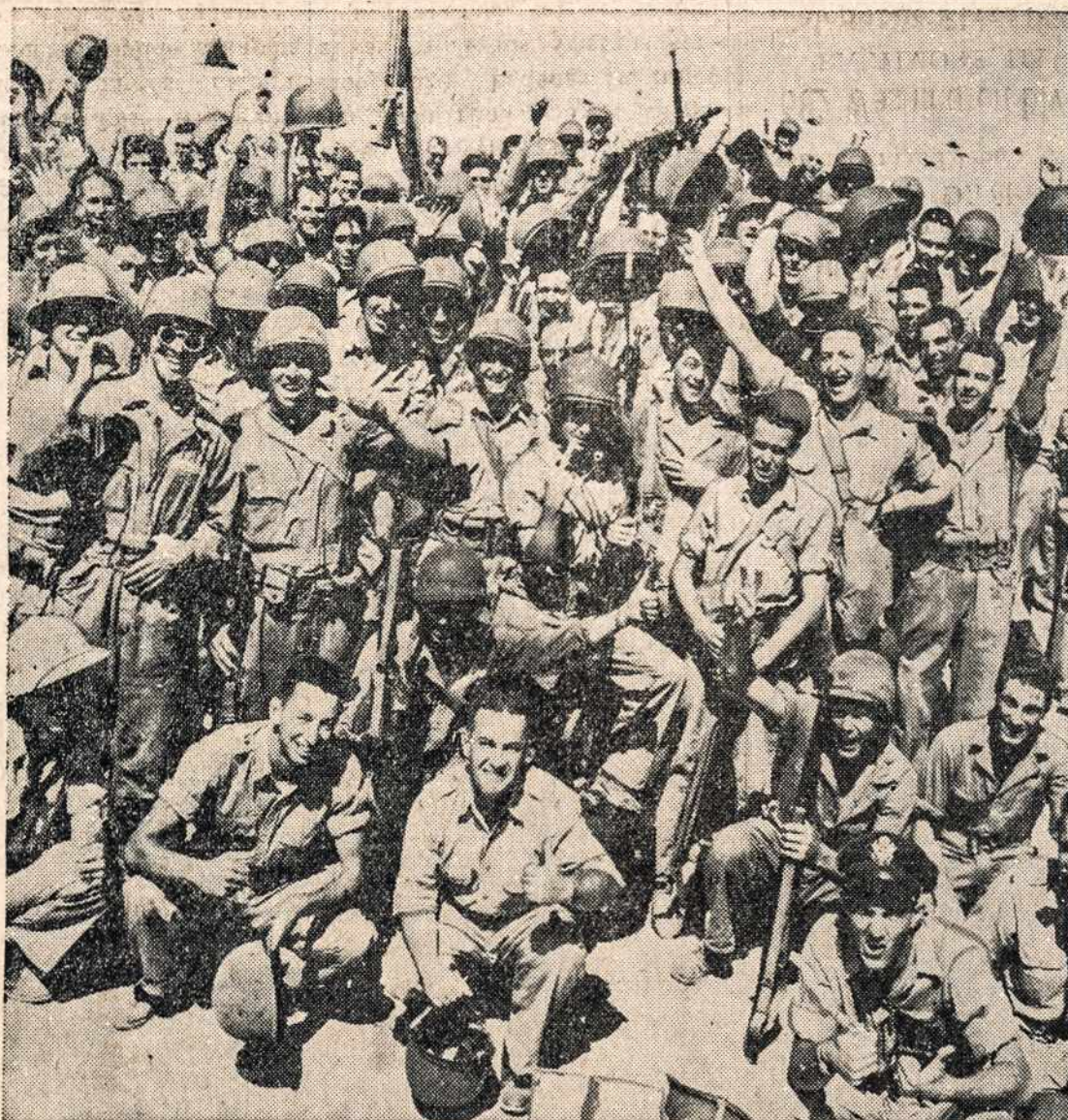
Dėdės Samo kariai, naujai atvykę kur nors Viduriniuose Rytuose, kupini energijos ir drąsos, kad susikirsti su priešu. Jie visi šaukia du pirštus pakelę "V" — "for Victory".