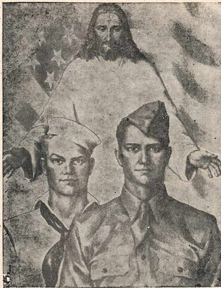
Kristus globoja ištikimuosius savo vaikus.

"Ar gali būti kas svarbiau, kaip mūsų laikų žmonėms skelbti neištiriamus Kristaus turtus? Tikrai nieko nėra kilniau, kaip išskleisti Kristaus Karaliaus vėliavą ir didžiųjų dalykų rodyti tiems, kurie sekė ir tebeseka paskui apgaulingus ženklus, ir gražinti po nugalintį Kristaus vėliava tuos, kurie ją nelemtai yra pametę? Kas tad, matydamas tokią daugybę brolių ir seserų, kurie, klaidų apakin-