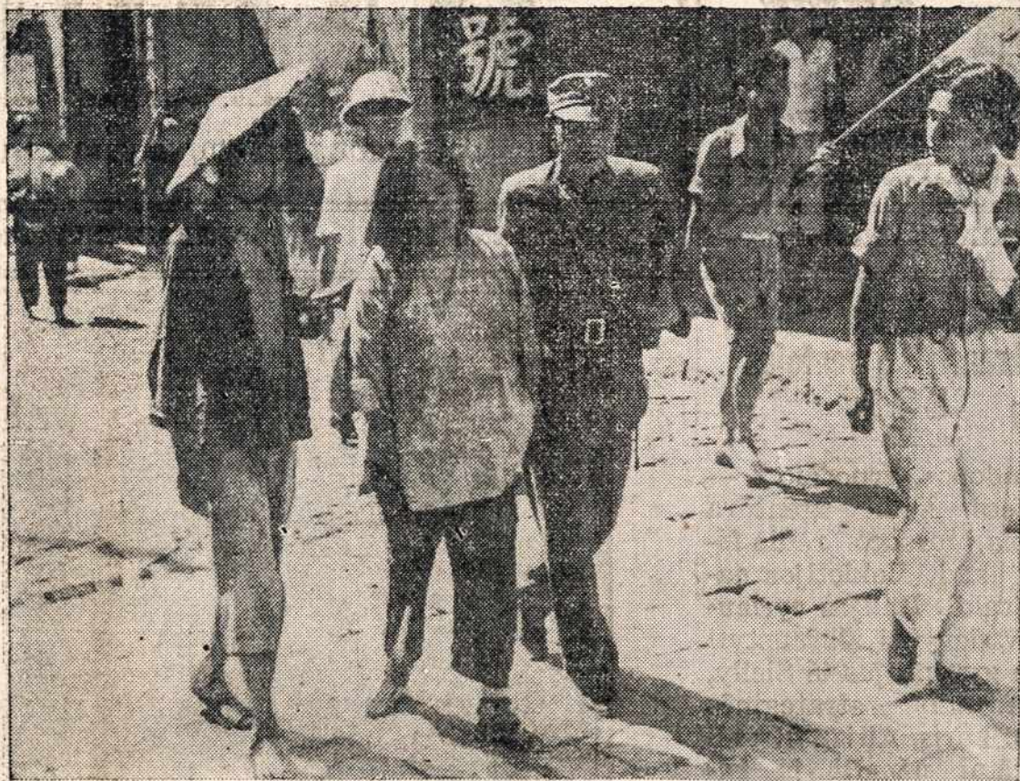
Kinų pulkininkas ir jo adjutantas lydi moterį, kai jos namas buvo japonų subombarduotas Chungking'e. Kinijoje yra didelis susirūpinimas nukentėjusių nuo karo prieglauda ir ryžtingas priešui atsimokėjimas.