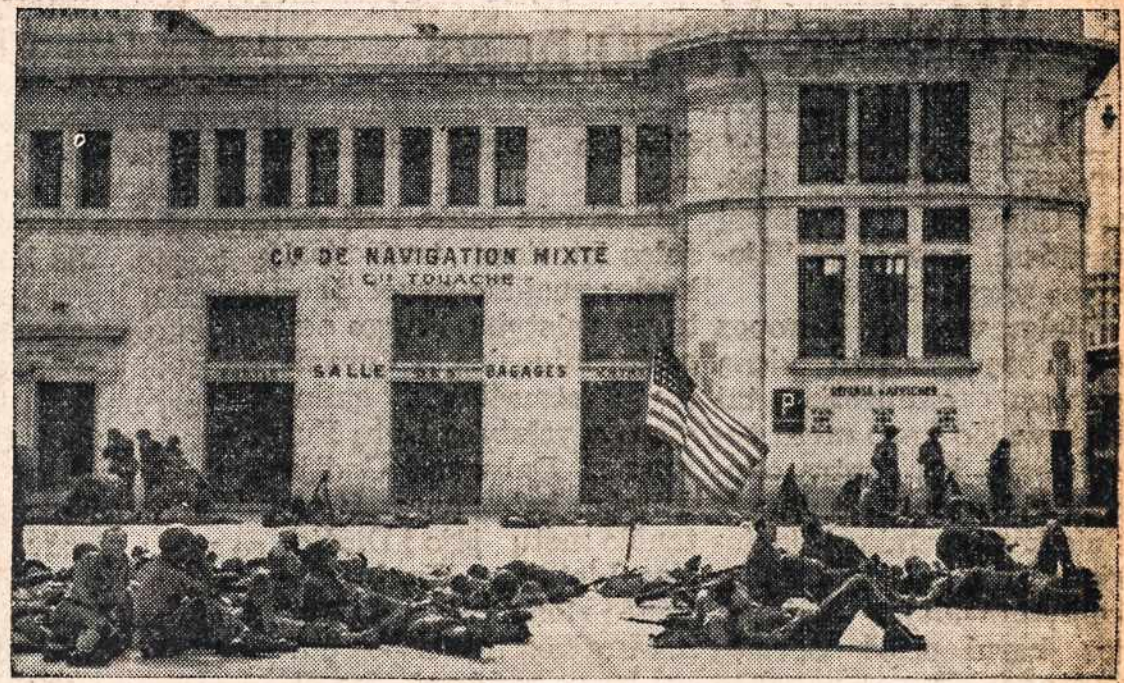
Būrys Dėdės Samo karių, kurie nutilus Algerijos ginklų žvangėjimui, pailsi vanlandėlę, žvaigždėtąsios šešėlyje.