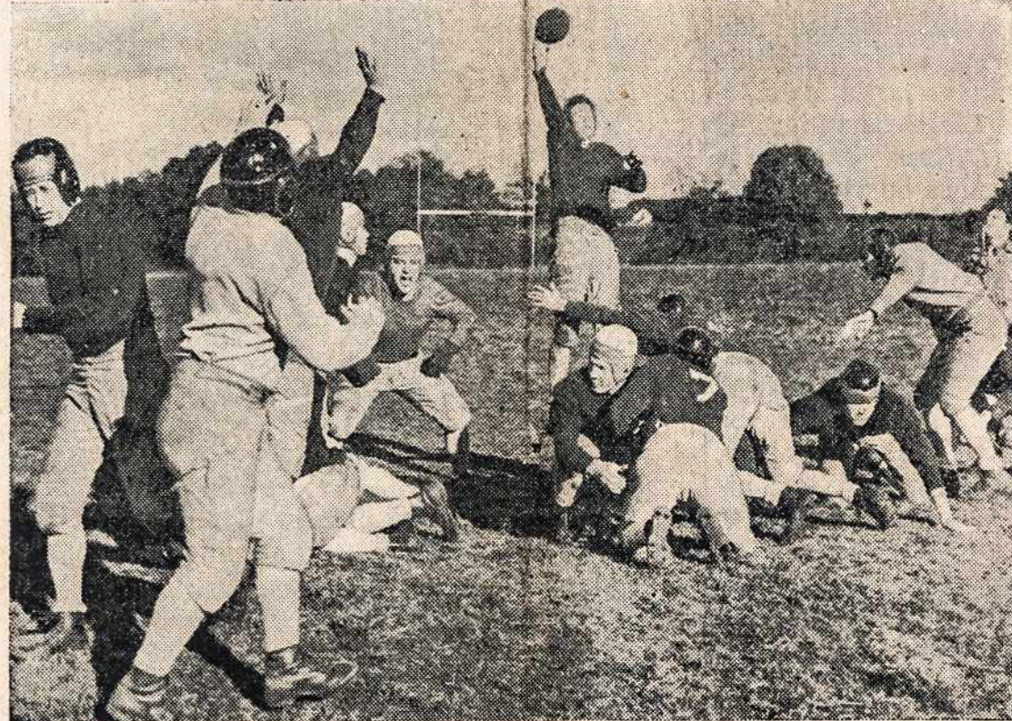
Yankiai-kariai tarpkempiniuose žaidimuose nuolat žaidžia ir kelia karių — žiūrovų ūpą. Tai sportas, kuris užgrūdina ir sunkesniems karo žygiams jaunuolius.

Washington, D. C., gruodžio 7 — Prezidentas Rooseveltas panaikino įvairių mėsos suvažiavimą greičiausiai įvyks New Yorke. Ta proga kaikiurių organizacijų vadovybės, kaip Katalikų Federacija, numato turėti savo specialų posėdį. Katalikų Federacija, be kitų dalykų, šiuo metu yra susirūpinusi, kaip sekmingiau organizuoti ir plėsti katalikiškąją akciją lietuvių parapijose.