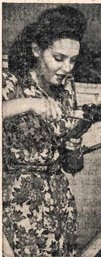
SPEED CONTROL — Screen actress Linda Darnell affixes speed control attachment to accelerator of her car. Device requires extra foot pressure for speeds above limit of 35 miles an hour, preventing "unconscious" speeding.