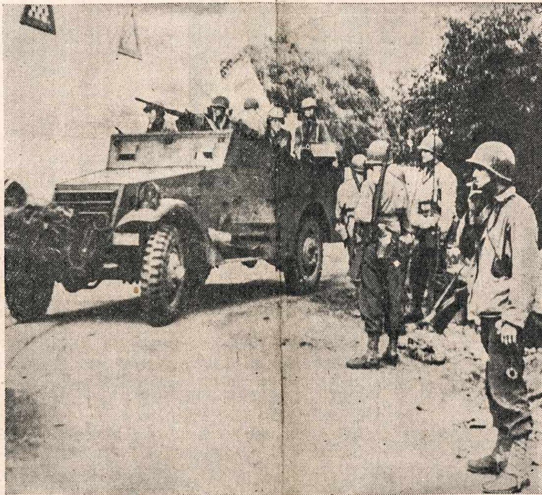
Dėdės Samo kariai, po smarkaus blizkriego, Orane, Morocco, Afrikoj, ginkluoti ir šarvuoti moderniškiausiais karo reikmenimis, jau žygyje prieš Ašies karo jėgas, kurios spėjo susistiprinti Tunisioj.

Buenos Aires, Argentina, gruod. 17 — Katalikų Bažnyčios Vyskupas raštu pasmerkė nacių ir fašistų rėžimą, nes jie "paneigia žmogaus vertybę, atima žmogui visą laisvę ir yra materialistinis racizmas, griežtai priešingas antgamtiniai tvarkai".