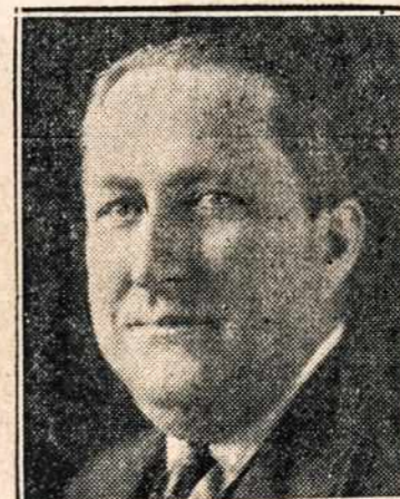
Thomas J. Lane, Kongresmanas