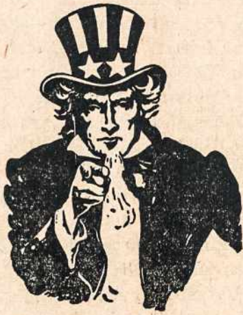
Pirk Karo Bonus šiaudien. Jie tave ryt išlaikys.

— Lietuvos Taryba... skelbia atstatanti nepriklausomą demokratinius pamatais sutvarkytą Lietuvos valstybę su sostine Vilniumi ir tą valstybę atskirianti nuo visų valstybinių ryšių, kurie yra buvę su kitomis tautomis, — šitaip skambėjo svarbiausieji laisvės žodžiai 1918 metais 20 Tarybos narių pasirašytoje deklaracijoje. Tai buvo lietuvių tautos galingos viltys ir nepalaužiami siekimai, bet dar ne pati laisvė, nes Lietuvoje tebesiautė okupantai vokiečiai. Jie net neleido to pareiškimo paskelbti: vokiškos cenzūros įsakymu buvo konfiskuotas ir tas laikraščio numeris, kuriame ši laisvės deklaracija kraštui norėta paskelbti. Berlyno vyriausybė atsakė pripažinti Lietuvos valstybę. Įsisiūbavus revoliucijai Vokietijoje ir pakrikusiu jį kariuomenei ėmus trauktis iš Lietuvos, pradėjo į mūsų tėvų žemes veržtis bolševikai, ber-