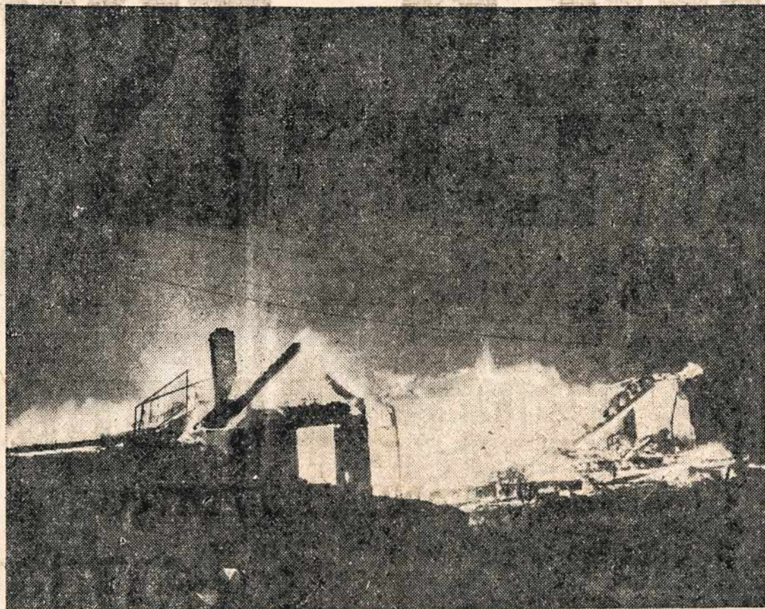
Nukryžiuotojo Jėzaus Vienuolyno Našlaitynas Liepsnose. Šis vaizdas parodo sudegusį našlaityną, Aušros Vartų viloje, Elmhurst, Pa., trečiadienio vakarą, vasario 3 d. š. m. Našlaitynas buvo globoje Nukryžiuotojo Jėzaus vienuolių Seserų. Šakoma, kad gaisras kilęs nuo elektros vielų. Padarė apie $15,000 nuostolių.

Antradienį, vasario 16 dieną, 8:30 val. rytą, Šv. Jurgio parapijoje įvyks iškilmingas klausomybės žvzusis ir už greitą taiką. Koresp. Pirk Defense Bonds ir Stamps!