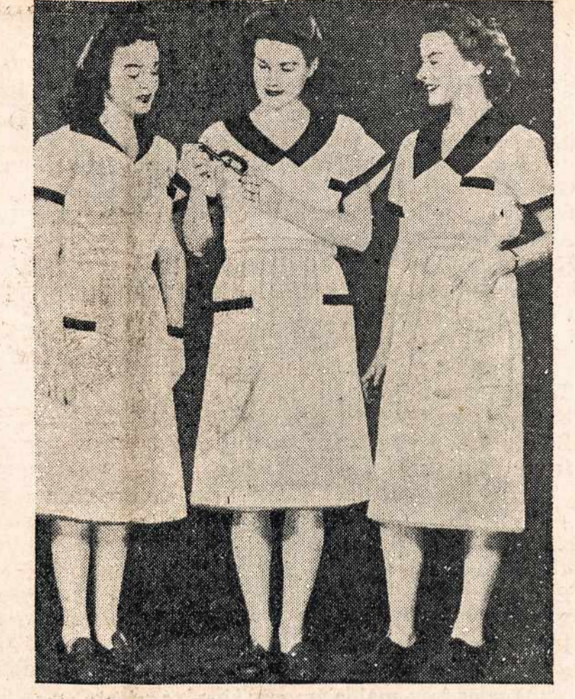
Moterys yra raginamos taupyti drabužių medžiagą ir siūti nešiojimui ne kelnes, bet dreses. Taip šios trys karo darbų darbininkės ir pasiėgė.