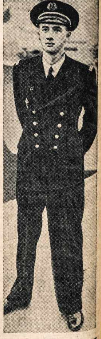
CADET — This young Frenchman is Phillipe de Gaulle, son of the Fighting French General, shown aboard his ship at an unnamed British port. He is an officer-cadet, in training for service with the Fighting French Navy.