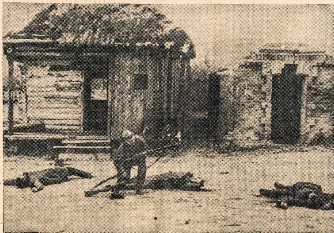
Rusiški guerrilos atsiima iš nacių Orel apylinkėje kaimelį. Ten be aukų nežengiama nei žingsnio. Kaip vaizdas parodo — ten krauju nulieta ir kapais nusagstyta visa Rusija.

Savaime aišku, kad lengvas persikėlimas per Nerį brasta turėjo reikšmę prekybinių santykių užmezgime tarp kairiojo ir dešiniojo Neries kranto gyventojų. Lengvas persikėlimas į kairįjį Neries krantą topologinės vinių plote jungė ekonominiai Vilniaus sodaryta brasta — lengviausias persikėlimas per Nerį. Apie šią brastą ir pradėjo steigti Vilnius.