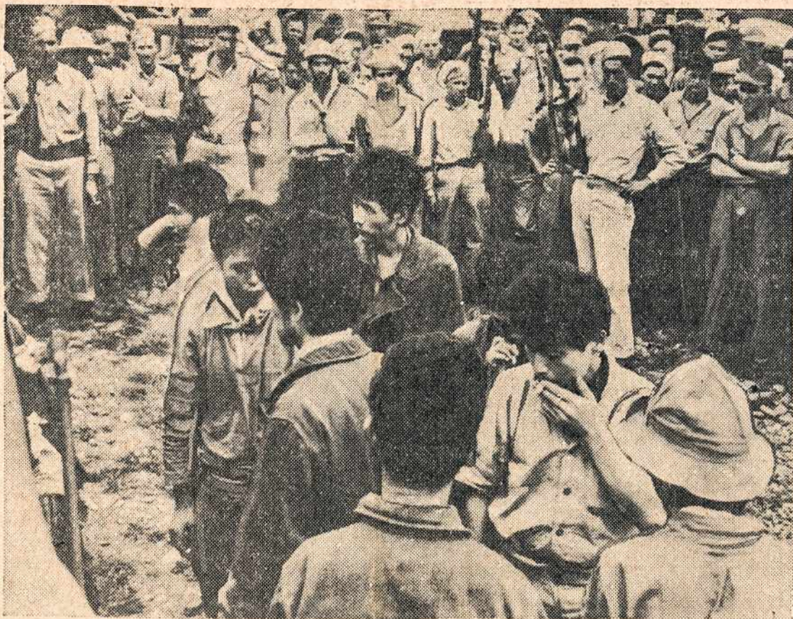
Amerikos kareiviai fundija japonams belaisviams cigarečių, kai buvo japonai sukulti ir paimti į belaisvę Guadalcanal salose.