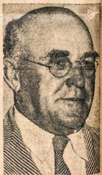
FARM DRAIN—Senator John H. Bankhead, 2nd, of Alabama, whose bill seeks to redesign Selective Service Act and halt conscription of farm workers. Bill also would furlough farm workers already in uniform. He said a "farm famine" would result unless the drain was stopped.