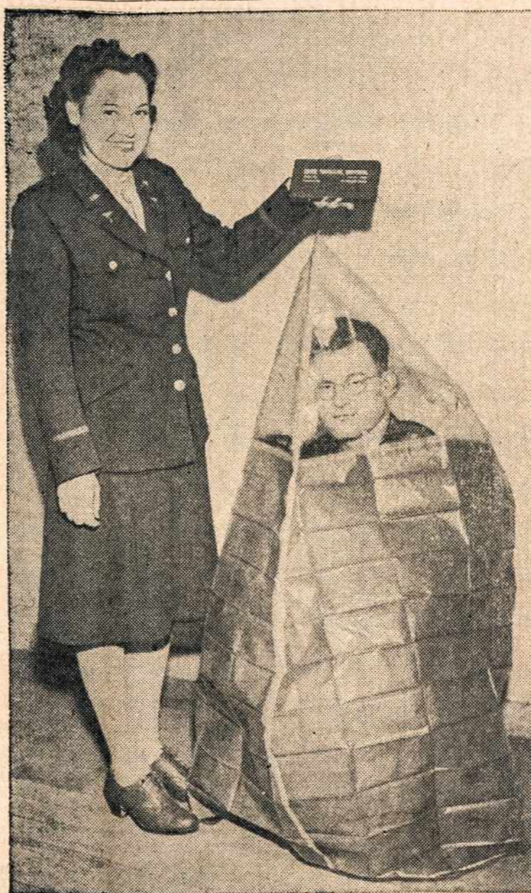
Sakoma, kad surasta tokios rūšies maišai, kurie apsaugo nuo nuodėmingų skysčių. Esą galima greit pasislėpti maiše ir į kelias sekundes vėl išlysti.