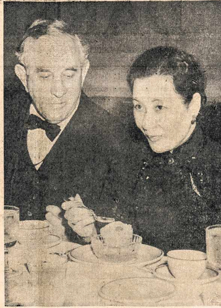
Ponia Chiang Kai-shek pagerbiama Washingtonė, ir giriama už jos pasakytą kalbą Kongrese.

(LKFSB) Lietuvos spauda dabar prispausta kietos nacių cenzūros. Įdomu, kad net taip išcenzuruotos spaudos naciai neleidžia siųsti į užsienį. Mūsų korespondentas praneša iš Portugalijos, kad yra gavęs žinių, jog iš vad. Ostlando lietuviams negalima išsiųsti nei laikraščių, nei laišku. Tačiau mūsų korespondentas džiaugiasi, kad gali gauti Amerikos lietuvių laikraščius; tik jie ateina pundaais. Taip jisai "Draugą" ir "Laivą" paskutiniu metu gavęs sausio pabaigoje, bet tai būvę numeriai nuo rugsėjo pradžios iki spalio 12 dienos. Oro paštu pasiūstas laiškas iš Portugalijos eina apie pusantro mėnesio.