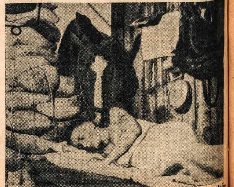
Kario arklys, jo artimas draugas. Štai signalai kėlimosi nušvilpus, arklys budina karį.