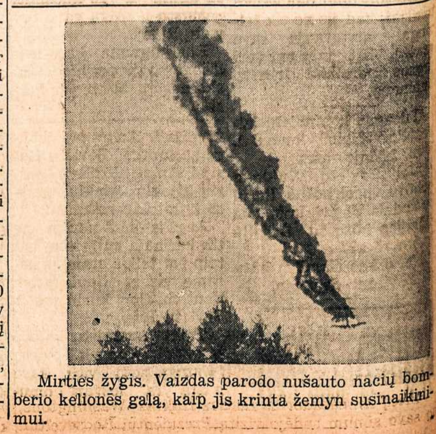
Mirties žygis. Vaizdas parodo nušauto nacių bombardierio kelionės galą, kaip jis krinta žemyn susinaikiniui.

Leidžiama taip pat daug slapty laikraščių. Yra du slaptu spausdintys spausdintu savaitraščiu.