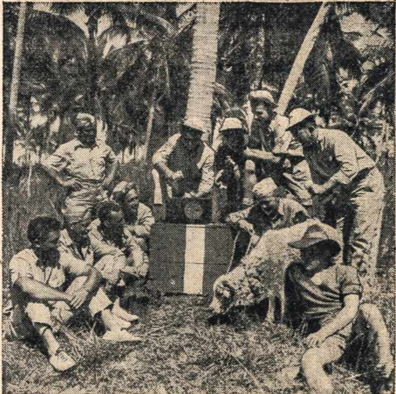
HOME IN THE JUNGLE—U. S. soldiers, somewhere in Australia, take time out from fighting to listen to one of their favorite American radio programs. These shortwave programs are made possible through the efforts of the American Red Cross, the Office of War Information and the Special Services Branch of the Army.