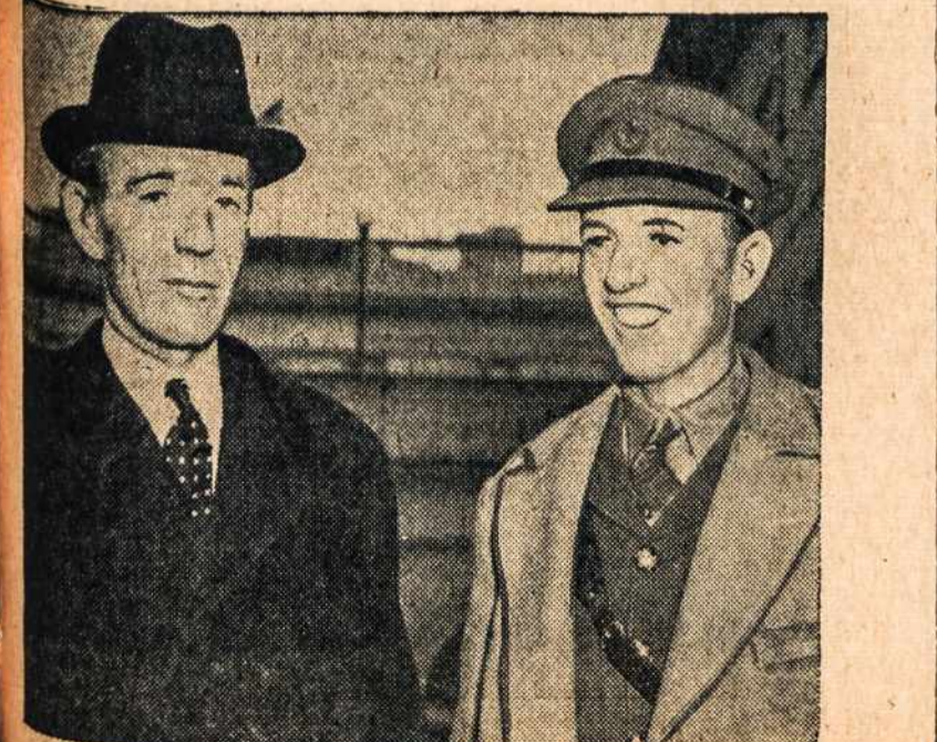
Britų Ambasadorius Lordas Halifax, Washington, su savo sūnum sudėjo vizitą Prezidentui Rooseveltui.

Šiuo momentu — sako toliau "Pilot" — yra būtina, kad mes, "Sujungtosios Tautos", turėtume bendrą savytarpinį pasitikėjimą ir priešui nugalėti, ir nuo baimės būsimųjų karų išsilaisvinti. Bet pasitikėjimas negali būti aklas. Jis turi remtis ant faktų. Žmogus tik tada kits kitu pasitiki, kada žino, kad jo žodžiai bei talkininkas tikrai yra pasitikėjimo vertas; kad jis praeityje savo pasižadėjimus yra išpildęs. Mūsų žmonės nieko daugiau nenori, tik žinoti sovietų planus, kaip jie mano elgtis su religija ateityje. Jie laukia tiesioginio nuosirdaus atsakymo. Dėja, tokio atsakymo nėra. Tarsi tyčiodamiesi iš sveiko amerikiečių proto, sovietai juos vaišina pigiomis, nudėvėtomis melagystėmis.