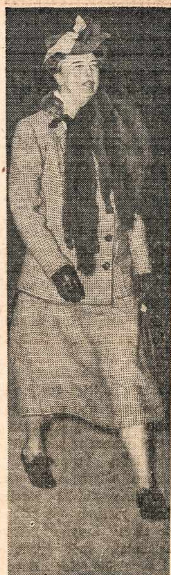
HIKER — Mrs. Eleanor Roosevelt, obeying the law against using cars, hikes back to White House after attending Victory Fashion Review at Department of Agriculture, Washington.

Kad Dievas palaimintų šias misijas, prašome visų tikinčiųjų šia intencija pasimelsti. FRANCISCAN FATHERS 310 Orchard Street Pittsburgh (10), Pa.