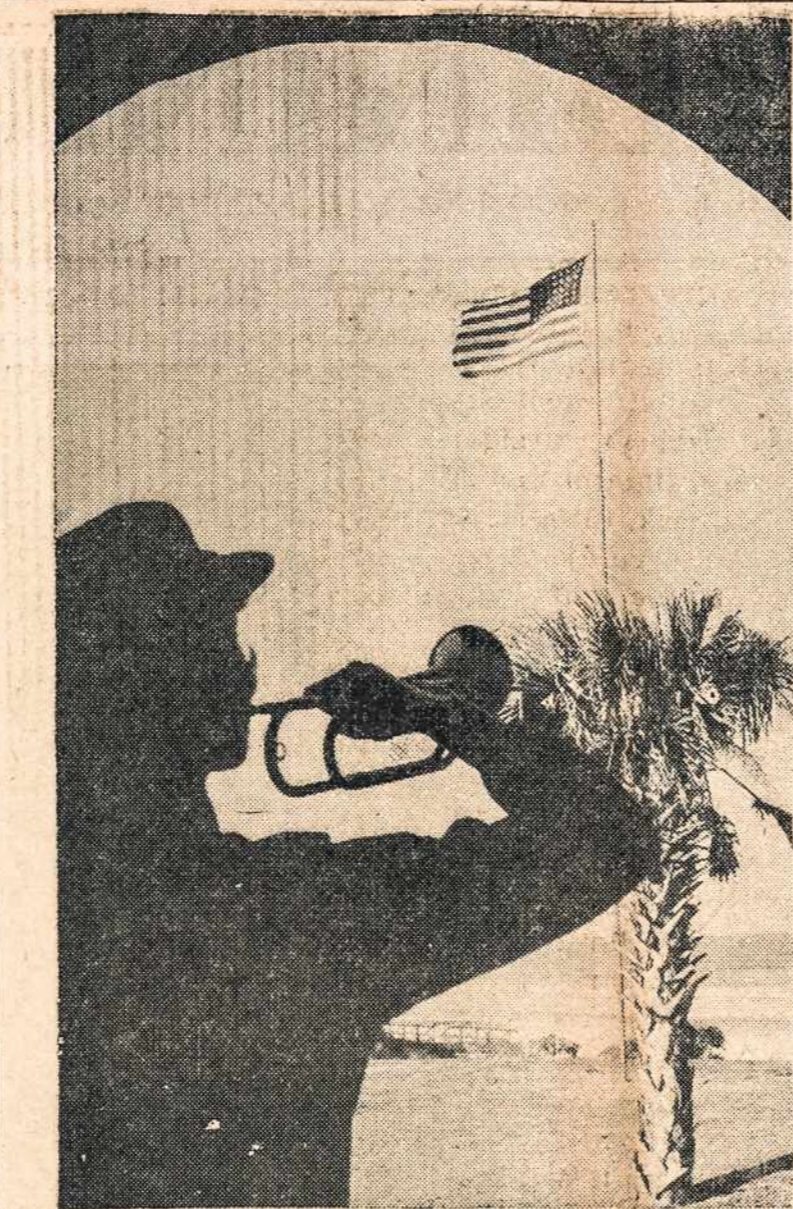
Viena iš WAAC karių, trimito balsu šaukia pareigūnes vakarinėms ceremonijoms. Tai gražaus Floridos saulėleidžio vaizdas, kai padangę puošia žvaigždėtoji šios šalies vėliava.

Subalansuokite šiuos reikalavimus prieš milžinišką produkcijos gamybą Amerikos agrikultūros 1942 m. ir dar didesnius reikalavimus 1943 m. Kada pradėsite suskaičiuoti šias milžiniškas skaitlines, tada pradėsite su-