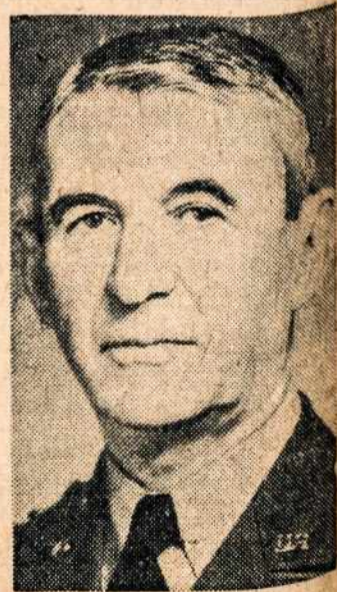
NEW ARMY — Lieutenant General Walter Kreuger, who will command newly formed Sixth Army, to be composed of American combat troops in Southwest Pacific. General has been in command of Third Army, with headquarters in San Antonio, Texas. He leaves for abroad soon.

Raud. Kryžiaus savanoriai pagamino milijonus bandažų šiam karui. Jūsų parama 1943 m. Raud. Kryžiaus Karo Fondui yra reikalinga.