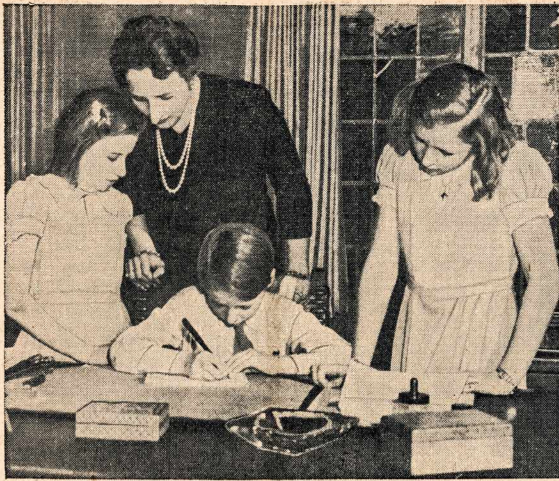
Norvegijos Princas Harold, 6 m. amž., rašo laišką savo diedukui, karaliui Haakon, kuris dabar apsigyvenęs Londone. Jaunasis Princas su savo sesutėmis gyv. Pook's Hill, Md.

Kovo 14 d., 4 val. po piet įvyko Dr. K. Pakšto pagerbtuvių bankietas, Apreiškimo par. sveitainėje. Gražus būrys brooklyniečių susirinko arčiau susipažinti su prof. Dr. Pakštu, kuris čia apsigyveno. Jis yra Lietuvos Kultūros Instituto Direktorium. Geriausio pasisekimo tau, Daktare!