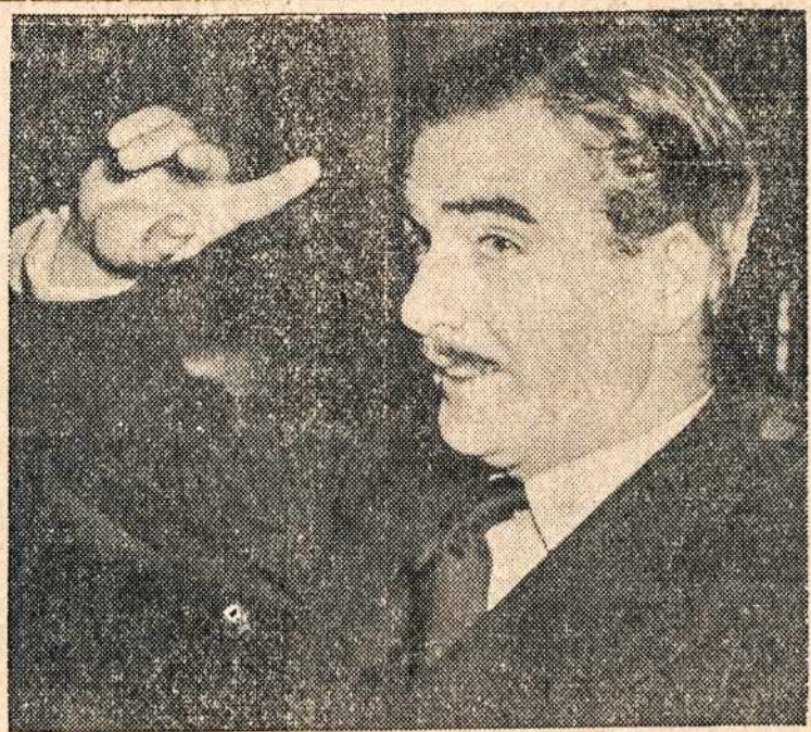
ANTHONY EDEN, Britų Užsienių reikalų valstybės ministeris, kuris šiomis dienomis veda plačius pasitarimus Washingtone, kas link po karinių rubežių Europoje ir kitur.

"Politinės intrygos, kurios plėšė Europą ir Aziją per metus, persodintos į mūsų šalį. Jung. Valstybės tapo centras įvairių rūšių pabėgėlių politikierių, kiekvienas užsiėmęs tikslai įsteigimu savo ypa-