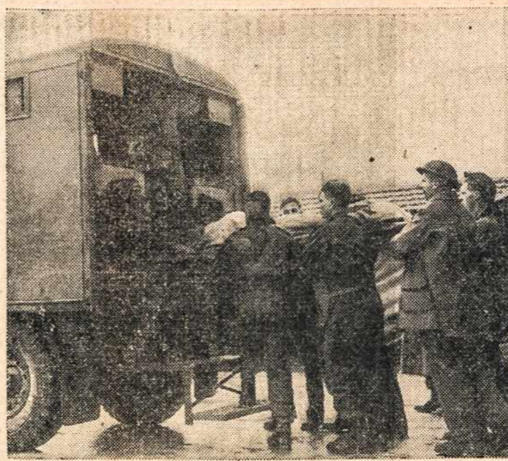
Raudonasis Kryžiaus teikia Pirmąją Pagelbą