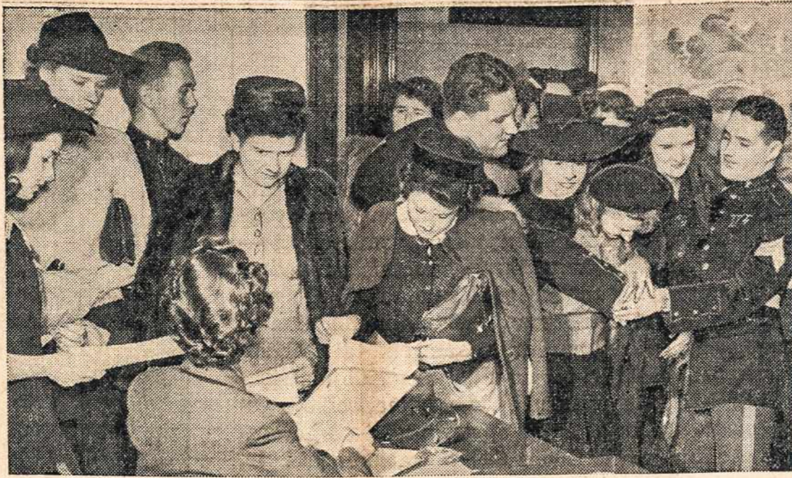
Kai Philadelphiaj buvo atidaryta nauja moterų rekrutavimo į mari-nus stotis, tai jaunos merginos perpildė ofisus ir kariai turėjo tvarkyti eiles. Sakoma, kad tas pasikartojė visoje šalyje rekrutavimo moterų stotyse.

Gegužės 12 dieną, šeštą valandą vakare, Madrido vieno miesto dalyje, buvo Dievo Kūno eisėna. Gatvės, kuriomis ėjo eisėna buvo papuoštos gėlėmis, tautiškomis ir partijos (raudonai - juoda su perrištomis penkiomis jėtimis) vėliavomis, išsirikia- vę kariuomenės daliniai. Laukta procesija išėjo iš šv. Izidoriaus bažnyčios: