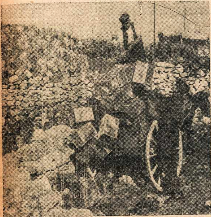
Ir Maltos sala renka blėkines ir taupo karo reika-lams.