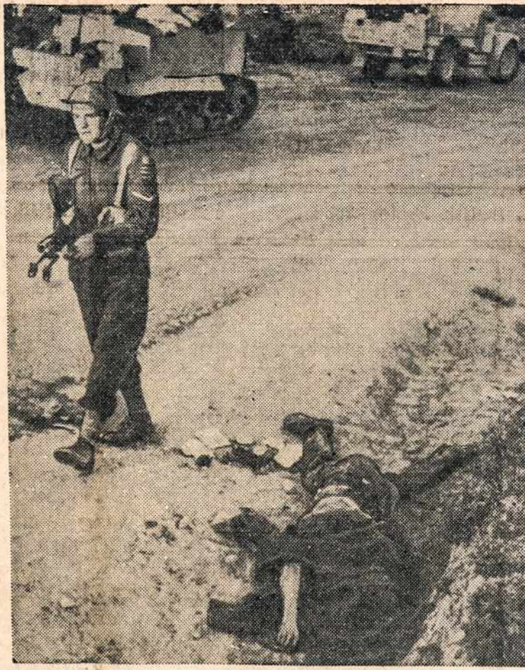
Sakoma, kad tam Mussolinio kariui karas pasibaigė. Netoliese jo žygiuoja britų armija Libijos kraštais, gi tas gulintis karys jau jų nemato.

(Vėliau šia tema duosime daugiau informacijų).