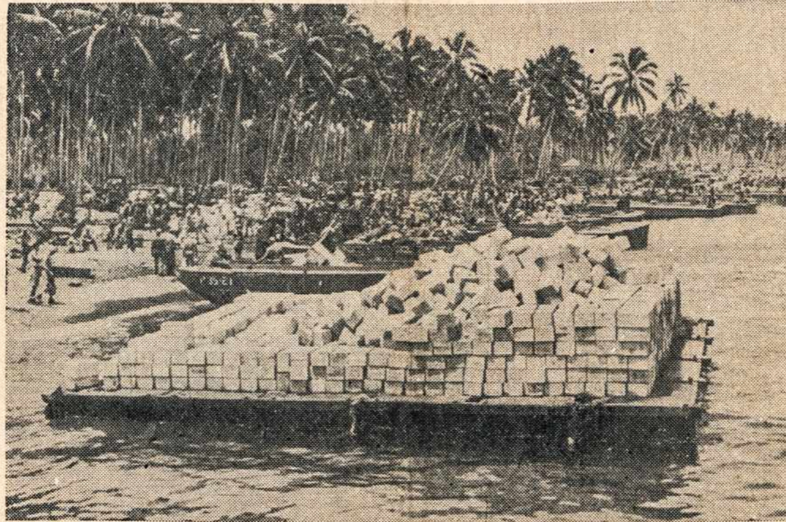
Dėdės Samo kariams Guadalcanal šalose atgabenta dideli kiekiai amunicijos ir kitokių karo reikmenų, kai jie rengėsi ištaškyti japonus.

Pažymėtina, kad Kongreso švietimo komisija, kuri išklaušė už ir prieš tą bilių kalbų, atmetė tą bilių. Dabar tas bilius perduotas šios valstybės Senatui. Jeigu Senatas priims ir Gubernatorius pasirašys, tai bilius liks įstatymu. Mes lietuviai turėtume pasidaryti, kad Senatui žinotų lietuvių nusiteikimą, ir kad jie žinoda-