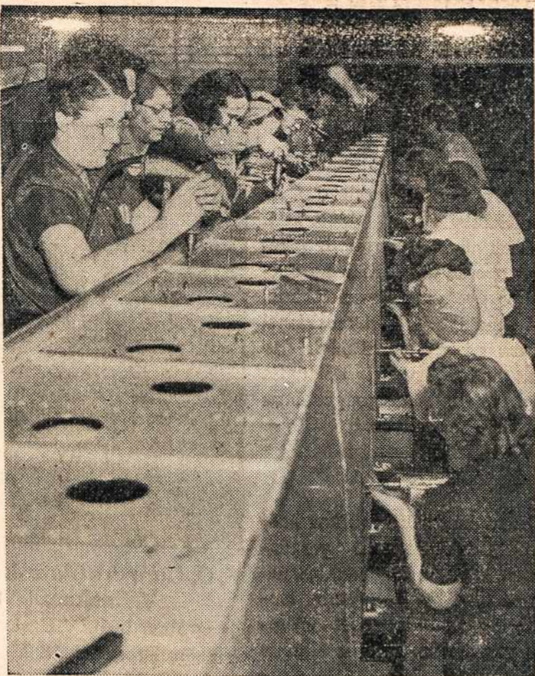
Motery darbo rankos karo darbuose yra lygiai reikalingos, kaip ir vyrų. Štai būrys moterų lavinasi karo darbams. Stok ir tamsta į talką!