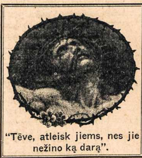
"Tėve, atleisk jiems, nes jie nežino ką darą".

Kiekvieno įžymaus žmogaus mirties valandoje tarti paskutiniai žo-džiai yra reikšmingiausi. Jėzus buvo žmogus ir Dievas. Todėl Jo žodžiai daug reikšmingesni. Juose tartum talpinasi visas Jo mokslas. Ką Jis žo-džiais mokino, tą mirdamas - kentėdamas patvirtino.