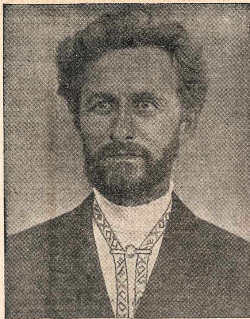
Mažosios Lietuvos Žadintojas-Rašytojas p. Vydūnas

Kai 1940 metų vasarą ištrūkęs iš nacių koncentracijos lagerio ir rengiausi keliauti į Naująjį Pasaulį,