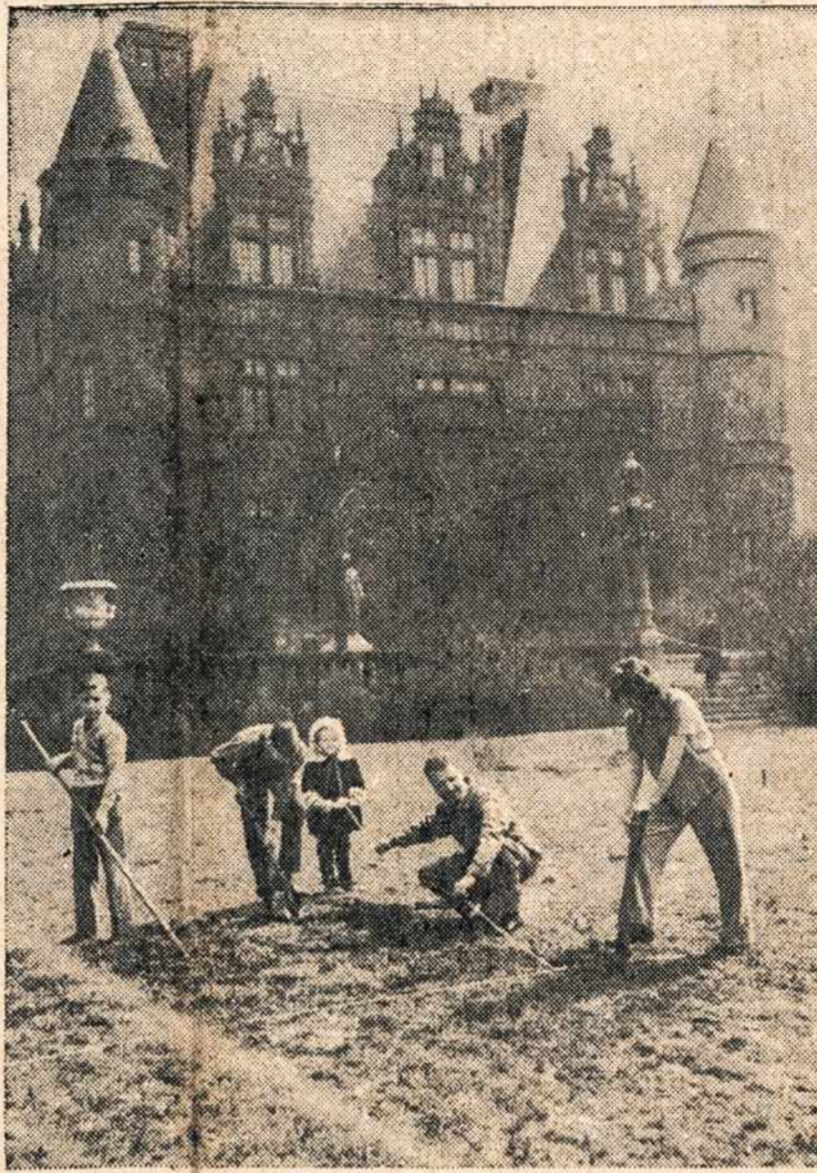
Kasama žemė dėl Pergalės Darželių. Tai tūlo milijonieriaus New Yorko mieste gražus daržas paverčiamas Pergalės lauku.