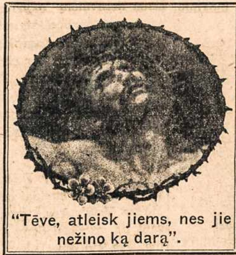
"Tėve, atleisk jiems, nes jie nežino ką darą".