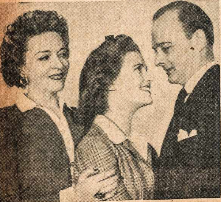
Artistai naujo veikalo — "Kiss and Tell".