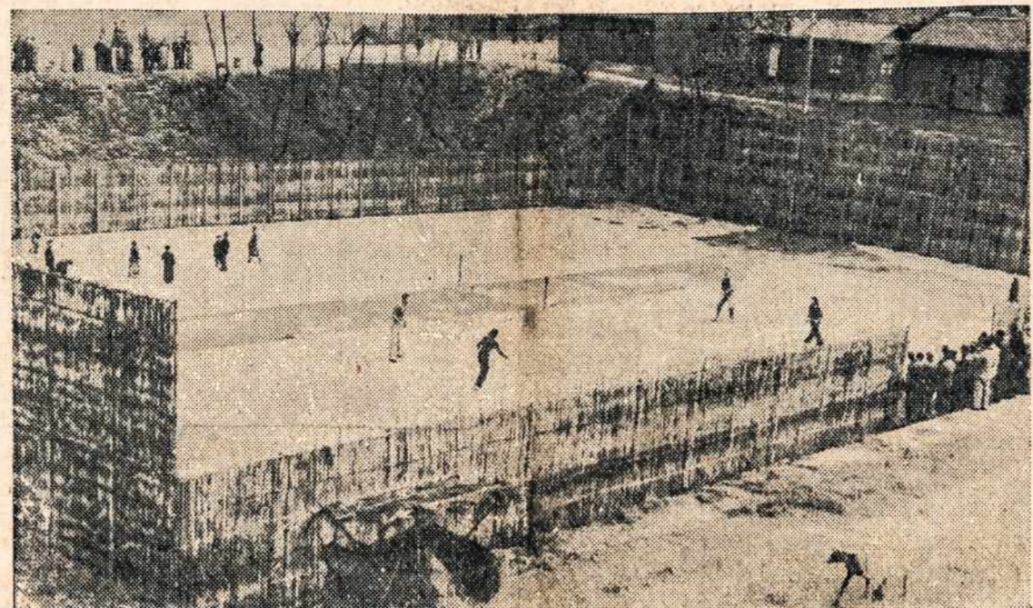
Amerikos kariai, kurie randasi Kijijoje, Chungking, savo liuoslaikiu žaidžia tenis su kinietėmis merginomis. Žaidimo laukas aptvertas aukšta tvora, kad bolės neiškristų laukan.