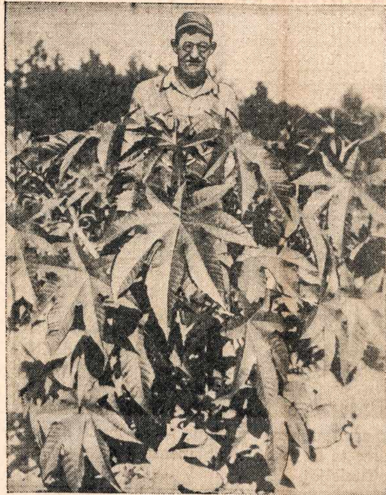
Texas valstybėje užtikta šios rūšies augalų, kurie turi savyje aliejaus. Todėl National Farm Chemurgic Council ir ragina tuos ūkininkus auginti daugiau tos rūšies augalų.