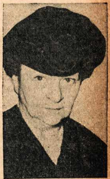
AGIN IT—Latest picture of Labor Secretary Frances Perkins, taken as she told House Naval Affairs Committee in Washington that American Industry and Labor could control absenteeism. She opposed legislation to solve problem.

FRANCISCAN FATHERS 310 Orchard Street Pittsburgh (10), Pa.