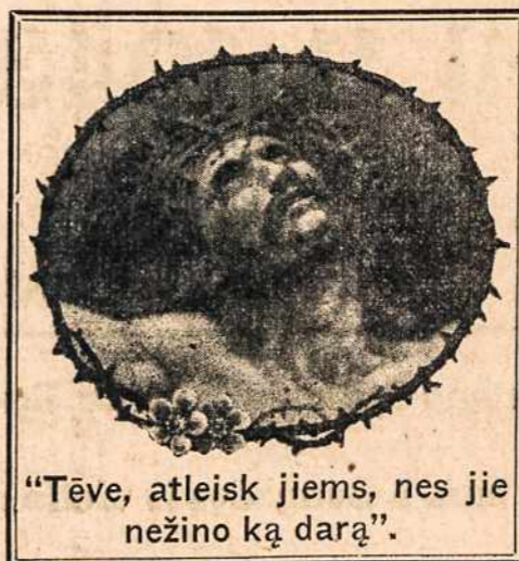
"Tėve, atleisk jiems, nes jie nežino ką darą".

310 Orchard Street Pittsburgh, Penna. Telephone — Hemlock 6567