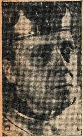
RICHARD—George Coulouris, British actor who has won approval in recent New York shows, as he appears in leading role of Shakespeare's "Richard III," now on Broadway.

"CROSSING THE STREAM The maintenance of public health on the home front is one of the most vital necessities of the war. During the last World war the influenza plague, which swept the nation and this State, claimed more lives among the