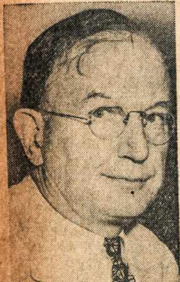
NO DADS—Bill to exempt all fathers married prior to Pearl Harbor has been introduced in Senate by Senator Burton K. Wheeler of Montana, above. Senator asserts that single men of 38 to 45 should be inducted before "breaking up homes of America."