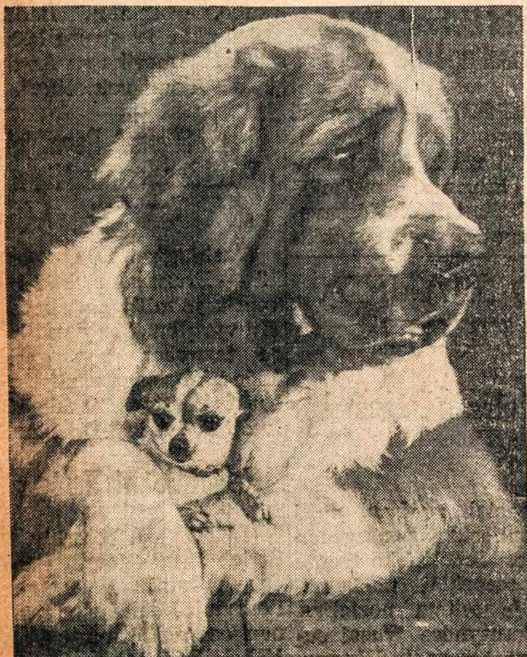
Šie du — senis ir jaunas šuo, laimėjo dovaną Los Angeles parodoje. Senis sverias 180 svarų, kaip tuo tarpu jaunas sverias tik 1½ sv.

Šį veikalą visose kolonijose vaidins Brocktono Liet. Dramos Ratelis, vadovybėje kun. F. Norbuto.