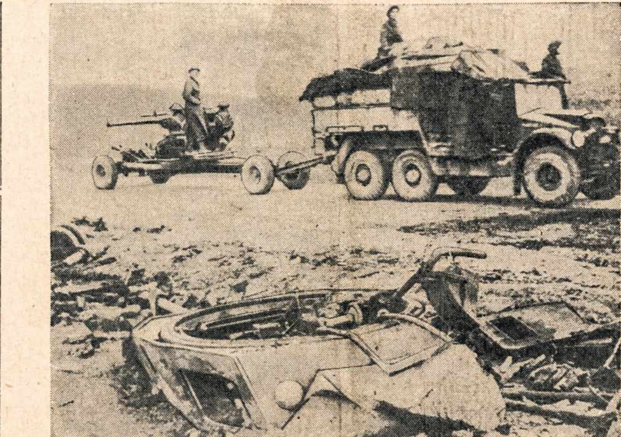
Britų Armijos artilerijos daliniai vyksta į Thala, Tunisioj, kur vyko smarkūs mūšiai. Pakelėse matosi ištaškytų nacių karinių pabūklų dalys.

(LKFSB) Iš Londono mūsų korespondentas praneša, kad tenai galima girdėti Lietuvos radio stotys. Tačiau iš Lietuvos vokiečių radia nepaduoda vietinių žinių. Tai tik vokiečių propaganda lietuviškais žodžiais. Kalba tris kartus dienoje po 5, 10 minučių, retai — 15. Dėl vaiztumo, paduodame, kas buvo girdėti vienos dienos radio programoje (III. 22): gyre okupantus, atšventusius vakar karžygių iškilmes. Vokiečius sveikinę italų spauda ir Milano dienraštis sakas, jog ne tiek rašalu, kiek krauju susijungę tos dvi tautos už savo geresnę ateitį kariauti. Žinoma, prie to pridėjo daug pagyrų žodelių ir užsipolė angius "viso kaltininkus", kaip jie sako. Antrame žinių straipsnelyje kalbėjo prieš D. Britaniją, norėdami sėti nesutarimus tarp jos ir Lenkijos. Esą, britai nei pirštu nepajudinsia, kad pasipriešintų Rusijos komunistų įtakai Rytų Europoje. Aišku, pranešėjas visai nežinojo, ką buvo iškalbėjęs D. Britanijos min. Pirmininkas, nes juk Lietuvoje uždrausta klausytis Londono radio... Taigi Lietuvos radią naciai yra paglemžę savo propagandos tarnybon.