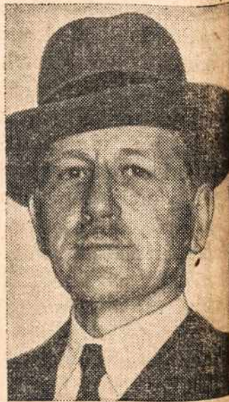
ROVER—Brigadier General Patrick J. Hurley, who resigned as Minister to New Zealand, to accept post as a "roving Ambassador" for President Roosevelt in Middle East.

Jums nereikia porcijos korčiukės pirkimui J. V. Karo Bonų.