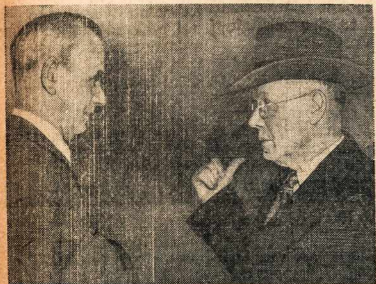
William Green, dešinėj, AFL prezidentas, rodo savo bendro darbo CIO prezidentui Phillip Murray, po apklausinėjimų Washington, kad į čia išeitis.

— "Visuomet, kuomet tik jausi didelius kūno ar sielos kentėjimus, — visuomet kalbėk šią trumpą maldelę, — ir ūmai visuomet pajusi savo sieloje didelį palengvinimą! Visi tie, kurie būna pas ligonius, juos slaugo ir globoja, — taipogi visuomet tegul su juo ir už jį (supr. su ligoniu ir už ligonį!), šią trumputėlę maldelę kalba. Ta maldelė labai palengvins kiekvienam ligoniui, visus kenčiamus kūno ir sielos skausmus".