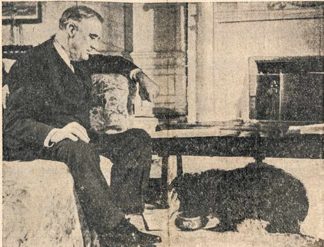
Prezidentas Rooseveltas, kai atsi palaiduoja nuo sunkaus darbo trumpai valandėlei, tai jis maloniai imasi darbo — duoti maisto savo namų šuniukui ir stebėti, kaip jis liežuviu taškindamas ant brangaus kilimo skubiai sotinasi.