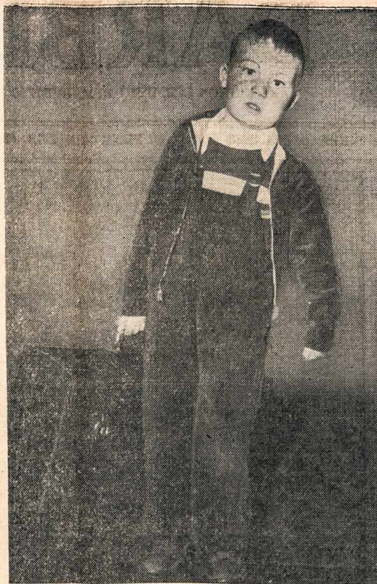
Šis "milžinas" vyras sako, kad jo "suitcase" nėra sunkus, kai jis išlipo iš Pan American Clipper'io. O jis tik 5 metų amžiaus.

★ Vienybėje — galybė. Priežodis sako: "Kur du, trys... stos, visados daugiau padarys..." Štai esame išvakarėse Afrikos pergalės. Ašies armija skaičiuoja savo paskutines dienas ir turės pergyventi istorinį Dunkirką. Jeigu pažvelgsime nuo Pearl Harbor istorinės valandos, kai klatingai priešas kirtu iš pasaly šios šalies gyveninį plauką, ir šiandieninį pirmutinį triumfą, tai mes pilnai turime įvertinti šūkį — Vienybėje — galybė. Štai po Dunkirko, kurį pergyveno Britai, kai puolė Olandija, Belgija ir Prancūzija, tuomet buvo nepaprastas pavojus iš Ašies pusės. Kaip Britai buvo pranešę, kad jie tuomet teturėjo fronte tik šimtą tankų. Bet čia pat Dėdė Samas metė savo produkcijos išteklius ir Britai diena iš dienos, jau po poros beviltes mėnesių Churchill pranešė, kad pavojus Anglijai praėjo. Prispirtiemis prie Maskvos, Leningrado ir Stalingrado sienos rusams atėjo "Lend-lease" pagelba ir tūkstančiai tankų, orlaivių, amunicijos vienetų bei tonai valgytų atplaukė iš Dėdės Samo šalies ir palengvino rusų padėtį... Gi atvirksčiai — britų ir rusų kovos leido suorganizuoti Dėdei Samui milijoninę armiją. Ir štai šiandien visų Suvienytų Tautų akys nušvito, o Ašies vadai priversti daryti meditaciją ir muštis į krutinę dėl jų padarytų klaidų. Ir reikia manyti, kad rietik Afrikos pergalė vainikuos laurais Suvienytų Tautų vadus, bet, kad ir su didelėmis aukomis, bus pasiektas ir Europos žemynas, kur pavergtos tautos laukia išlaisvinimo.