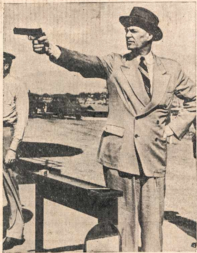
Laivyno sekretoriaus asistentas Ralph A. Bard, vykdamas inspekcijai į Pearl Harbor, įdėjo daug praktikos revolverio šaudyme.

Šalimoje girioje būta privisę daug laukinių ir plėšrių žvėrių. Dėl to, gyven-tojai šalinosi nuo tos girios ir nuo to kalno. Praėjus 500 metų po Kristaus gimimo, o nuo Šv. Tomo 450 metams, pasitaikė, kad medžiotojų kuopa užėję į tą kalną. O kadangi artėjo vakaras, jie nutarė praleisti naktį tame kalne, kad apsinakvoti. Todėl, jie pradėjo tvarkyti granito paviršių, į šalį numesdami sudžiūvusią žolę ir lapus. Vienu kartu jie nustebė, matydami lyg aukštas nušviečiantis granito dalį. Vienas iš jų ryžosi