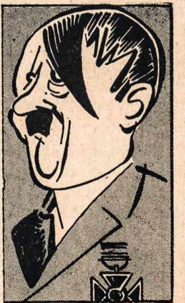
Siūlo lietuviams "kultūrą", Lietuvos Quislingams — medalius!