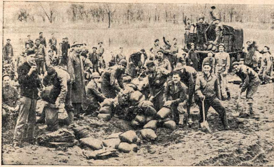
Kai patvinus Missouri upė sudarė rimtą pavojų Omaha, Neb., tai buvo iššaukti kariai pagelbon. Vaizdas parodo, kai kariai pripildo maišukus smėliu, kad nuvežus į reikiamą vietą, kad užtvėrti vandens srovę.