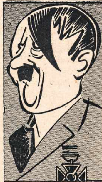
Siūlo lietuviams "kultūrą", Lietuvos Quislingams — medalius!