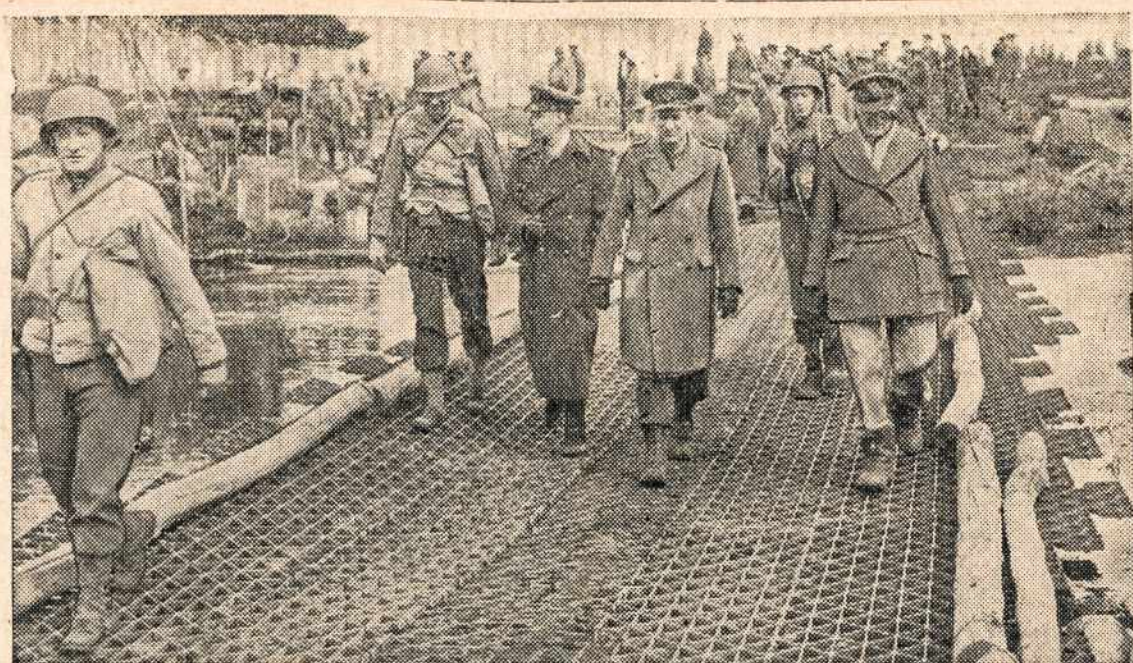
Naujos rūšies kilnojantieji tiltai. Tai geležies tinklas, kuris paprastai pratesiamas minkštų laukų lygumoje, kur norima įtaisyti orlaiviams nusileidimo stotis. Šiuo tarpu parodoma, kad tas pats geležinis-plieninis tinklas tinkas ir pantoniniams tiltams pratiesti. Paveikslas rodo, kaip amerikiečiai parodo britams šios rūšies išradimą.

Tą sopamąją spragą užpildė "Darbininkas". Nežiūrint smarkaus bedievių pasipriešinimo, jis drąsiai stėjo į kovą ir netrukus įsigijo stiprią poziciją tarp skaitančios katalikų visuomenės. Dirva katalikybei buvo atkovota. Lietuviai pasijuto kur kas normalesniose sąlygose. Ir tas buvo pilnai natūralu, nes skaitančioji visuomenė daugumoje iš katalikų ir susidaro. Dabar "Darbininkas" užima jam priklausomą vietą.