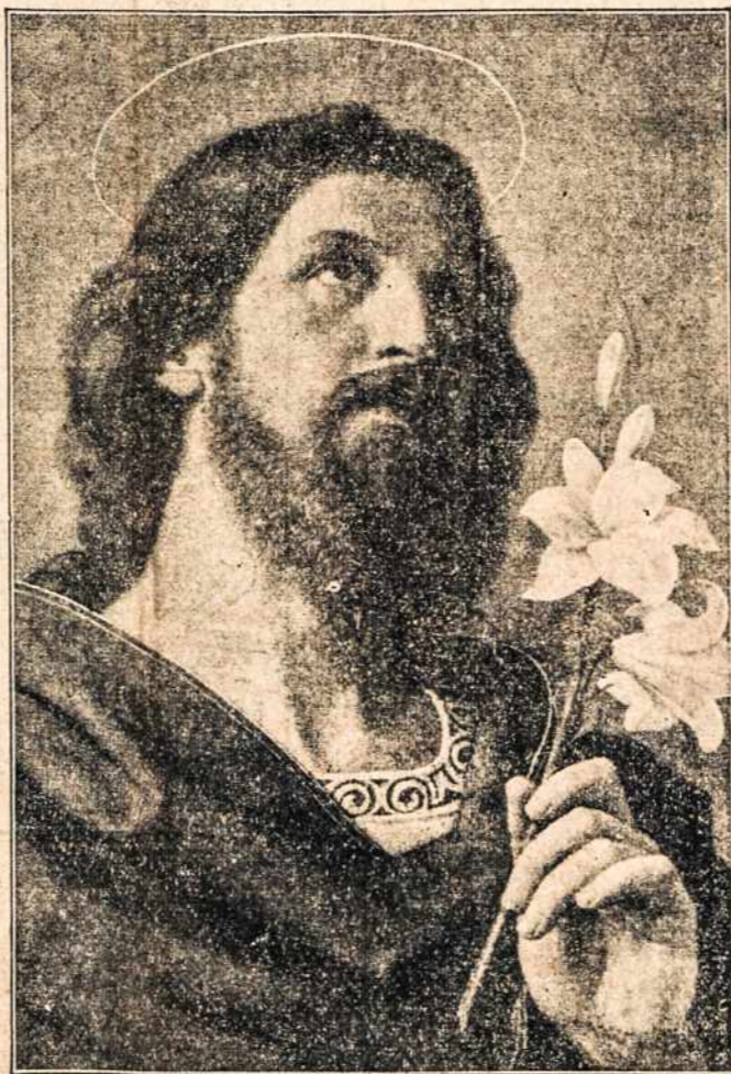
Šv. Juozapas — LDS Organizacijos Globėjas — Darbininkų Užtarėjas.

LDS N. Anglijos Apskritis, vietinė LDS 1-ma kp., ir laikraštis "Darbininkas".