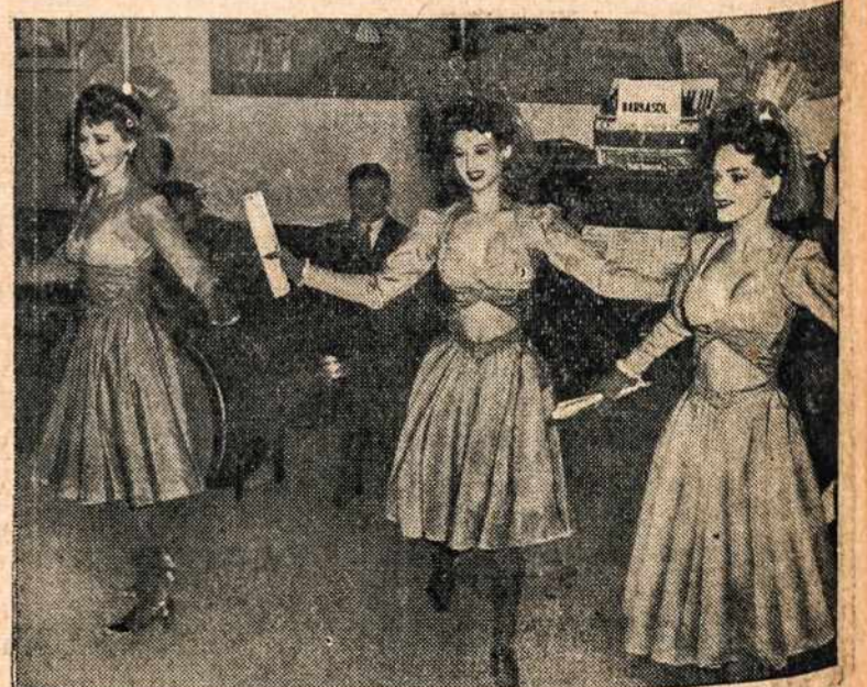
The Netherlands Seamen's Institute in N. Y. was the scene of a gala Barbasol party for those intrepid Dutch merchant sailors here, until their boats set sail again. New York's comeliest night club cuties welcomed "our allies" with a typical hotcha dance routine.