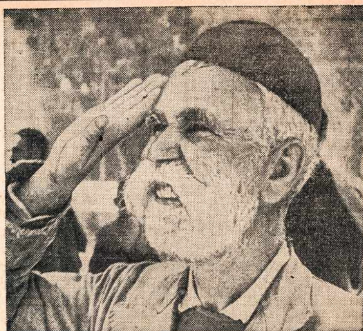
Senas, senas Prancūzijos kolonistas Tunisioj, atiduoda pagarbą, kai britų armija įžengė į El-Hamma, Tunisioj. Jis buvo linksmas sutikti savuosius.