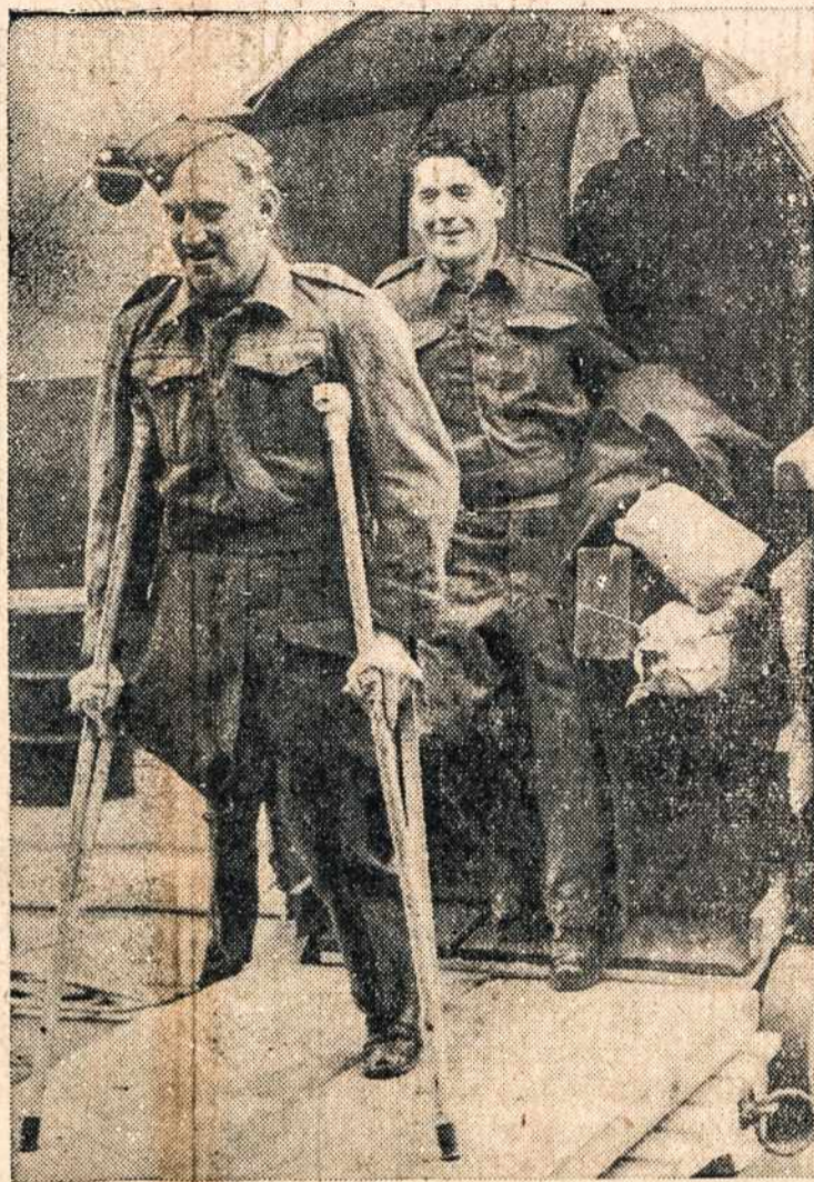
Linksmas britų karys, kad ir sužeistas, sugrįžęs iš italų belaisvės, žengia ant savo tėviškės laisvos žemės.

Dar nesutverta tokių slankscių, kurie pasakytų prasiveržiančiam talentui: ligi čia ir ne toliau. Bethovenas.