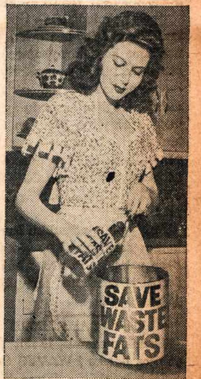
Ann Miller, Columbia motion picture star, transfers inedible grease from small can kept in her kitchen when Boy and Girl Scouts call on regular collection trip. In 21 days after delivery to your meat dealer waste fat will be glycerine urgently needed for gunpowder and medicinals. Buves.