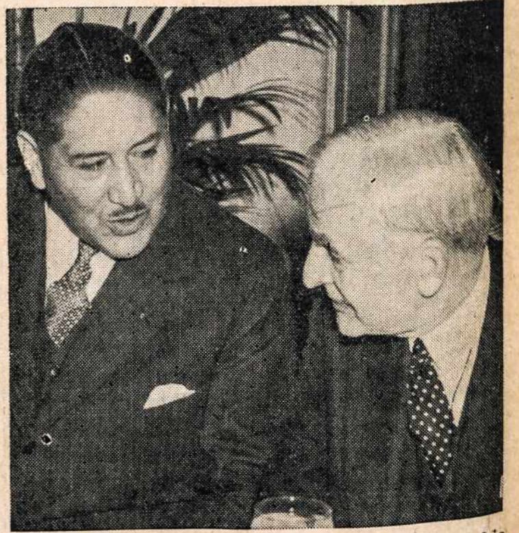
Bolivijos prezidentas Washington, kurį pagerbia užkandžių bankietu. Šale jo matosi Valstybės Sekretorius Cordell Hull.