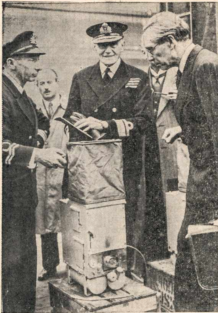
Kad išgelbėjus daugiau gyvybių, Admirolas Sir Martin Dunbar-Naismith, V. C., (vidury), stebi Londono daromo tyrimo, kaip siūlomo prietaiso, kuris būtų taikomas dėl "lifeboats", kad reikale būtų galima distiliuoti-perkošti vandenyno vandenį. Išvalytas vanduo būtų tinkamas gėrimui.

Brolių kancijos Lietuvoj, Sibire, dvasios milžinų — knygnešiu bei laisvės kovotojų pralietas kraujas teparabyla į mūsų sąžines! Pabuskim ir tėvynės blestančią meilę atgaivinę savo širdyse perduokim ją