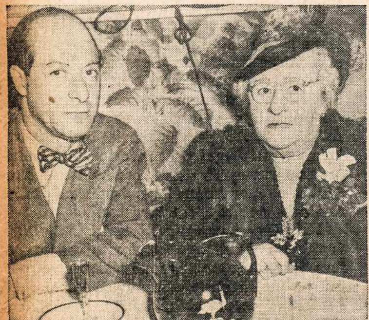
Filmų pasaulio artistas G. Jessel, visuomet į pietus kviečiasi savo motiną.