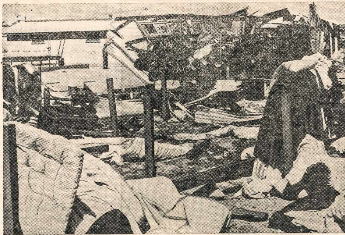
Paveikslas parodo, kaip Marinių korpuse Armijos tipo mėginamasis orlaivis krisdamas sudūžo ir išgriovė gyvenamus butus. Ši nelaimė įvyko San Diego, Cal., kur žuvo trys marinai.

Tokia konferencija galėtų įvykdyti susirinkimą, kuriame War Housing Center vedėjas ir kiti kvalifikuoti kalbėtojai dalyvautų ir paaiškintų namų