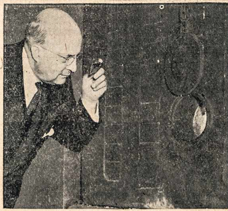
Henry Kaiser, žiūri per akių apsaugojamą stiklą i pečių, kur kaitinama geležis ir plienas. Jis interesuotas tuo pirmutiniu ugnies įkūrimu, naujame pečiuje, kuris kainavo $100,000,000. Jis yra stebuklingas laivų greito statymo kombinatorius. Jo išdirbystė yra Fontana, Cal.