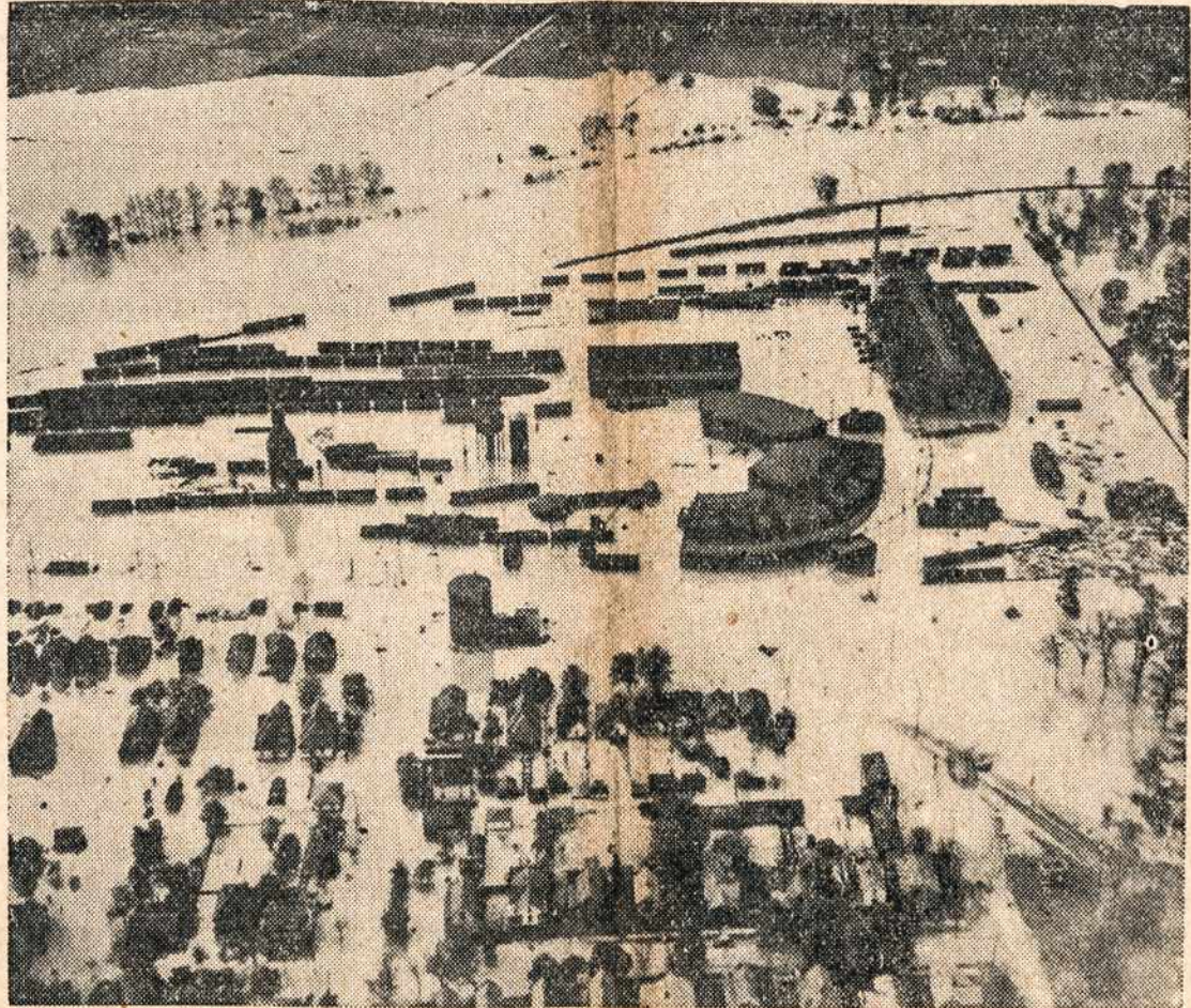
POTVYNIO VAIZDAS. — Kai vanduo pakilo šešiose vidur-vakarų valstybėse tai užliejo daug derlingos žemės ir kaimų bei miestelių. Šis vaizdas parodo Wabash upės išsiliejimą ir vaizdą užlietos Peru, Ind., geležinkelio stoties. Padaryta $30,000,000 nuostolių ir iškelta apie 90,000 iš gyvenamų vietų. Desetkas priskaitoma mirusių.

Londonas, birž. 10 — Berlyno radio praneša, kad Turkijos prezidentas Ismet Inonu pareiškė, jog jo kraštas pasilieka neutralus ir taikoje, bet yra pasiryžęs visa jėga gintis nuo užpuolikų.