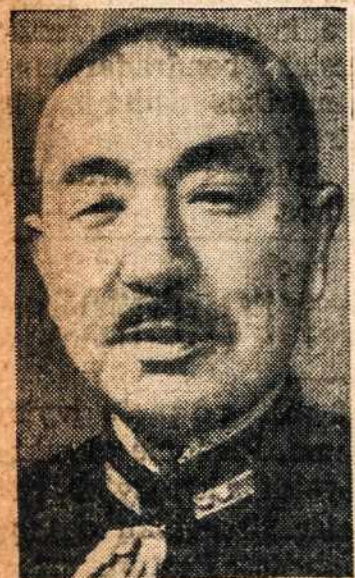
JAP CHIEF — Admiral Mineichi Koga, who succeeds late Admiral Yamamoto as commander of combined Japanese fleet. Koga has been head of the Yokohama Naval Base for building and repair of warships.

Maskva, birž. 10 — Sovietų Rusijos vyriausybė praneša, kad Vokietijos naciai per dvi naktis bombardavo Gorki industrijos centrą. Gorki yra karo ginklų fabriku miestas.