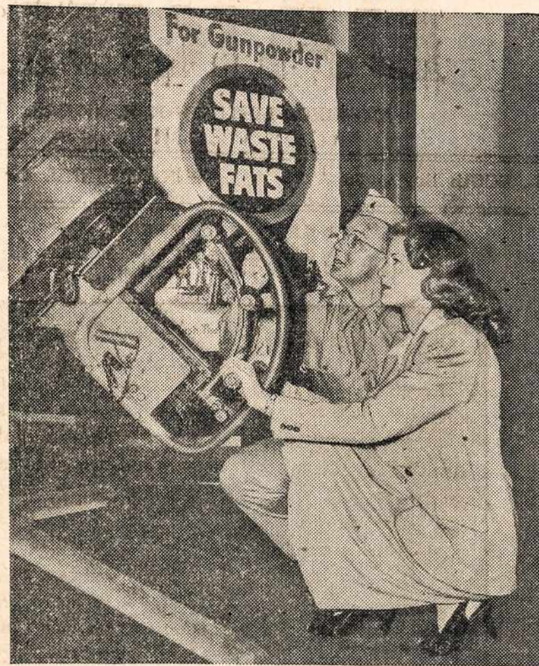
NEW YORK, N. Y.—K. T. Stevens, Columbia screen star, learns how to handle a 50 caliber anti-aircraft machine gun from Lt. Maurice M. Strawbridge at the Army Ordnance Display in the Chrysler Bldg., New York. Save all waste fat and turn it in to your meat dealer. In 21 days it will be converted into urgently needed glycerine for munitions. One pound of inedible fat will produce the glycerine required to manufacture 1.5 pounds of gun powder.