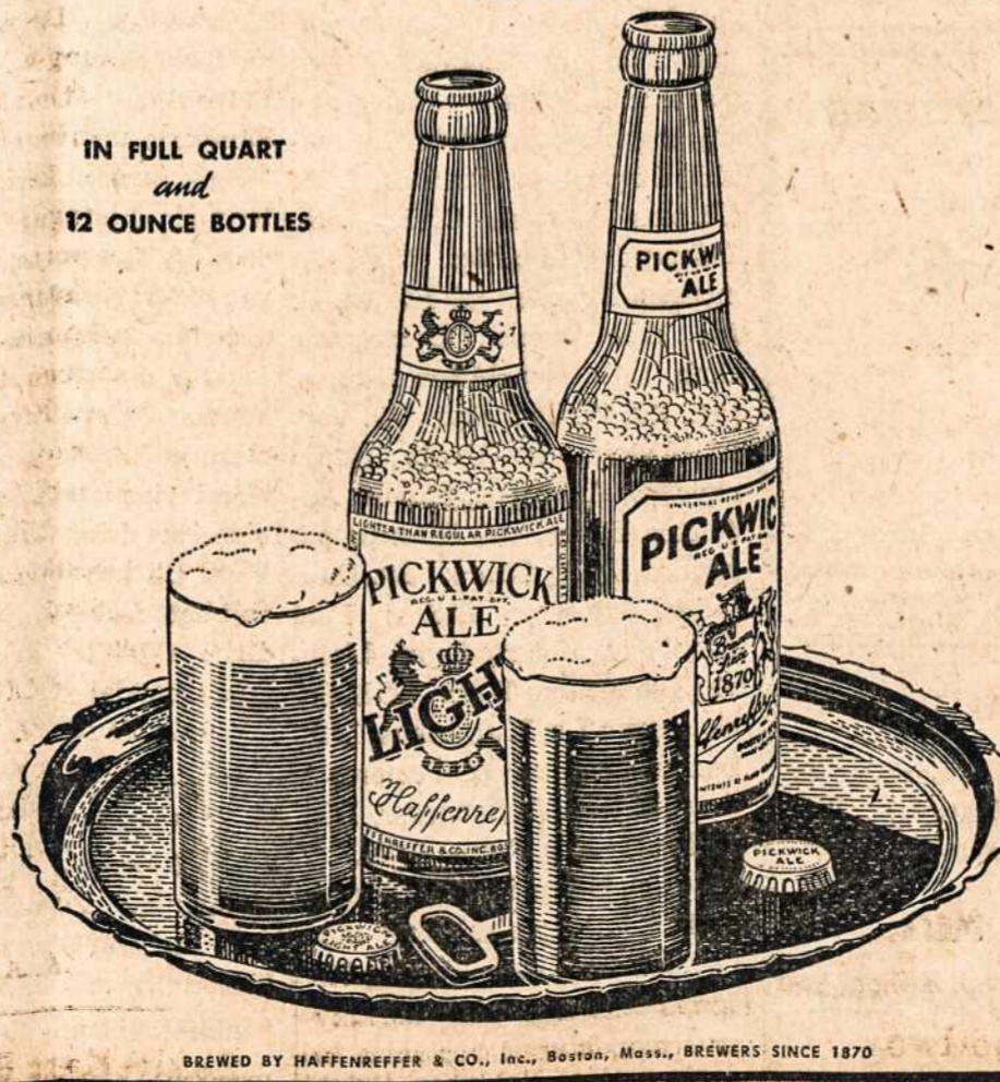
BREWED BY HOFFENREFFER & CO., Inc., Boston, Mass., BREWERS SINCE 1870

Pridek prie linksmesnes Pavasario dienos gaivinanti stiklą PICKWICK "ALE that is ALE"