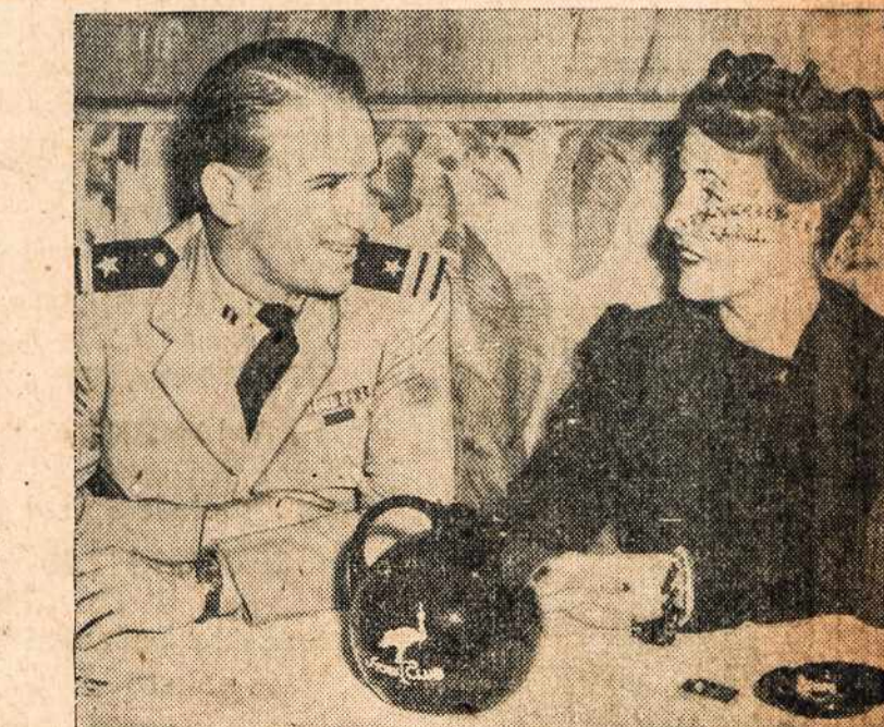
Lieut. Douglas Fairbanks, Jr., pietų metų Stork klube New Yorke, kai jis pagrįžo vakacijoms iš pačiųjų vandeniuose pareigų. Jo krūtinę puošia daugybė atsižymėjimų ir iš papuoštos krūtinės spinduliuoja meilė savo žmonelei.

Vėliavos iškėlimas Dėdės Samo kareiviams pagerbti šv. Antano parapija, Helve-