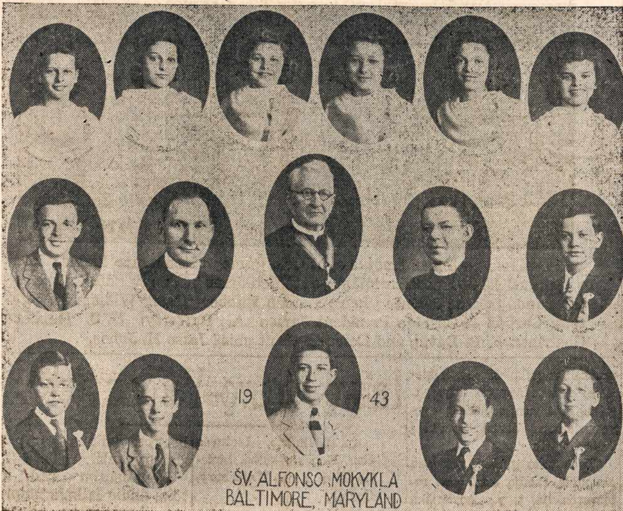
SV. ALFONSO MOKYKLA BALTIMORE, MARYLAND