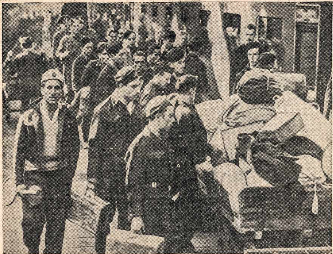
Kai šie italai - kariai buvo paimti į nelaisvę Šiaurinėje Afrikoje, tai jie buvo nugabenti į Londoną. Pažymėtina vienas iš anų italų belaisvių (matomas kairėje) niekur nesiskiria su savo tennis žaidimo įrankiu. Matyt "good sport".

Čionai namie mes darome prisirengimus dideliems darbams, kurie ap-