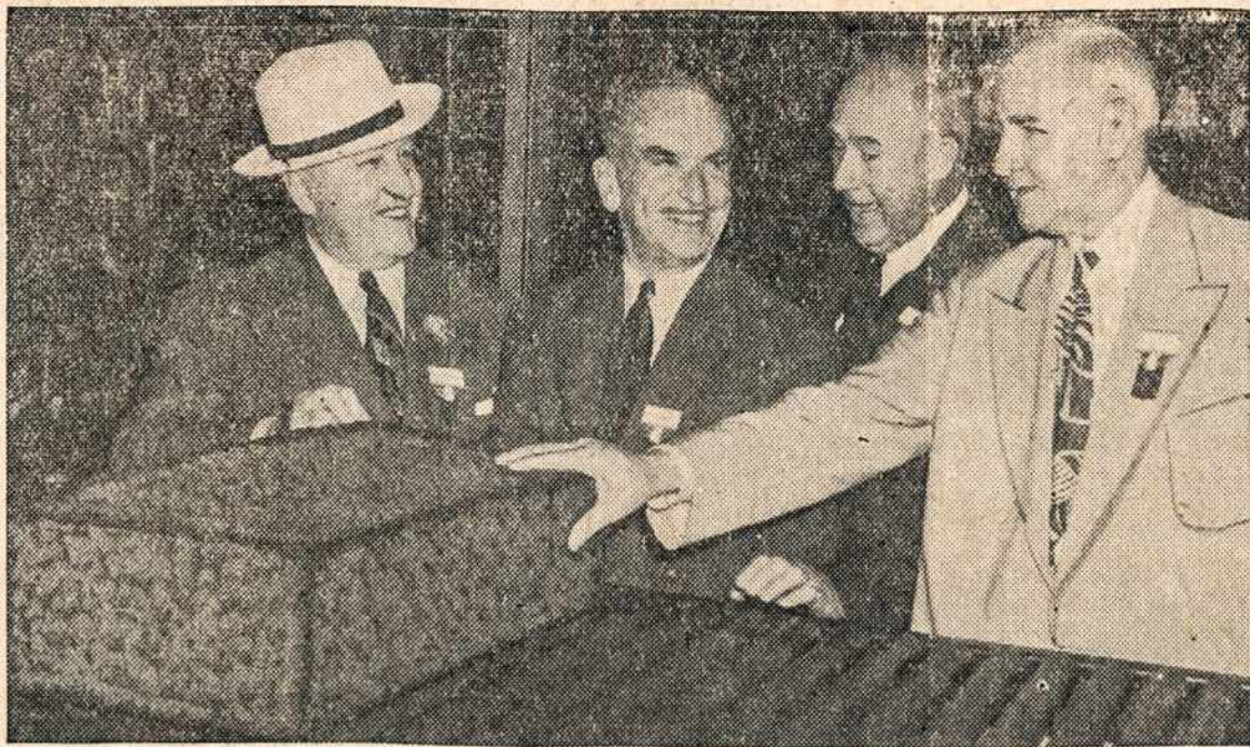
Paveiksle matomas šmotas synthetic gumos užtenkamas kiekis, kad pagaminti 20,000 pasažieriniams automobiliams padangų...

266 West Broadway, South Boston, Mass Telephone SOUTH Boston 2680