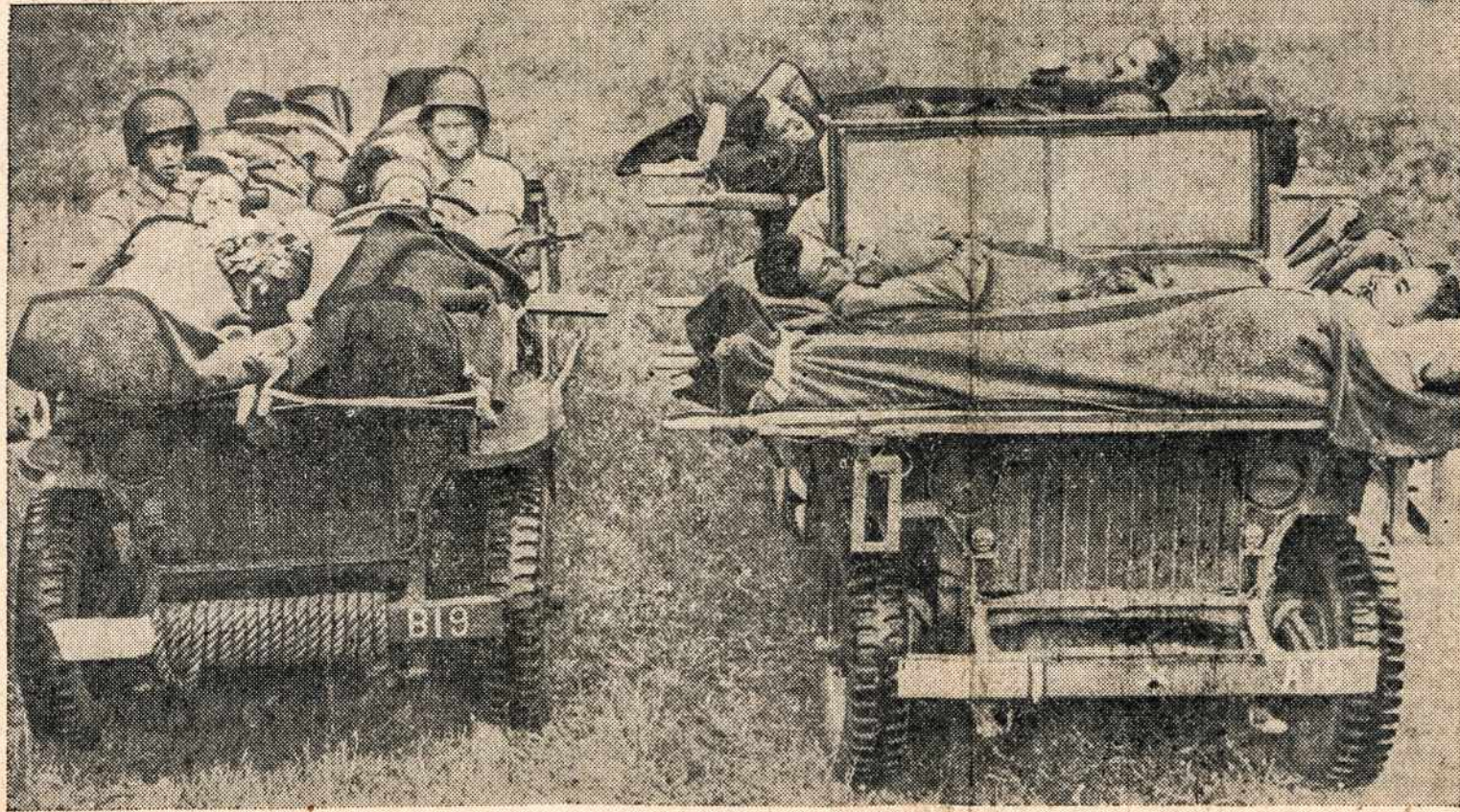
Naujos rūšies kariškas automobilis, kuris vadinasi "JEEPS" pritaikytas karo lauke važiuoti ir sužeistųjų. Šio paveikslėlio vaizdas parodo, kaip šios rūšies sužeistieji vežiami iš karo lauko. Tai lengvos rūšies automobiliai, kurie visur parankūs.