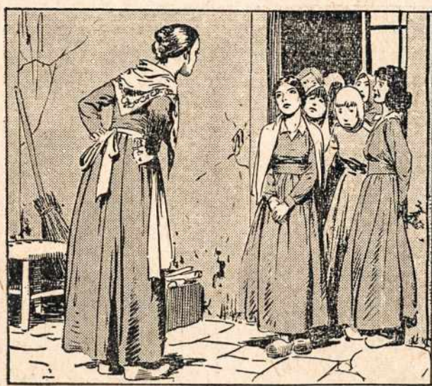
"Ar tu proto nustojai", tarė Subirūvienė.