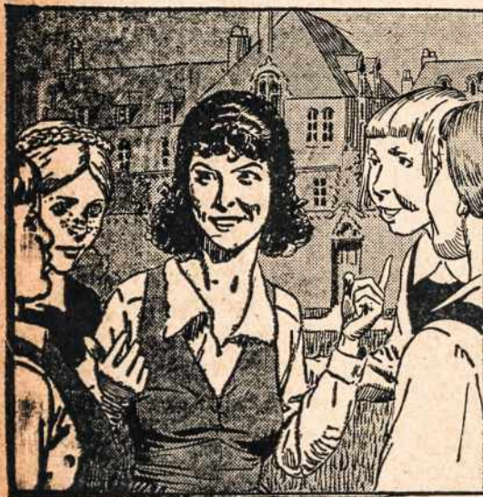
Joana kalbėjo mergaitėms...