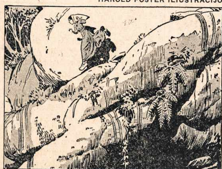
Bernadeta bėgo prie Masabelio urvo.

FRANZ WERFEL HAROLD FOSTER ILIUSTRACIJOS