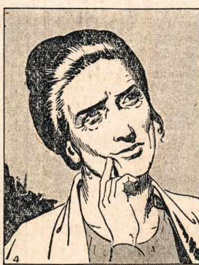
Atėjo jai mintis...