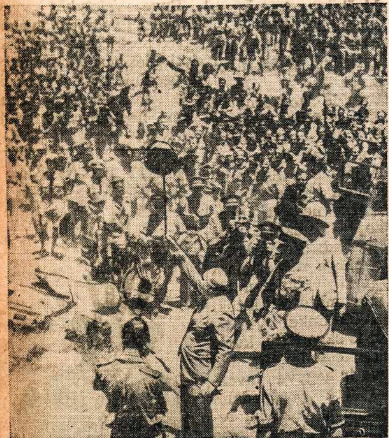
Kai Britų ministras pirmininkas Churchill nuvykęs į šiaurės Afriką, Carthage, kalbėjo miniai kareivių, tai jį visi matė, o kurie buvo toliaus tai matė jo iškelta ant lazdos kepurė.