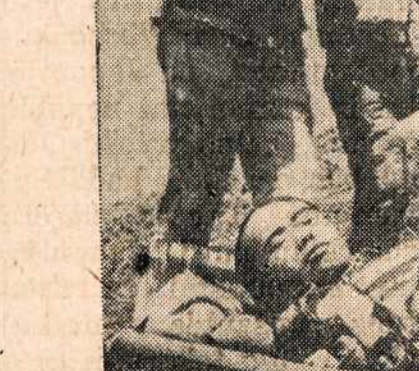
Amerikos Raudonojo Kryžiaus išlavinta kinietė slaugė suteikia sužeistajam kiniečiui kariui pirmąją pagalbą. Lengviau sužeistieji laukia savo eilės.