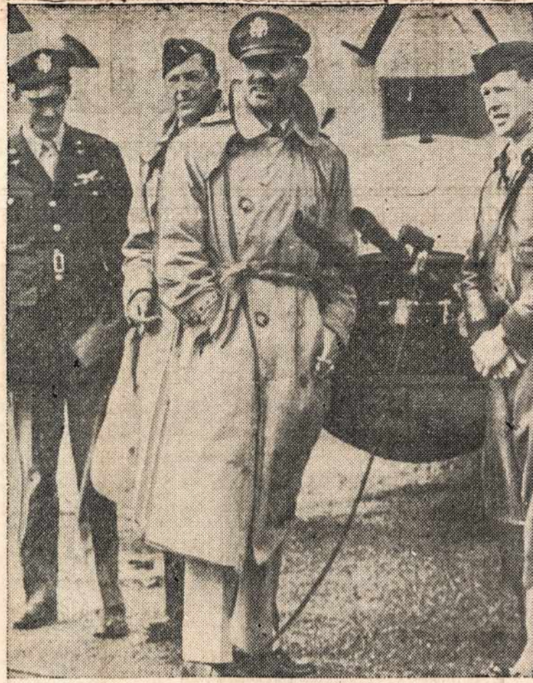
Kariai lakūnai kur nors Anglijoj. Priešakyj mato-mas kapitonas Clark Gable.

Sakoma, kad užpuoli-mas greičiausia bus pa-darytas politiniais sume-timais, nes jis nebuvo ap-vogtas ir neturėjęs jokių priešų.