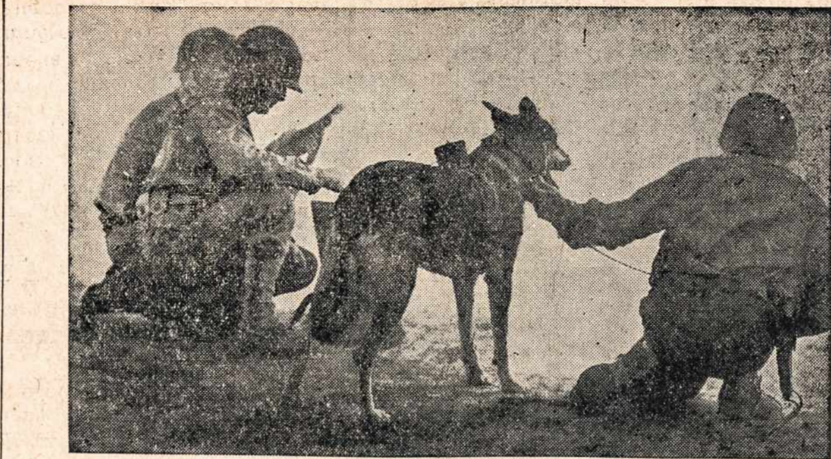
TELEPHONISTAS ŠUO — Gal būt tamstai tik šuo, bet šiems kariaus jis yra tikra telephonistas. Jis taip išmokintas, kad telefono kariai užtaisę vielą su špule pasiūnčia ši šunį į fronto pirmutinę liniją, kur jis nubėgdamas nutraukia ir vielą. Ten kariai prisijungia telefoną, o šuo akimirksniu ir vėl su savo štabu telefonistų.

Būdamas šešiolikos metų savo amžiaus, jis paliko savo namus ir iškeliavo į San Germano pas savo dėdę, kad ten išmokytų kaip reikiant vesti bizniaus amata, kaip jau seniai jojo dėdė to pageidavo. Mat jojo dėdė labai troško padaryti jį savo turtų įpėdiniu. Čia jaunajam Pilypui buvo auksinė proga, lengvai pa-