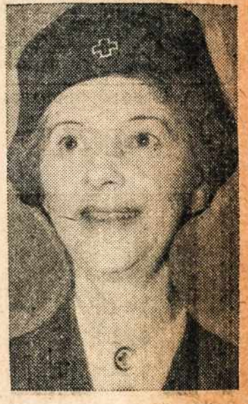
HOME AGAIN—Mrs. Theodore Roosevelt, wife of Brigadier General, arrives in New York by ocean clipper after 10 months in England as director of clubs for American Red Cross. Her son Quentin, captain, is recuperating in New York from wounds suffered in Tunisia. Husband still abroad.

Šio gyvenimo laimė siepia savy kančių bedugnę: atkasei laimę, tuoj išsiveržė ir kančių šaltinis.