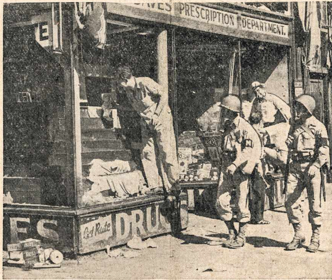
Paveiksle matomas vaizdas, kai Detroite po baltųjų su juodaisiais riaušių, darbininkai nuvalo sumuštųjų langų skeveldras. Šiose riaušėse žuvo apie 28 asmenys ir apie 700 sužeista. Riaušėms malšinti buvo išaukta kariuomenė. Kariuomenė riaušes likvidavo.

Visa dauguma amerikiečių tebesilaiko ir naudoja si keturiomis laisvėmis. Jung. Valstybės kovoja su priešu, kad pasauliui užtikrinti keturias laisves.