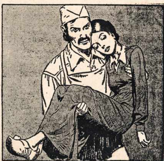
FRANZ WERFEL HAROLD FOSTER ILIUSTRACIJOS