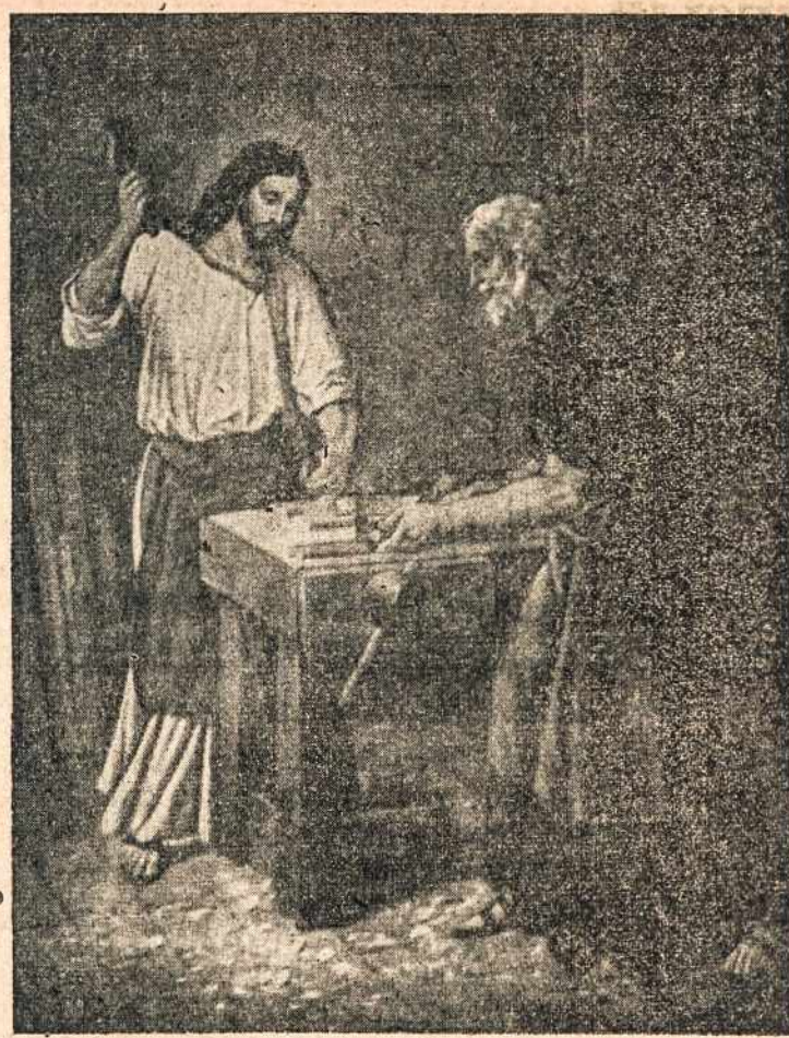
Kristus — iš "Zvaigždė" KRISTUS DARBININKAS

BAŽNYČIA — DARBININKŲ UŽTARĖJA Pijus XII, kalbėdamas Italijos darbininkams sakė: "Jūs gerai žinote, Brangieji sūnūs ir dukterys, kad Bažnyčia jus karštai myli, ir kad ji ne tik dabar, motinišku rūpesniu ir meile ypatingai atsižvelgia į reikalus, kurie tiesioginiai jus liečia, bet tai darę visais amžiais. Mūsų pirmtakūnai ir Mes patys nepraleidome nė vienos progos pakartotinai nepareiškę nurodymų jūsų ir jūsų šeimų reika-