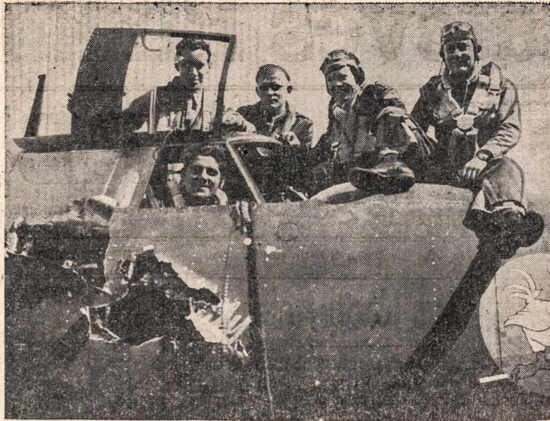
Džiaugiasi sveiki sugrįžę lakūnais bombardavimo darbo, nors jų bomberis ir skaudžiai sužalotas. Matosi perskrostant nemažą šovinio bomberio šonas. Bet lakūnai sveiki.

La Paz, Bolivija, rugs. 16 — Pereitą antradienį Bolivijos ministerių kabinetas atsistatydino. Priežastis — atstovų rūmų nutarimas prarasti tarydama dėl valdžios elgėsi Catavi kasyklų streiko metu.