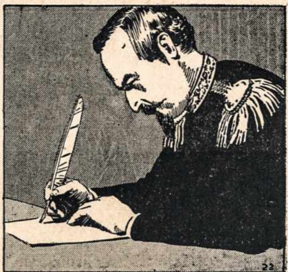
FRANZ WERFEL HAROLD FOSTER ILIUSTRACIJOS

— Difterija, — tarė Eugenija — Liudvikai, duok jam Liurdo vandens. —