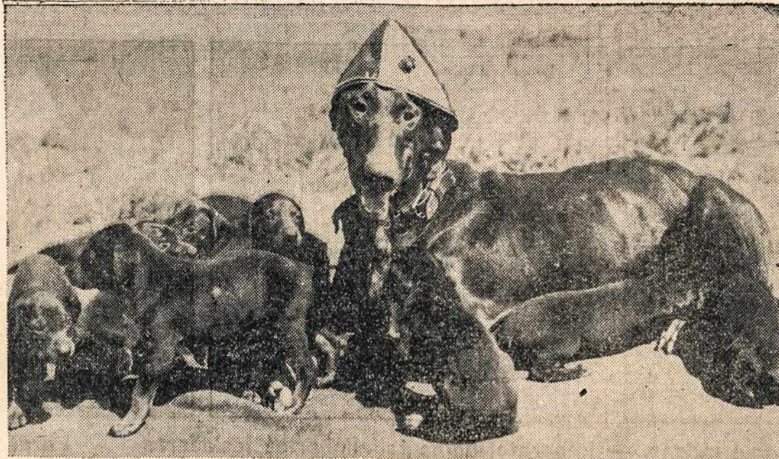
Karo tarnybos nariai dažnai palaiko savo tarnybiniam reikalams ir šunis. Tatgi tam tikrą šunų veislę ir palaiko, kad daugiau priaugintų reikalingos pagalbos. Vaizdas parodo, kaip tūlos veislės šeima pagausėjo čielu dešimčia narių.

Grįžtant prie taikos šaltinio, kurios sargas yra teisingumas, reikia pasakyti, kas vienas faktas stovi neaptemdomas, būtent, kad teisingumas ir taika pasiekiami tik pasiaukojimu; pasiaukojimas moko atsižadėjimo, o ne savo reikalavimų statymo. Nei sindikalizmas, nei klasių bendradarbiavimas, nei kooperatyvės organizacijos, nei sveikas tautiškas, nei tautinis auklėjimas negali susilaukti teisingumo nei socialinės taikos, ar tautų taikos iki pasiaukojimas bus išskirtas, o reikalaujama tik šalto teisingumo.