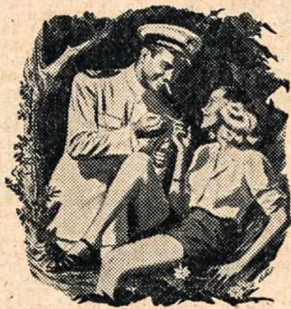
TAS PADARO DIDELĮ SKIRTUMĄ JUMS

Apipurkšiant Old Gold's parinktus mišinius — jįmant ir malonius Latakia — taip, kad kiekvienas kampelis yra pasiekiamas. Obuolių "Medus" sulauko sausumą, apdraudžia natūralų drėgnumą, kuris yra svarbus skoniui ir šviežumui.