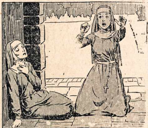
Staiga ji sukniūbo