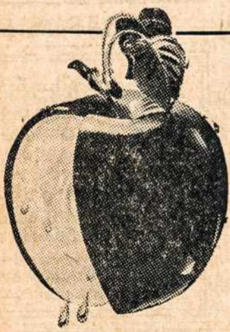
TAS PADARO DIDELĮ SKIRTUMĄ TABAKAMS

Apipurkšiant Old Gold's parinktus mišinius — jįmant ir malonius Latakia — taip, kad kiekvienas kampelis yra pasiekiamas. Obuolių "Medus" sulauko sausumą, apdraudžia natūralų drėgnumą, kuris yra svarbus skoniui ir šviežumui.