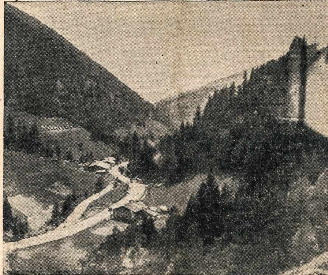
Šis vaizdas parodo garsųjį PERĖJIMĄ (Brenner Pass), kuriuomi ruožiuojasi Italijos ir Vokietijos žemės. Tai kelias, kuriuomi reiks naciams iš Italijos išsinešti, kai bus užduota lemiantis ir tai paskutinis smūgis Italijoje.