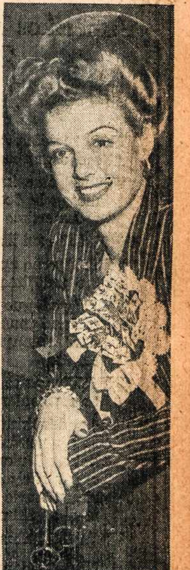
LOVELY ANN—Lovely Ann Sheridan, Warner Bros. star, arrives in New York aboard train. She wears corsage of War Bond pledge lapels presented her by Women's Division of New York's National War Fund Committee.