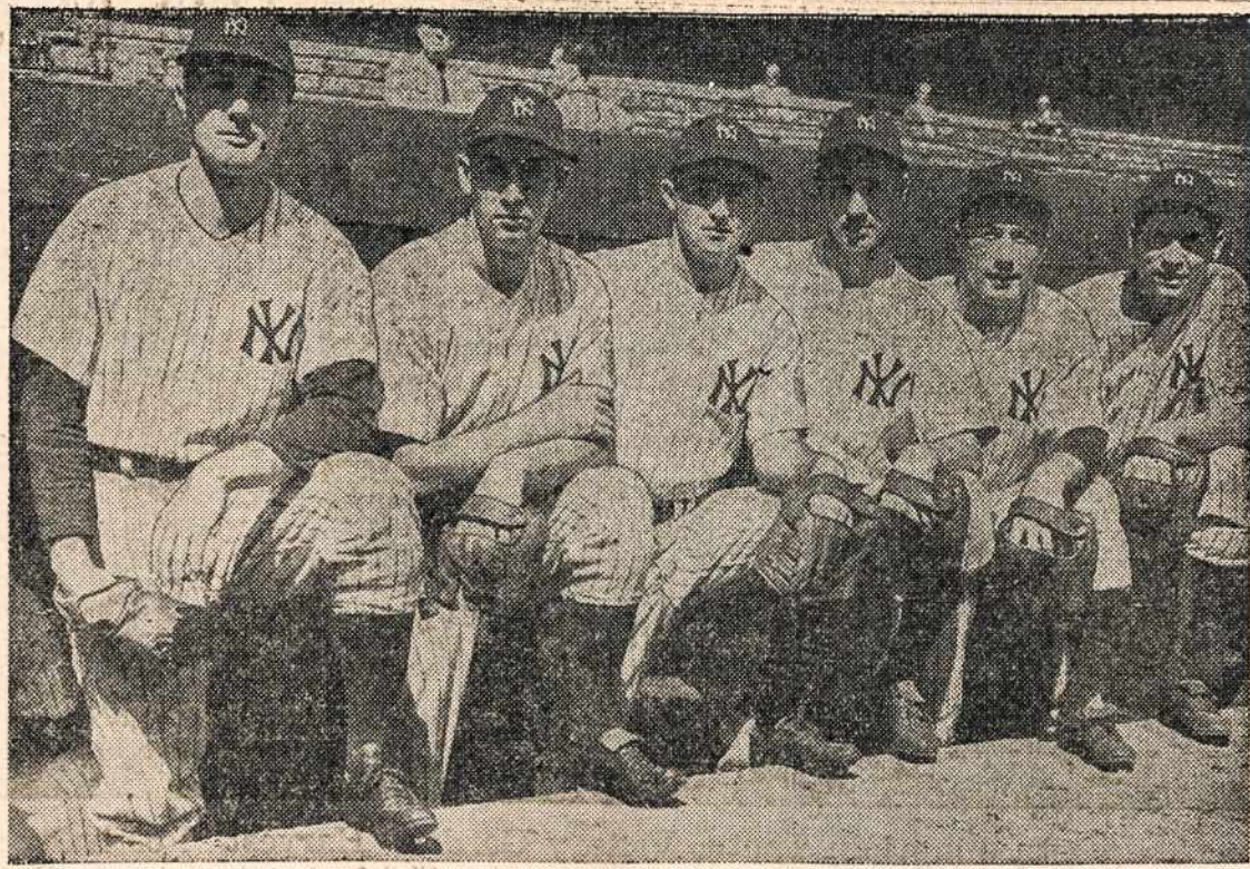
Šie YANKEES, American League čempionai. Iš dešinės į kairę: Nick Etten, Joe Gordon, Bill Johnson, Frank Crosetti, George Stirnweiss ir Oscar Grimes.

— Šv. Pranciškus myli maldą, bet jos nepririšo prie vienos vietos, nors ši vieta ir būtų bažnyčia. Kai ateina maldos laikas, tai vistiek, kur ši valanda Pranciškų užklupdavo, grotoje ar miške, gatvėje ar pievoje, saulėj ar lietuje, jis kalbėdavo maldas nieku nepaisydamas ir nieku nesivaržydamas. Tuo savo būdu jis panašus į atsiskyrėlius. Bet nuo jų skyrėsi tuo, kad jis nesizėgnojo, nesimušė į krūtinę, neužsikimšo ausų, kai išgirdavo žiogą ar lakštutę giedant sykiu su juo. Iš jų jis sudarydavo chorą, nes jis jautėsi laimingas galįs įprasminti ir sujung-