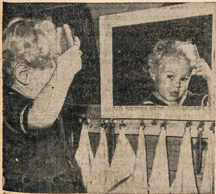
Kai mamytė užimta darbu, tai mažytis pats pasidabina. Kas sako, kad maži nesupranta meno?..

Vyras išėjo savanoriu. Ji liko su mažu kūdikiu. Pristigo ir valgio, ir malkų. Bolševikai galėjo bile valandą ateiti. Išvažiuoja vyro aplankyti. Nuvyksta į kareivines. Užlipusi laiptais mato civiliniais drabužiais