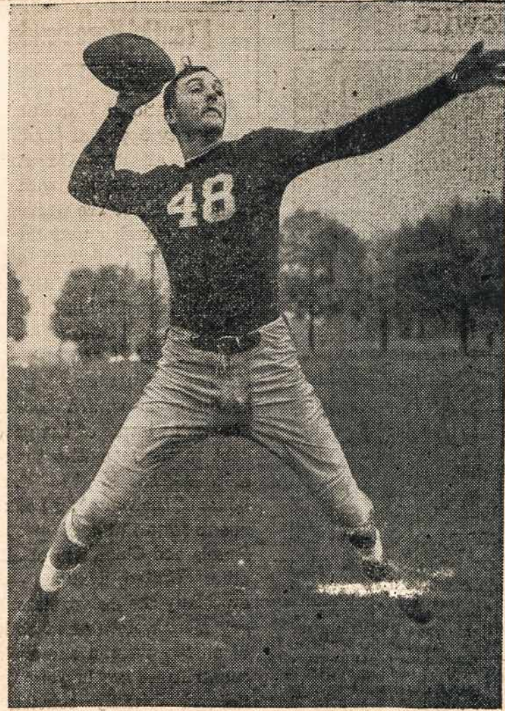
Notre Dame smarkus žaidikas meta futbolo bole.

kareivį (tada dar tikrų uniformų neturėjo), suvargusį, daugiau panešinti į senelį.