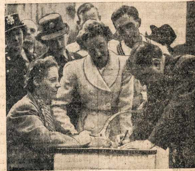
Alice Marble, moterų pasaulio tennis čempionė ir kitos žymios asmenybės prieš pradėdamos savo žaidimą parduoda karo bonus. Vaizdė matomas New Yorko miesto mayoras La Guardia, kuris pasirašo savo įžangos duoklę pirm negu bus įleistas užimti žiūrovų vietą.