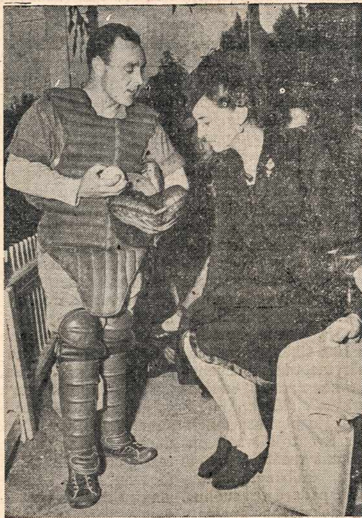
Duchės of Kent įdomiausi baseball žaidiko amerikiečio, kuris Anglijoje žaidė Yankių vardu dėl labdarybės, metiko bolės metimo būdu.

Nelaukime karo pabaigos! Viena, kad karo metu misijonieriai mažiausia gauna paramos. Antra, karo metu didesni uždabiai. Trečia, karas duoda