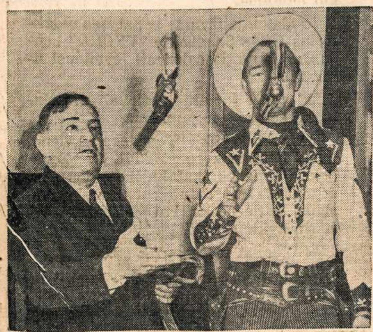
Roy Rogers, karalius "cowboys" mokina New Yor-ko mayorą La Guardia, trikso. Štai pištalietas pakibęs ore laukia rankos, kad jį pagautų.

Gabų studijozą seminarijos vadovybė dar pasiun-tė pagilinti mokslo Petrapilio dvasinėje akademijoje; bet ta "šiaurės Venecija" pasirodė jo sveikatai nepa-lanki, ten daugelį kamavo tifas ir džiova, nuo ko nu-kentėjo ir mūsų poetas ir pabėgo į pietus stiprinti plaučių. Čia jisai Tirolio ir Innsbrucko universitetuo-se gilinosi teologijos ir filosofijos moksluose. Tas jam buvo pravartu, nes apie savo darbą Petrapilyje jis at-siliepia: