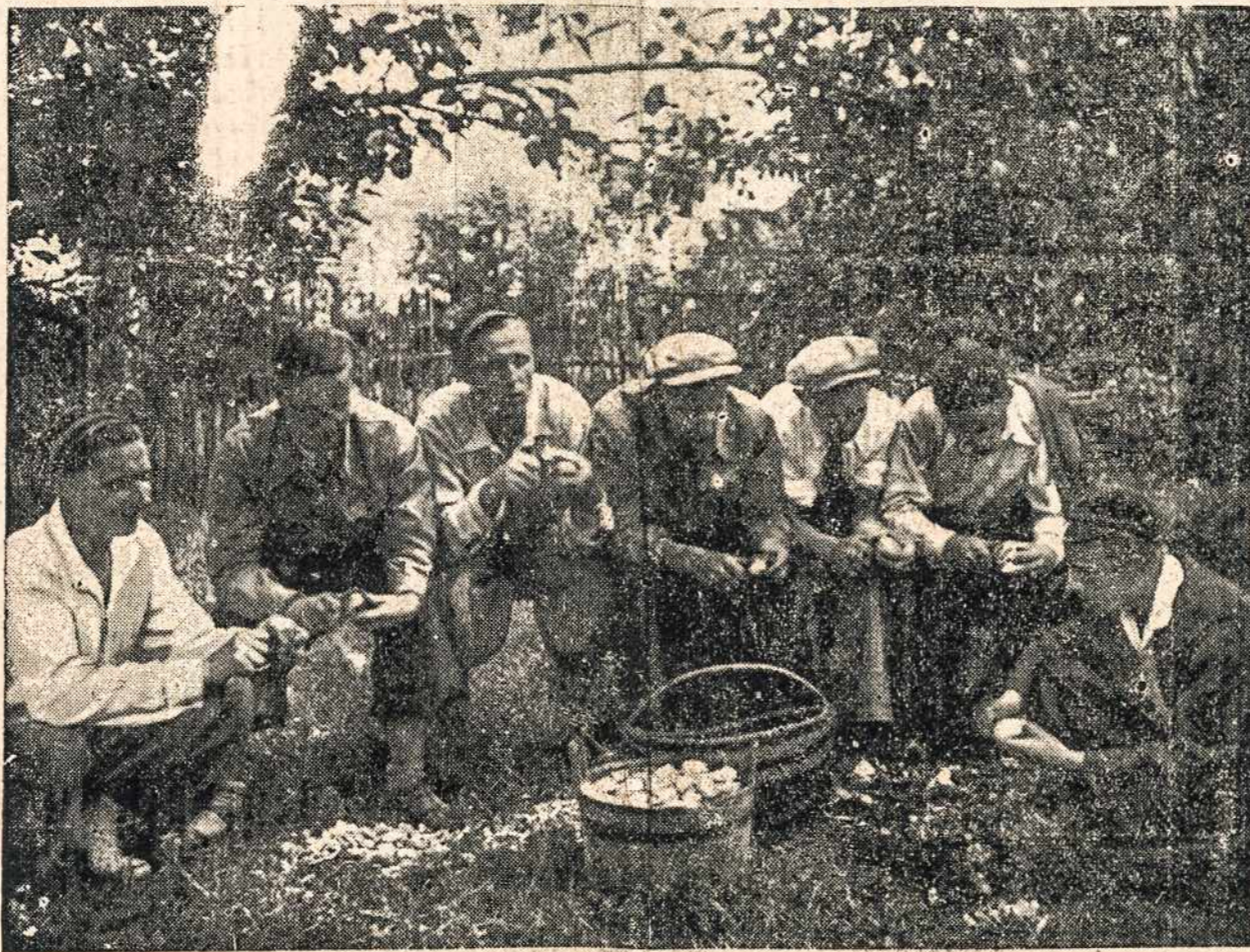
LINKSMAS SPORTAS — Vilniaus studentai bulvių kasimo talkoje, Lietuvoje.