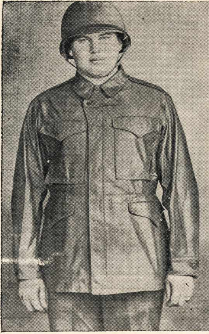
Naujas kariškas mundierius (jacket), kuris turi keturius kišenių ir pagamintas iš švelnios verstos satynos materijos.

Taip pat Viešpats Jėzus dukrelė, kai Marija ir