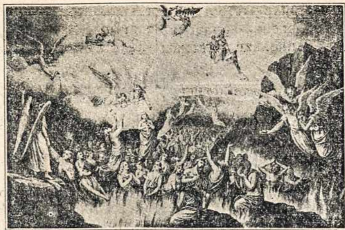
Šiandien, prisiminkime mirusius nuoširdžiose maldose.

Dar viena, — gal būriausioji — bobiškumo ypatybė — ilgas liežuvis. Ar daug yra moterų, kurioms galima būtų tvirtai pasitikėti, pavesti svarbią paslaptį? Ar neteislinga ta visuotinė nuomonė: norint, kad visi ką nors žino-