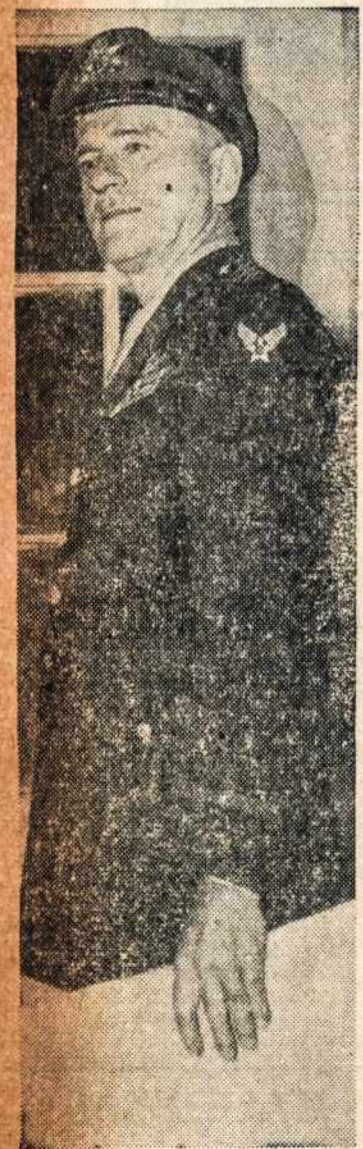
REPORTS—Lieut. Gen. Carl Spaatz, commander of the Northwest Africa Air Force, arrives at White House for luncheon with President Roosevelt. During luncheon he made report of activities of his command.

Viena bobiškumo ypatybių yra verksmingumas. Ašara ir juokas tai gražių gražiausios Dievo dovanos žmogui, tik jam vienam tesuteiktos. Jomis betarpiškiau pasireiškia mūsų siela. Ašara yra kažkas tiek šventa, tiek kilnu, tiek stebuklinga, kad turėtų suduoti lig pat dugno kiekvieną širdį. Dėl to ir Kristus savo palaiminimuose mini ir verkiančius. Evangelija rodo mums patį Kristų verkiant du kartus: vieną kartą apsiverkė Jis gailėdamasis Jeruzalės, kuri turėjo būti sugriauta, antrą kartą gailėdamasis žmonių, verkiančių Lozorias, ir sugraudintus prietelio mirties. Abudu kartu iš meilės: iš tėvynės meilės ir iš artimo meilės. Tai yra mums pamokymas: tik-