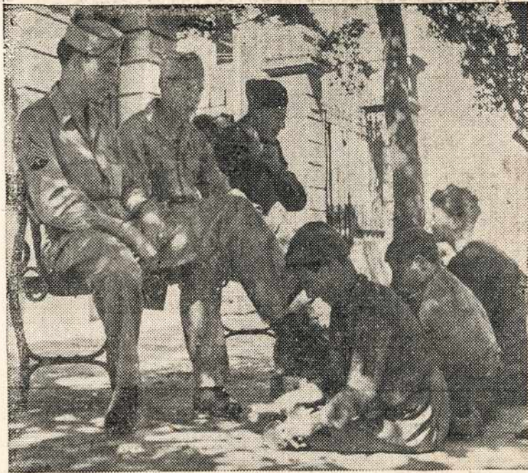
Afrikos Algeriečiai valo batus Yankiams.