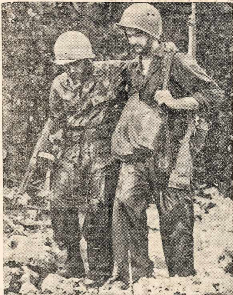
Du Dėdės Samo sužeisti kariai gelbsti viens antram. Jie eina iš gilumos džiunglių į pamari, New Georgia saloj, kur tikisi, kad bus paimti, nes ten lūkurioja laivas, kuris tuojau nuveža į saugesnę vietą.

Jis juk buvo vienu iš Motinėlės draugijos organizatorių. Ją steigiant turėta tikslu: — Kelti, gaivinti, užlaikyti Lietuvystę ir iškariauti