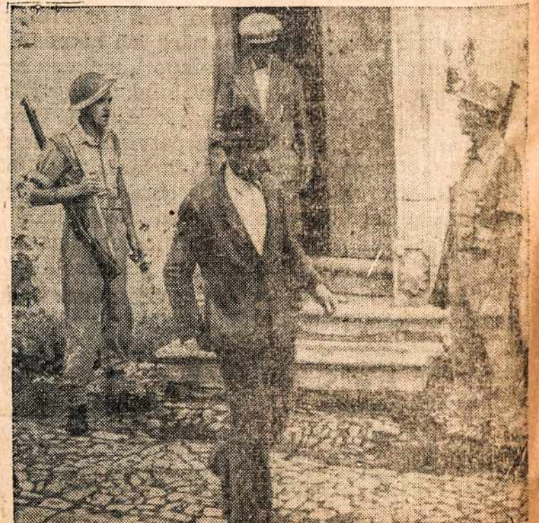
Bričių sągyvoniai Italijoje turi surinkę fašistus ir kaip paveikslas parodo, juos saugoja.