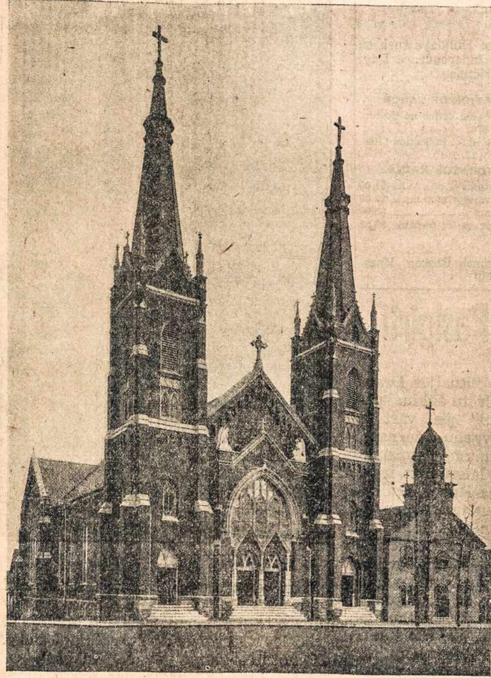
DABARTINĖ ŠVENČIAUSIOS TREJYBĖS BAŽNYČIA

Altorius nepaprastai gražus, padirbtas iš importuoto marmuro, tikrai sužavi kiekvieną tikintį žmogų įėjusį į švč. Trejybės bažnyčią. Arčiau prisžiūrėjusiam to marmuro sunkumas ir tvirtumas, rodo, atvaizduoja Katalikų Bažnyčios nenugalimą jėgą, tą uolą ant