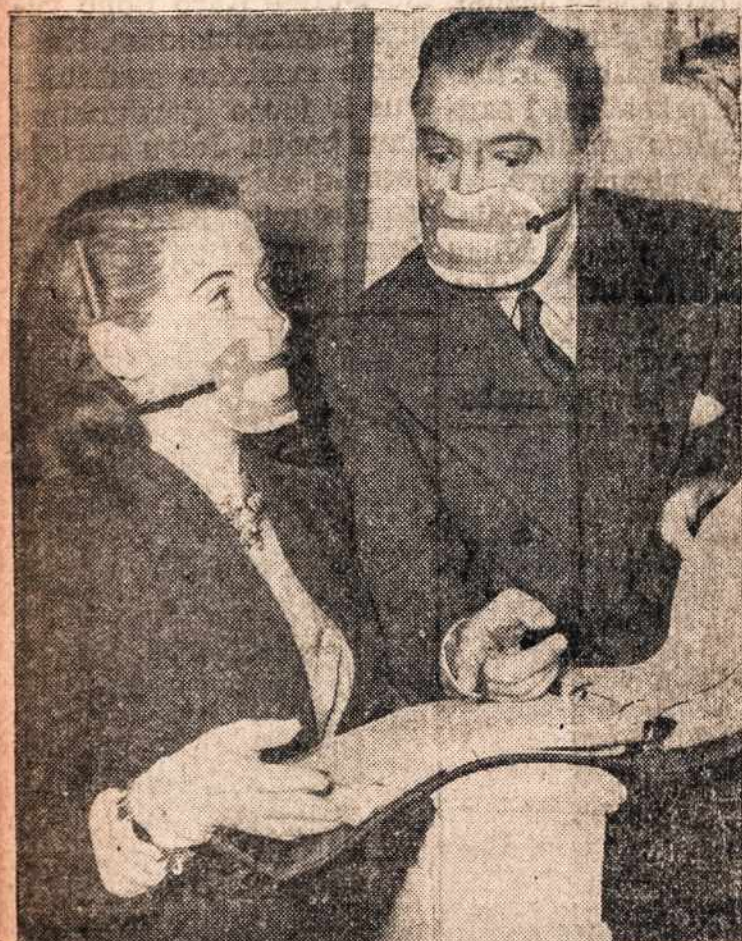
Ko tie artistai neišgalvoja?! Štai Jack Benny laike praktikos valandų užsidėjęs maską ant veido, kad nepagautų flu ligos. Taip turi daryti ir kiti jo partneriai.