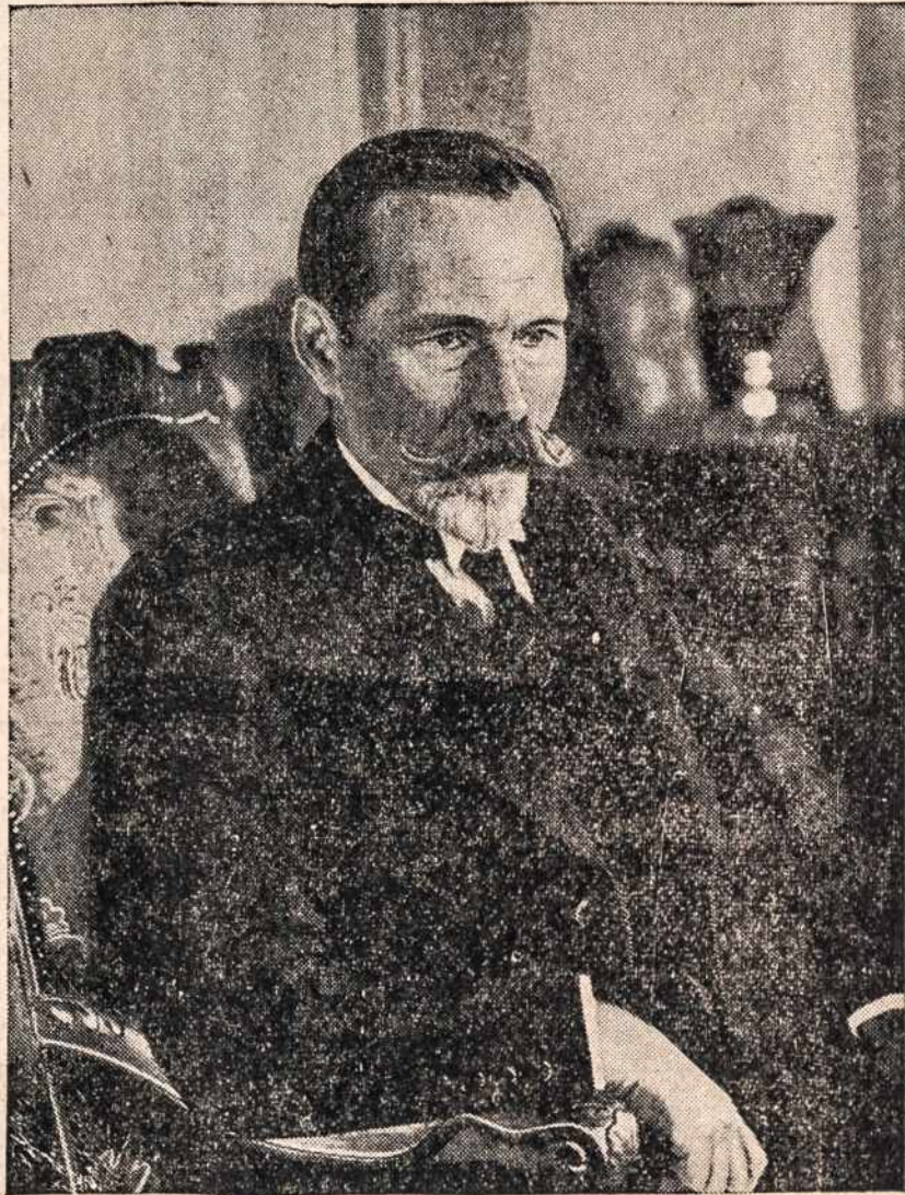
A. a. Antanas Smetona