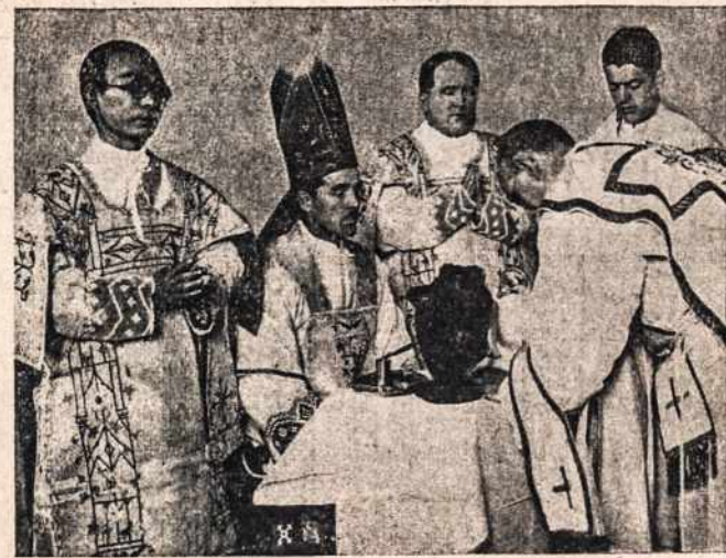
Katalikų vyskupas negrui teikia kunigystės sakramentą.

Toks pasiteisinimas tik paviršutiniai ir reikalus žiūrint atrodo turįs šiek-tiek tiesos, bet ištikrųjų nepaliuosuoja tikinčiųjų nuo pareigos šelpti tarp stabmeldžių misijas. Nes jei viena, antra, trečia ir ketvirta tauta panašiai pradėtų teisintis, atsisakytų, tai netrukus katalikų Bažnyčia visai netektų misijų ir turėtų aukštai susitraukti savo gyvenime. Antra, nereikalaujama visą paaukoti, atiduoti svetimsalių misijoms apleidus savo krašto Bažnyčios reikalus. Žmonės turėdami savyje sužadintą gyvą užuojautą ir pasiukojimą stabmeldžių misijoms, prielankiai ir duosniai rems ir savo krašto reikalus. Tuomet ir pasirodys misijų darbo grįžtančioji palaima savo kraštui. Meilė bendrų visos Bažnyčios reikalų verčia karščiau rūpintis savo tautos viešais reikalais, Bažnyčiai naudą atnešančiais. Kitaip ir negali būti. Krikščionis katalikas užsidegęs noru suteikti brangiausią dvasios turtą — tikėjimą vargstantiems mirties tamsybėse stabmeldžiams, būtinai stengsis tą brangų tikėjimą palaikyti savyje ir tarp savųjų. Bet ir priešingai: negalimas dalykas, kad geras katalikas, suprasdamas, kaip jam pačiam brangus ir reikalingas yra tikėjimas, netroškėtų jį išplatinti tarp kitų, tarp stabmeldžių.