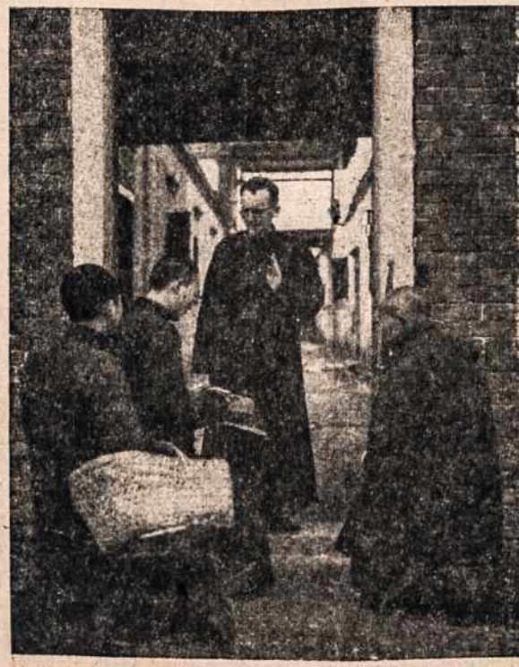
Kiniečiai krikščionys aplanko misijonierius. Jis pakelia juos nuo uolius, stiprina silpstančius, moko klystančius, gelbsti vargštančius...

Du Romos ciesoriaus rūmų aukšti tarnautojai netikėtai turėjo dvi dienas praleisti vienuolyne. Vienas jų nuobodžiaudamas ėmė skaityti šv. Antano atsiskyrėlio gyvenimą. Skaitė ir beskaitydamas pamažu traukė savo širdį nuo pasaulio. Perskaitęs visą knygą, tarė savo draugui: "Mano mielas! Mes esame neišmintingi. Tarnaujame žemės karaliui, rūpinamės įgyti jo malonių ir prietelystę, kuri truks vos keletą metų, o visai nesirūpiname apie Karalių Karaliaus, t. y. Dievo, meilę ir malonę, kuri truks per amžius".