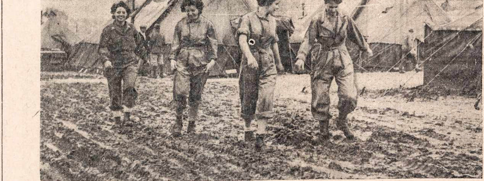
Amerikos slaugės Italijoje, tarp Capua ir Venafro, žygiuoja "gatve" ligi kulnelių purvo. Toliau matosi ligoninės stovykla. Jos turės užtektinai įspūdžių, kai sugrįš į Ameriką.

Kapelionas pabaigė maldą ir, pakėlęs liūdnas akis į leitenantą, tarė: — Šią mirties ir siaubo valandą primenu tau, mano broli — ne tik privalu rūpintis kūnu, kurį dras-