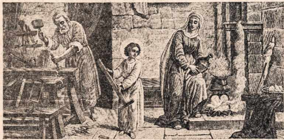
Erodū gi mirus, štai Viešpaties Angelas pasirodė sapne Juozapui ir tarė: Kelkis, imk vaikelį ir jo motiną ir eik į Izraelio žemę... Atėjęs gi gyvenimo mieste, kurs vadinasis Nazaretas, kad įvyktų, kas pranašų pasakyta: Jį vadins Nazarenu. (Mat. 2, 19, 23).