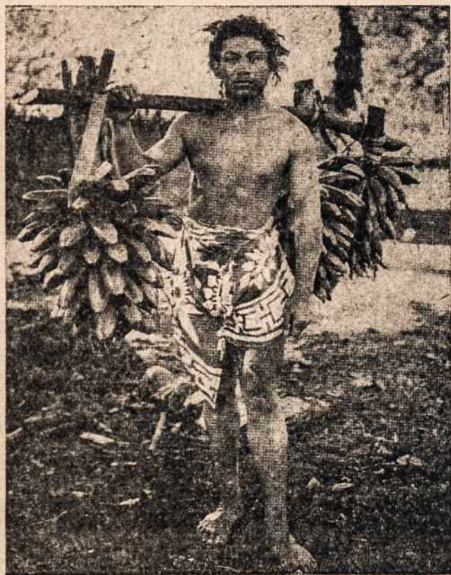
Tinaco gyventojas primityviais būdais neša bananas į turgavietę.

Be to, paskutiniiais laikais nekrikščioniškosios tautos ir valstybės, pakilusios savo tautiniam susipratime ima kartais gintis nuo Europos ir Amerikos kultūrinių įtakų, stengiasi užsidaryti savyje, o kartu nenori įsileisti nė misijų, kaip sau svetimų elementų. Tik atskleisdama savo Dievo duotąją mokslą ir tikros krikščioniškos kultūros lobyną Bažnyčia galės pasinaudoti dar prielankiomis misijoms aplinkybėmis ir vesti stabmeldžius į tiesą ir šviesą. Nuo dabartinio misijų veikimo priklausys visa katalikų misijų ir Bažnyčios ateitis tuose kraštuose. Nes be abejo, jeigu tos šalys ir tautos pateks į Kristaus tikrąją Bažnyčią, pasiliks ilgai-ilgai, gal visados; jeigu gi protestan-