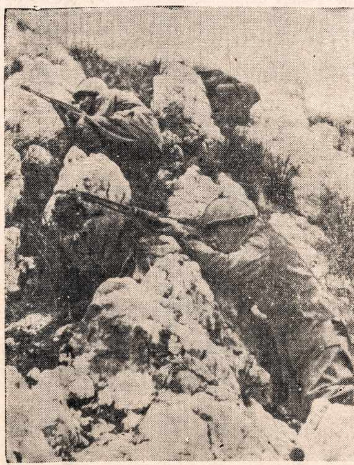
Šie italų kariai, prieš kiek laiko buvo Musolinio vadamai prieš Alijantus, dabargi petys į petį stovi su Alijantais ir kerta smūgiams, kad greičiau išvijus iš savo šalies.