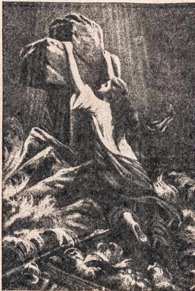
Manęs nebaido nė vilnys juodos, kruvinas žaibas, kaurėjas perkūnas, Kryžių — šaltinį šventos paguodos — atras ramybę dvasia ir kūnas.

Pasaulis 'tai išgirdęs nustebo. Į nuodėmes nugrimzdę šiuo mokslu piktinosi, bet kilnesnės sielos