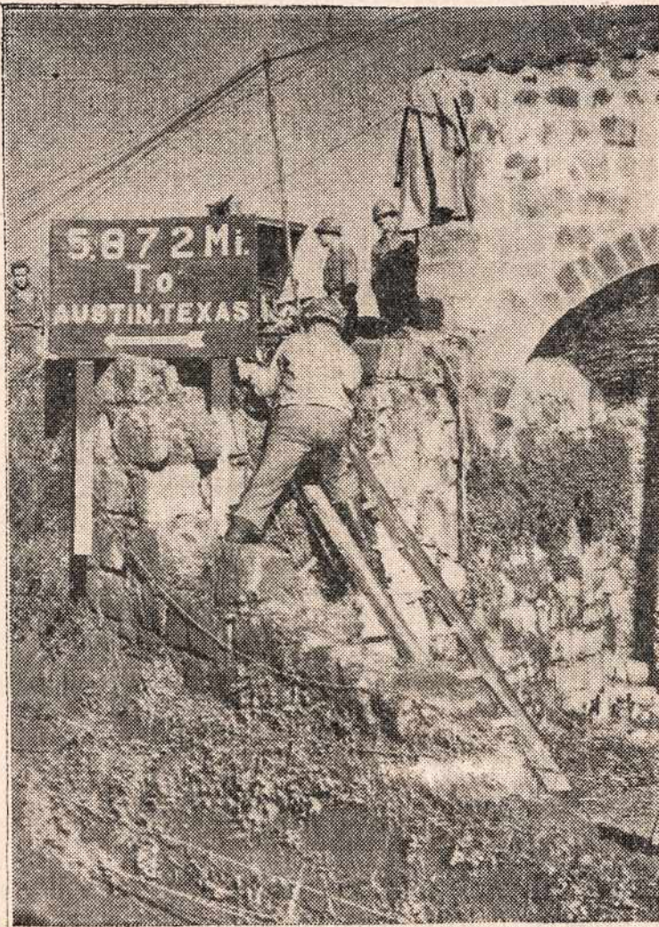
Dėdės Samo kariai nustato kelio liniją — pirmas sustojimas — Roma, antras — Berlynas, ir tuomet trečias — namie — Austin, Texas.

Remiant šita, šiandien taip svarbų pasauliečių apaštalavimą, ypatinga misija tenka šeimai. Šeimos dvasia jaunosios kartos dvasiai turi lemiamą reikšmę. Kol namų židinyje dega šventa Kristaus tikėjimo ugnis, kol tėvas ir motina pagal tą tikėjimą tvarko savo vaikų gyvenimą, tol, be abejo, mūsų jaunuomenė su mielu noru pripažins Jėzaus Kristaus valdžią ir griežtai pasipriešins tiems, kurie nori Atpirkėją iš viešumos pašalinti ir nelemtai užgauti Jo teises. Kur bažnyčios yra uždarytos, kur iš mokyklų išmeta kryžių, ten šeima lieka kaip ir nenugalima krikščioniško gyvenimo prieglauda, kurią yra maloningai davusi Dievo Apaizda. Ir, Dievui dėkui, nesuskaitomos šeimos vykdo tą misiją su tvirta ištikimybe, kurios nepalaužia nei užpildinėjimai, nei aukos. Abiejų lyčių jaunuomenė dideliu skaičiumi — net tose šalyse, kur Kristaus išpažinimas reiškia vargą ir kentėjimą — aikosi Kristaus Karaliaus sosto su tuo ramiu ir tikru psiaukojimu, kuris primena garbingiausius kovojančius Bažnyčios laikus.