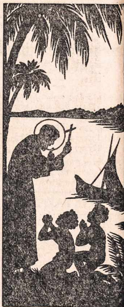
Į vieškelius, į žemės platumas, Į erdvių plotus beįmatomus Misijonierių kraujas įsisuirbs Jie tiesos skleidėjai visur.