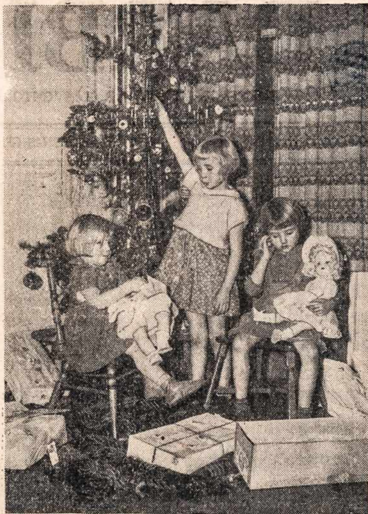
Kai šių mažyčių motina mirė ir tėvukas buvo karo darbe, tai vistiek juos atklankė Kalėdų Dėdukas. Juos dabar globoja nauji tėveliai.

Pagal Parinktinės Tarnybos patvarkymo, neutralis ateivis gali pasiliuosuoti nuo tarnybos ginkluotose jėgose Jung. Val. Jeigu neutralis ateivis paduoda