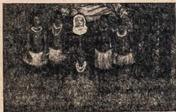
Misijų kraštuose Seselė su savo mokiniais