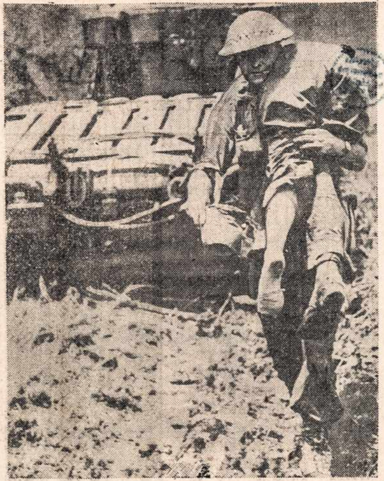
Australietis, New Guinea, Satelberg saloj, neša sužeistąjį karį, kai tuo tarpu tankai rieda pirmyn, kad sučiupus japonų lizdus.

Laikraštis pabrėžia, kad ingriai "nepajėgia apginti savo pačių interesus, kadangi jie nėra organizuoti," ir ragina suomių darbdavius pagerinti ingriams darbo ir gyvenimo sąlygas.