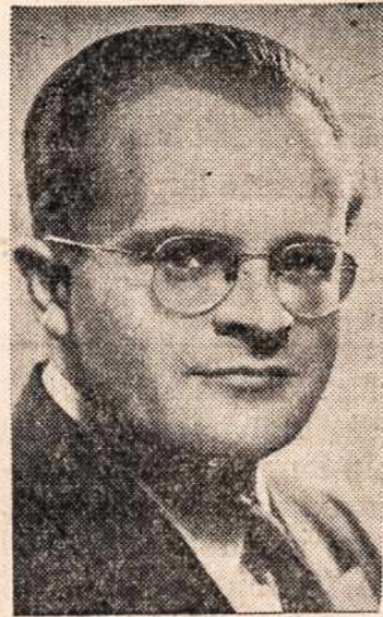
Kompozitorius Vytautas Bacevičius skambins pianu įvairių kompozitorių ir savo kompozicijos kūrinius.

Galite gauti klebonijoje, pas vargonininką ir choro narius. Programa bus tikrai graži, įvairi ir visus patenkinanti.