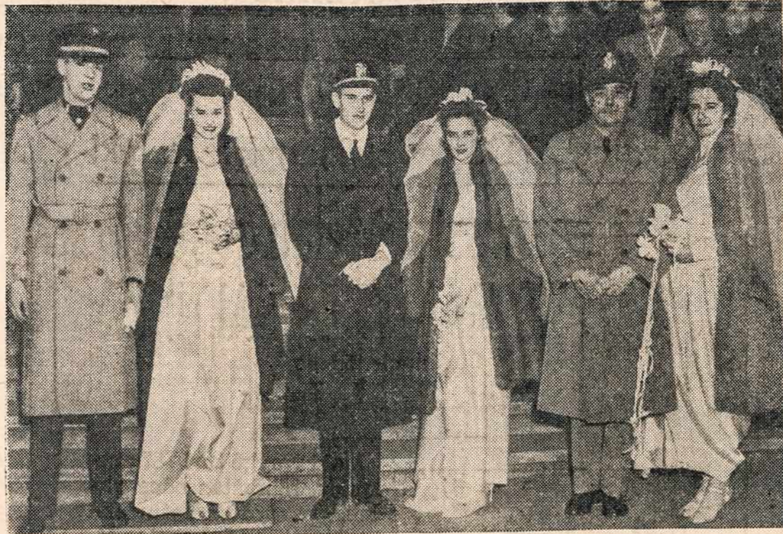
Kaip anoj dainelėj "Trys sesutės" apsidė visos kartu ištekėdamos — viena už armijos kario, antra — jūreivio, trečia — marino. Pažymėtina, kad dabartiniu laiku vedybų reikavimas labai aukštas. Įdomus psichologinis klausimas.