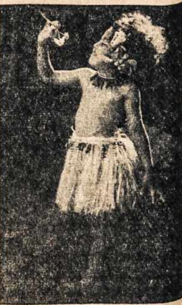
Tolimųjų kraštų mergytė džiaugiasi gėlele.

Liaudies mokytojas Sofronijus labai drausdavo savo vaikams draugauti su blogo elgimosi asmenimis. "Betgi tėve", tarė kartą septyniolikos metų dukterė Emilija, kurios Sofronijus neleido pas lengvatiką draugę Lucindą, "geras tėve, tu jau nebeprivalai laikyti manęs vaiku: tau draugės aplankymas man nieko nepakenks." Tėvas nieko netardamas, paėmė iš pečiaus užgesusį anglią ir padavė dukteriai. "Jis užgesęs, nebenudegsi rankų." Emilija paėmė iš tėvo anglį ir kaip mat visą susitėpė. "Matai, vaikeliai, tarė tėvas, "anglis ir užgesęs tepa. Taip esti ir draugaujant su blogais žmonėmis."