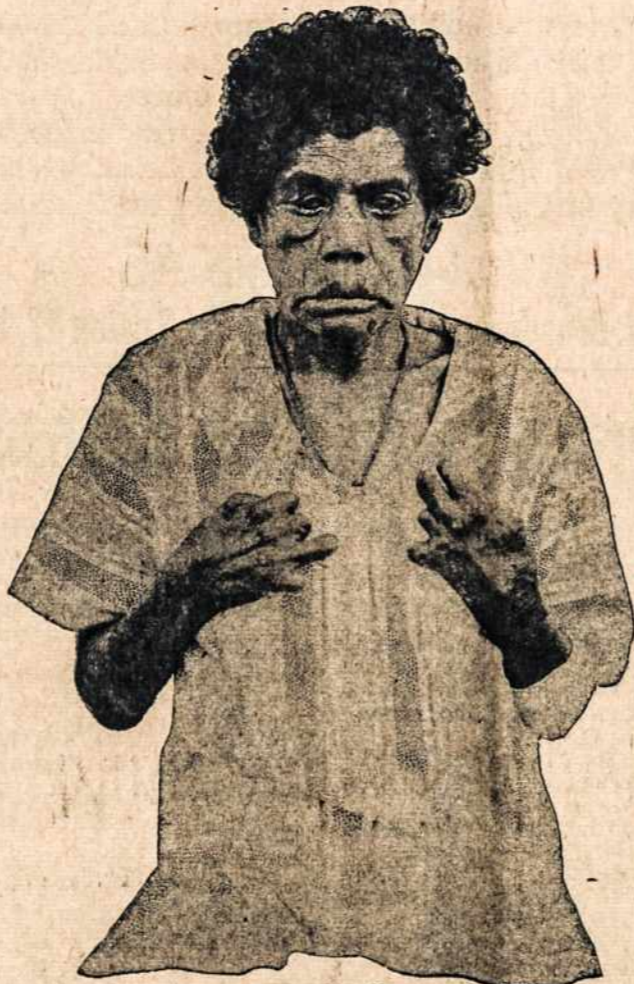
Misijų kraštuose, Jamaica, Marijos Nekaltos širdies Draugijos Seselės prižiūri raupsuotus vargšus.

Kilo ir griuvo tautos, imperijos, monarkijos. Bet Kinija iš visų pavojų išėjo nugalėtoja vien tik dėl to, kad sugebėjo išlaikyti nors ir nepažįstamo jiems Kūrėjo nuostatus, glūdinčius pačioje žmogaus prigimtyje. Kinija dabar kenčia karo siaubo siautėjimus, bet, manau, jai tai išeis į gera, ir ji netrukus apsidžiaugs dar niekad nematytu džiaugsmu: Kinijai jau artinasi išvadavimo valanda.