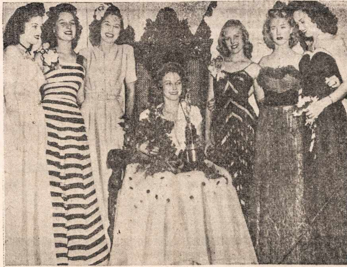
Šios kuklios merginos, tai karo dirbtuvės gražuolės, kurios dirba Santa Monica mieste. Jos iš savo tarpo išsirinko gražiausiąją, kuri sėdi viduryje. Manoma, kad gali susilaukti surprizo iš Hollywood talentų. Juk tai sekmingas dalinys.