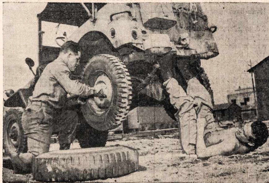
Stiprus žmogus, kuris gali taip palaikyti automobilį, kad galėtų perrainyti padangą. Jeigu kas netiki tokia galimybe, lai pats patiria. Kariams viskas galima ir tas įvyko Camp Gordon Johnston, Fla.

Mums tikrai yra džiugu žinoti, kad jūsų spauda yra tvirta Katalikiškų dėsnių aiškintoja ir platintoja; kad Marconi radio — kurio balsas akimirksniu girdimas visame pasaulyje — stebėtinai išradimas ir iškalbingas Apaštališkojo Tikėjimo skleidėjas — tankiai ir