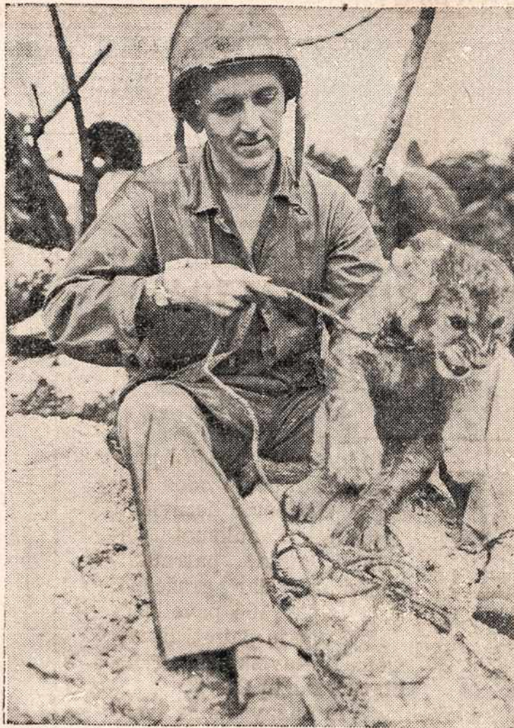
Kai Dėdės Samo marinai atsiėmė nuo japonų Roi salą, tai iš nežinia kur pasirodė šis 8-nių savaičių amžiaus liūtukas. Matosi epatinka kompanija, kad turi nosį suraukęs.