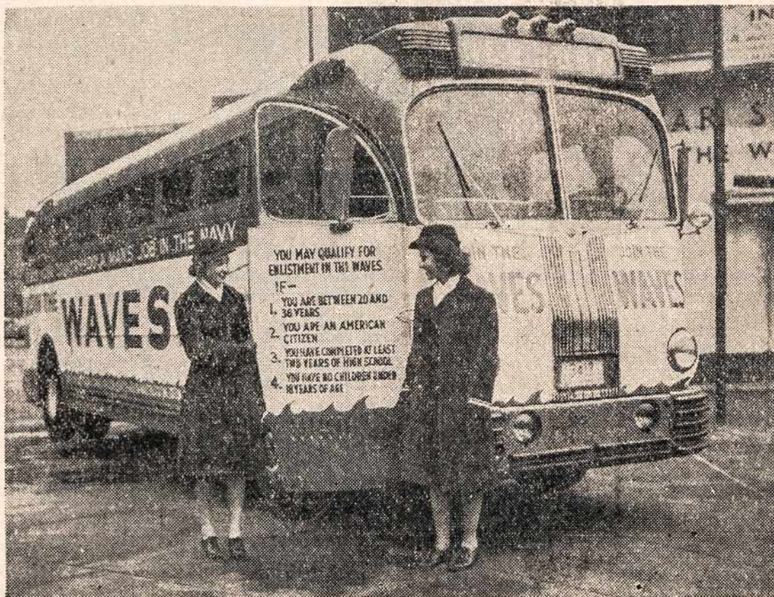
Istoriniai laikai, štai busas parengtas, kaip judamasis rekrutavimo bei įrašymo į Dėdės Samo gražiosios lyties tarnybą, ofisas. Jis rieda iš valstybės į valstybę ir teikia patarnavimą norintiems įstoti į WAVES.

Rusija yra gavus iš Jung. Valstybių per 'Lend-Lease' laivų ir kitokių karo reikmenų, daugiausia maisto, kuris Rusijai taip reikalingas. Taigi Rusija turėtų pasitenkinti tuo ką gauna iš Jung. Valstybių ir Anglijos.