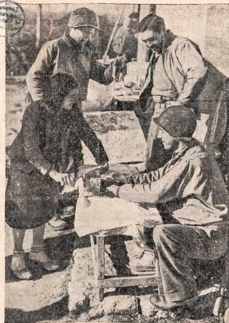
Dėdės Samo kariai Italijoje, prisiziūri, kaip tikrieji itališki makaronai ir špagetai daromi.

Kukurus: "Sugar" stamp No. 30 in Book Four good for five pounds indefinitely. "Sugar"