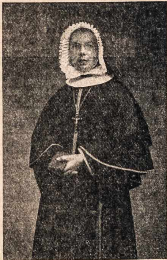
Marijos Nekaltos širdies vienuolė. Seselė viršininkė prižiūri rapsuotus ligonius, Jamaica, B. W. I.

ja. Nuo gegužės mėnesio jo akys pradėjo baisiai sopėti ir dabar sunku bu-vo jam matyti. Birželio mėnesį, jis du kart sirgo nuo kraujo bėgimo ir ši li-ga paliko jį pus-gyvį per keletą dienų.