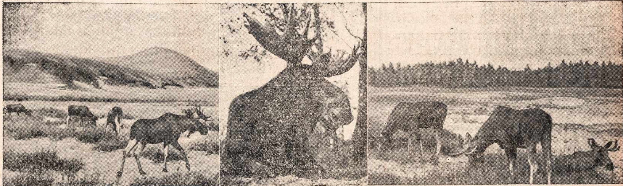
Klaipėdos krašte prie jūros, taip vadinamoj Nidoj, buvo šių gražių miško gyventojų sodyba. Jie ten buvo saugojami nuo pik-tadarių ir ten galėjai, kaip nepaprastame ir ypatingame gamtos slėpinyj, džiaugtis šių gyventojų aplinkuma. Bet ar šiandien tie miškų gyventojai dar turi anos saugumos, tai vargu galima tikrinti.

Tą ispūdį Maskva verkiant nori išdildyti. Vargu. Jau kas, kas, bet meškos propagandinė diplomatija to neatsieks.