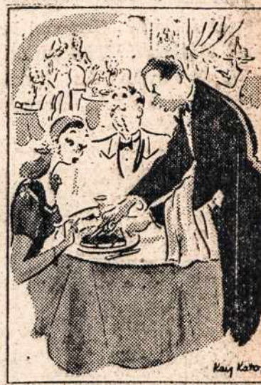
"PARDON ME BUT THIS PIECE GOES TO THE FAT SALVAGE DRIVE"