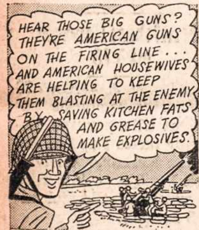
Boston Edison Company Sako

(LKFSB) Lietuvos miestų gyventojai sunkiai verčiasi su maistu. Bulvių jiems buvo leista su kotelėmis gauti po 100 kg. (kilogramas kiek daugiau kaip du svarai), tačiau pasirodė, kad pereitais metais bulvių derlius buvęs geresnis, taigi dabar bus duodama iš viso po 150 kg. asmeniui per sezoną.