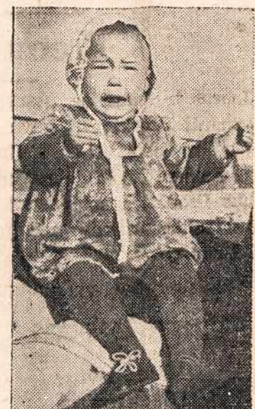
DESERTED—This Italian miss loudly bewails momentary desertion by her mother, who left her sitting on pile of blankets after Yanks helped both of them cross to Allied territory.

Vos tik vieną, vienintelį kartą, — jos dominacijai virš Herodo asmenybės, tegrasė rimtas pavojus, kuris turėjo šiek tiek pasisekimo, — tai Šv. Jono Krikštytojo asmenybė ir jo mokslas! Taip sensacinai patrauktas nuostabia Šv. Jono Krikštytojo as-