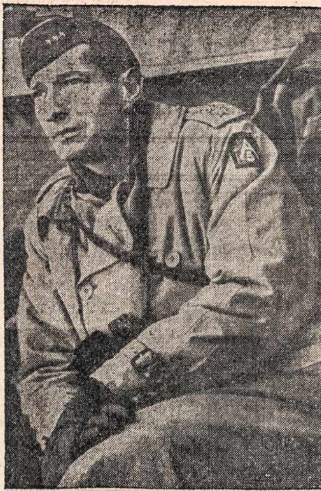
Lt. Gen. Mark Clark, penktosios Dėdės Samo Armijos karo vadas, Italijoje, atidžiai seka ir laivo puolimo eigą Anzio fronte.

Adresas: ŽVAIGŽDĖS Administracija, 488 E. Seventh St., So. Boston (27), Mass.