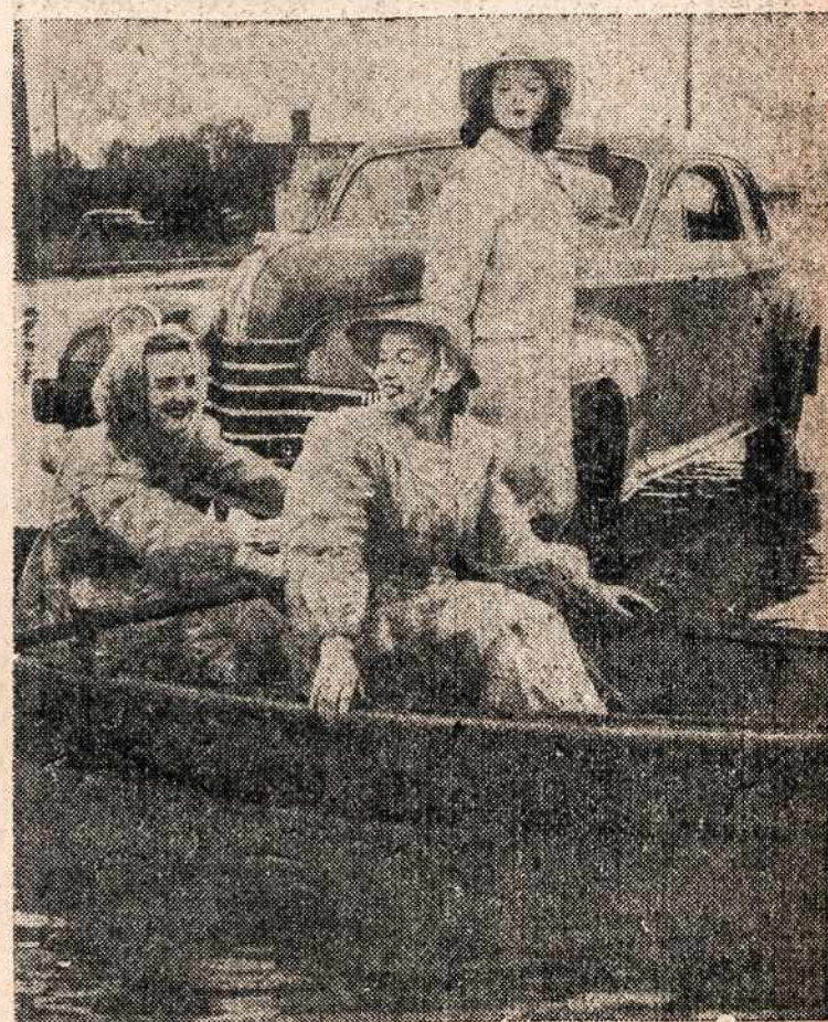
Kai Kaliforniją palietė audra, tai vietomis kelius užpylė vandeniu. Stai kelios Hollywood artistės palikę automobilį mėgina keliauti laiveliu.