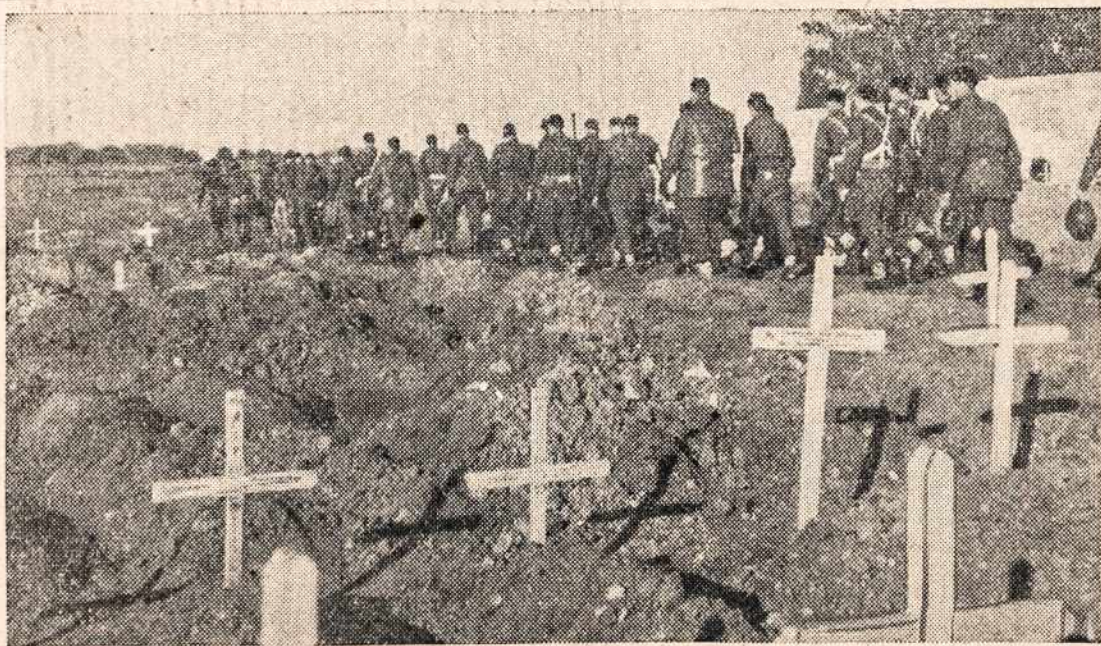
Liūdnam nusiteikusių Dėdės Samo kariai grįžta atidavę paskutinį partarnavimą savo draugams, kurie žuvo Anzio fronte, Italijoje. Jucis čia saugos šie tylieji balti kryžiai ir per laiką iššokusios laukų smilgos. Atsiminkime savo maldose žuvusius karo frontuose.

Iš viso, tu "moskų" — pasidavėlių "služba" nepavydėtina. Lend lease gauna tai gauna, bet kiek turi loti ir atloti.