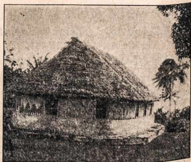
Kongo, Afrikoje misijų mokykla.

Tada abu keleviai užsi- sėdo ant kumelių ir štai (Patarl. 14, 34).