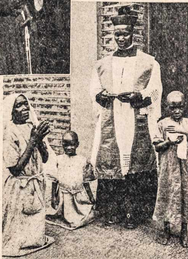
"Katalikų Bažnyčia klestės misijų kraštuose, kuomet vietos sūnūs ir dukterys stos į Misijonierių eiles".

Alpsta skausmuos' širdis. Priepuoliai mus suspaudė; Ant mūsų namų sugriaudė Juods debesys.