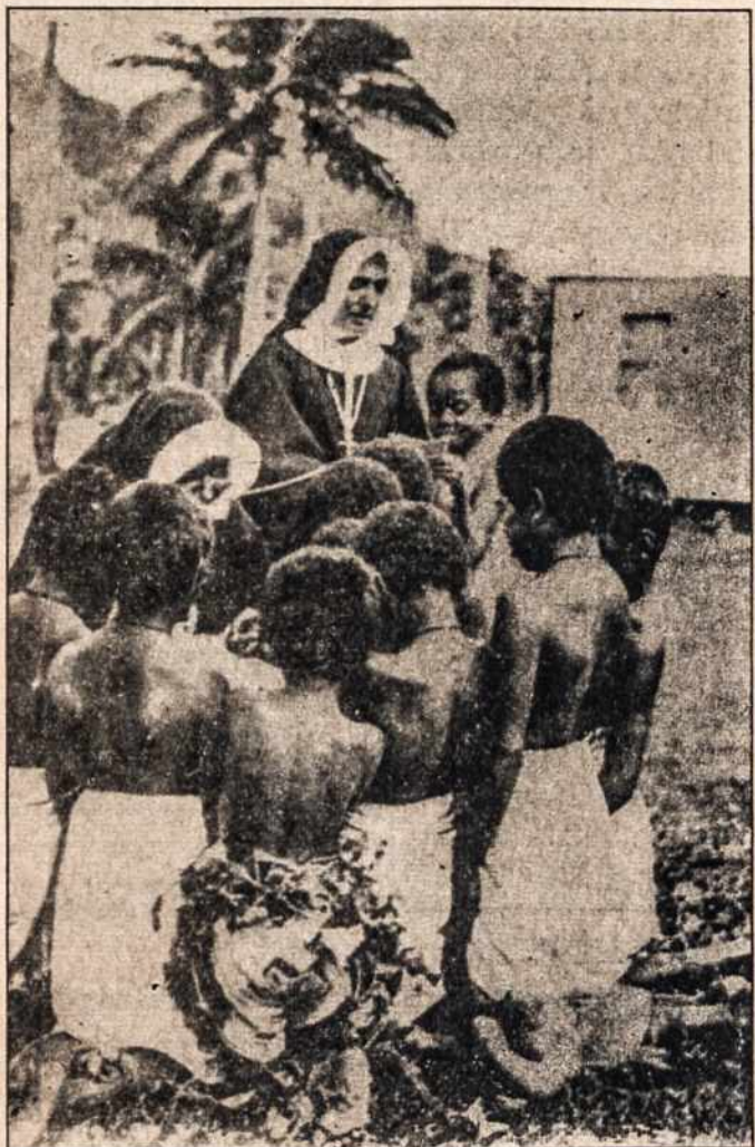
Gimstančioji Bažnyčia Afrikoje. Per Tikybos pamo- ką misijonierės seselės rodo šventųjų paveikslėlius mokiniams.