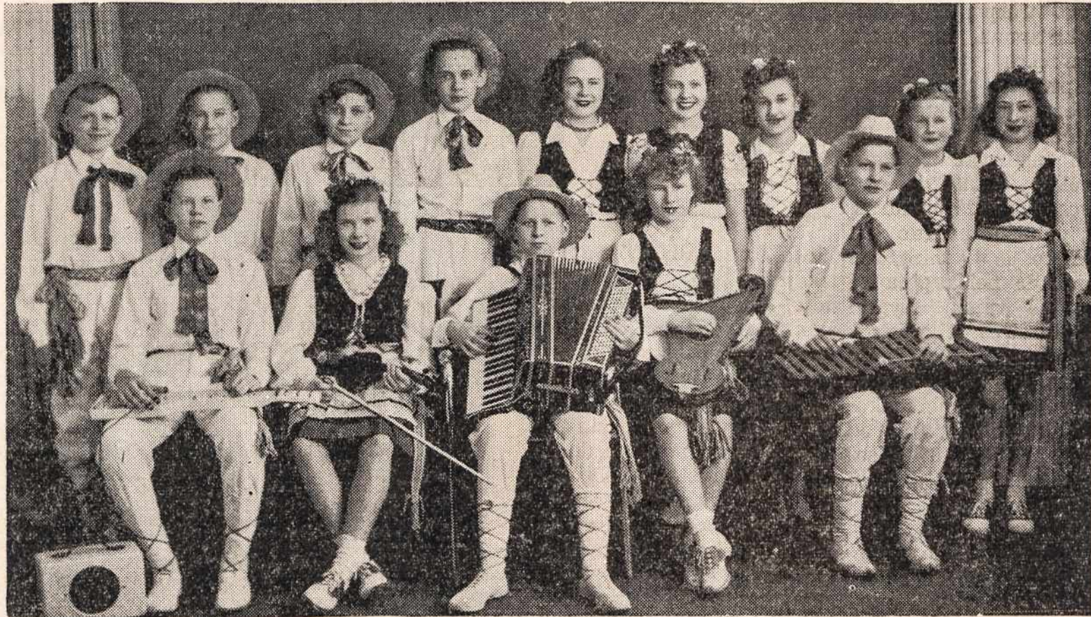
Dalis Bostono Lietuvių Jaunamėčių Tautinių Šokių Grupės

Ši grupė jau antri metai vyks į National Folk Festival, Academy of Music, Philadelphia, kur jie sveltimaučių minioms demonstruos lietuvių tautinius šokius. Įžanga 41c., 62c., 83c. Su karo taktais — 50c., 75c., ir Garbės po $1.00