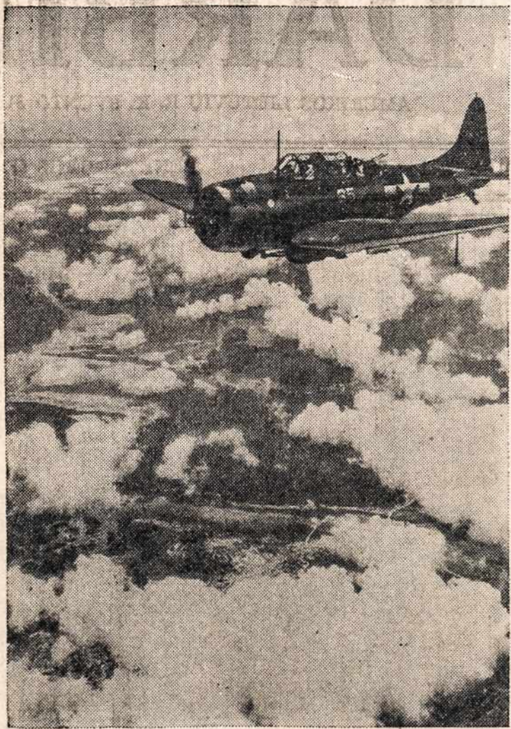
Amerikos bomberis plaukia oro bangomis virš Koror salos, Palaū grupėj. Atrodo, kad jis plaukia ir virš debesėlių.

Švedijos Šventė (LKFSB) Birželio 6 d.—Švedijos šventė. Ši valstybė turėdama didelę, palyginti, teritoriją, užimančią