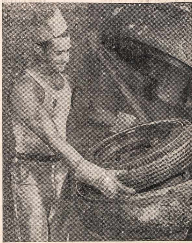
Tires made of buna S, synthetic rubber are rolling by the thousands from the Detroit plant of the United States Rubber Company to the Army. Used fat is an essential ingredient in the manufacture of synthetic rubber.