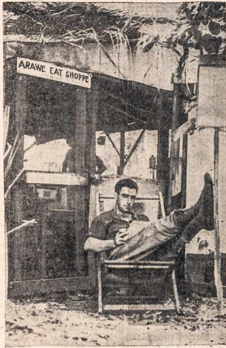
Arawa valgyklos vedėjas New Britain saloje, ilsisi.

Nuosirdžiai dėkojame visoms rengėjoms, visiems kurie kaip nors prisidėjo prie šios gražios iškilmės, o ypač visoms, kurios nesigailėjo nei laiko nei vargo atvykti į šv. Andriejaus parapiją. Kur randasi vienybė, ten žydi stiprybė. M.