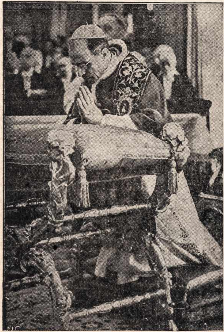
POPIEŽIUS PIJUS XII, didžiame susikaupime meldžiasi už pasaulio taiką.

Už tai, kad kentėjome, nusimine, Nors slėgė nelaisvės našta, Kad josios sulaužėme grandį gelžine Tik išverme darbo reta. (Maironis)