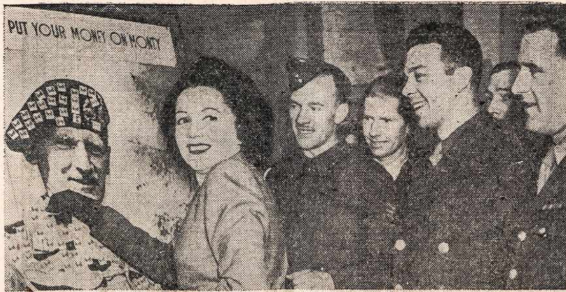
Žymūs amerikiečiai Londone paremdami Britų Karo Bonų ir Stampų pardavimą, atlanke parodą "Salute the Soldiers" apkabina tūlą paveiks- lą Britų Karo Stampomis.