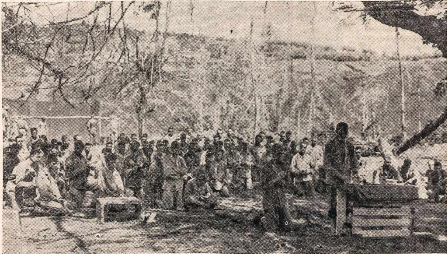
Manus saloje, Pacifike, kai valandėlė poilsio kariui suteikta, jis rimtai susikaupęs maldauja Aukščiausiojo, kad žygyje sektųsi, kad pergalę pasiektų, kad laimingai į namučius sugrįžtų.